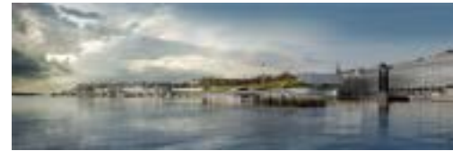
Музей Гуггенхайма в Хельсинки, проект PLUS-SUM Studio / Guggenheim Helsinki by PLUS-SUM Studio

Entries to the 9th annual International Design Awards can be made online; if you have work that you think deserves recognition, head to idesignawards.com to find out more.