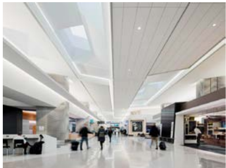
^ Международный аэропорт-3 в Сан-Франциско, зона посадки E, дизайн интерьера – Gensler / "San Francisco International Airport 3, Boarding Area E" by Gensler

Подробности об условиях участия в девятом ежегодном конкурсе International Design Awards можно узнать на сайте idesignawards.com .