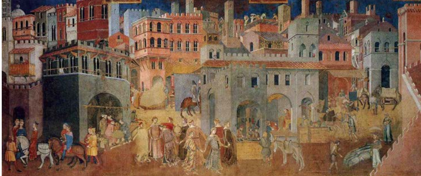
^ Амброджи Лоренцетти. Результаты доброго управления городом (XIV век). Счастливы квартал глазами художника Раннего Возрождения. Четкий ритм, человеческий масштаб, активная жизнь в общественных пространствах. Почти полное соответствие критериям Яна Гейла