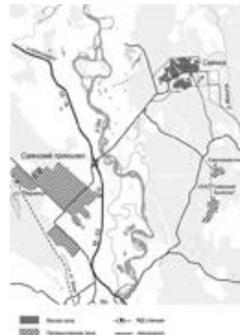
> Рис. 2. Социально-пространственные комплексы городов Шелехова и Саянска