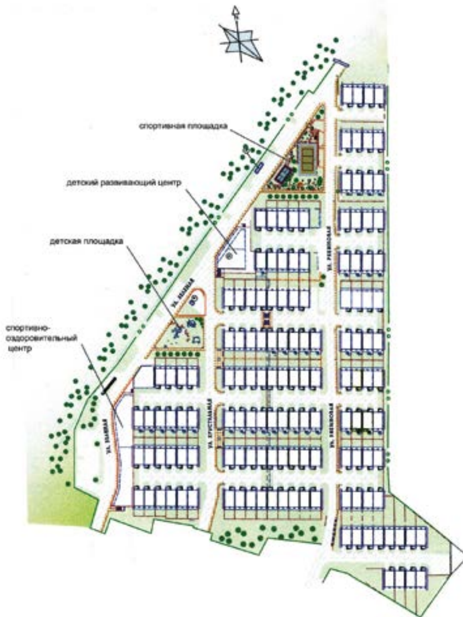
> Рис. 4. Поселок Хрустальный, Иркутск. Схема с детскими и спортивными площадками, объектами культурного обслуживания

Общий уровень организации социально-пространственной среды в Саянске можно определить как самый высокий в Иркутской области, поскольку отсутствует главная экологическая проблема загрязнения от промышленных предприятий, характерная в разной степени для всех городов области. Повсеместно имеются большие озелененные площади дворовых и общественных пространств. Одним из недостатков социально-пространственной среды Саянска можно считать недостаточно развитую систему общественного транспорта, которая вынуждает жителей пользоваться такси.