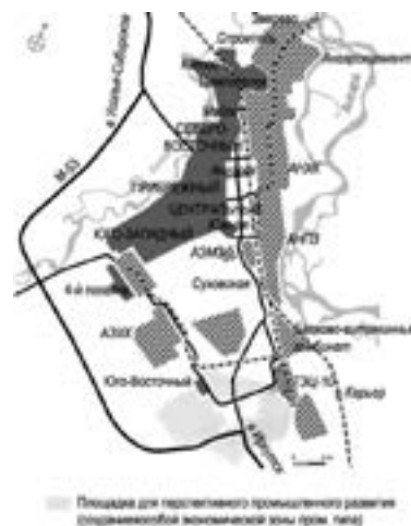
> Рис. 1. Социально-пространственные комплексы городов Ангарска и Братска

Keywords: the new city, the socio-spatial environment, development, content, comfortability.