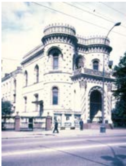
^ Дом Морозова. Архитектор В. Мазырин