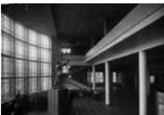
^ Дворец Культуры завода им. Лихачева. Архитекторы братья Веснины, 1933 год

Моисей Гинзбург, идеолог конструктивизма, в программной статье первого номера журнала «Современная архитектура» за 1926 год писал: «Одно десятилетие отделяет нас от архитектурного благополучия довоенного времени, когда в Ленинграде, Москве и других крупных центрах лучшие русские зодчие беззаботно насаждали всевозможные «стили». Много ли десятилетие? Маленькая трещинка времени. Но революция, уничтожив косные предрассудки и отжившие каноны, превратила трещинку в пропасть».