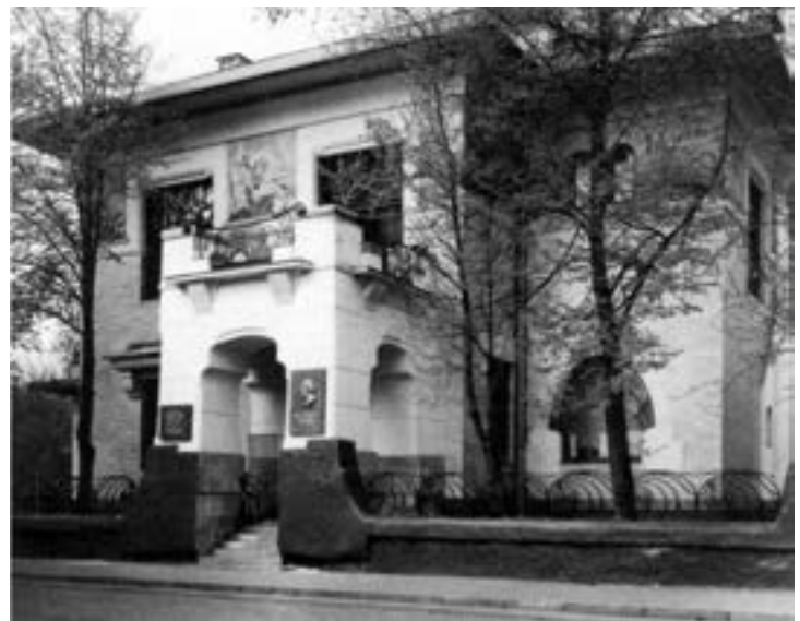
^ Особняк Рябушинского. Архитектор Ф. Шетель

начинается новая эра и революционные изменения в профессиональном сознании будут необратимы. Он ошибся на 80 лет. Необратимыми они стали в начале XXI века. Хотя всё еще живы в профессиональной среде неоклассические призраки. Правда, неоклассики ныне называют весьма сомнительные постройки и проекты. Например, те, что делаются в казанской мастерской «Антика». «Дети Иофана», конечно, более грамотны, но все равно современные «неоклассицисты» погоды в профессии не делают. Похоже, они пытаются говорить с миром цитатами на уже мертвом языке.