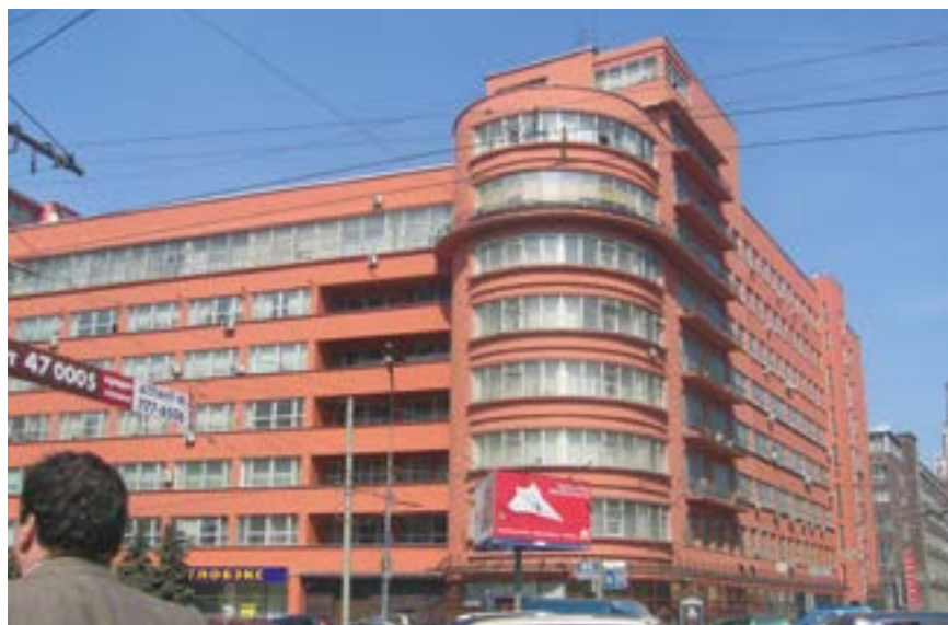
^ Здание Наркомзема. Архитектор А. Щусев