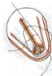
v План Москвы. Архитектор Н. Ладовский, 1932 год

масштабов, скоростей передвижения, меняется скорость передачи и масштаб потребления информации.