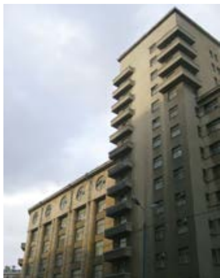
^ Здание общества «Динамо» в Москве. Архитекторы И. Фомин, А. Лангман, 1931 год