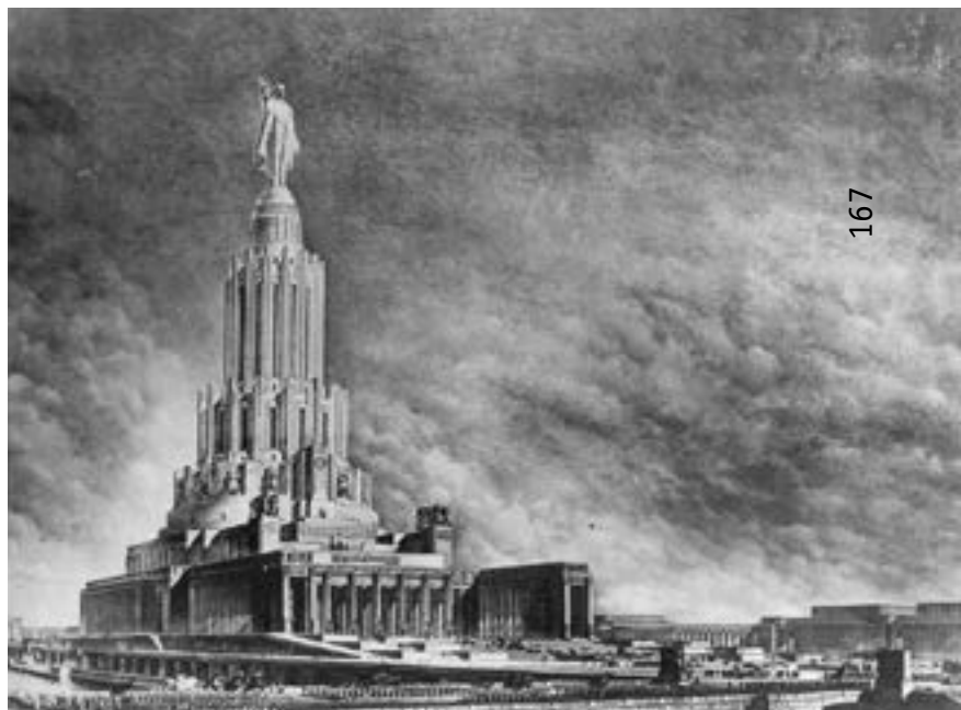
v Дворец Советов. Автор проекта Б. Иофан, 1931–1933 годы

что Жолтовский. А если все равно, значит, все хорошо. Какие уж тут тонкости и различия!