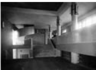
^ Интерьер клуба завода им. Лихачева. Архитекторы братья Веснины