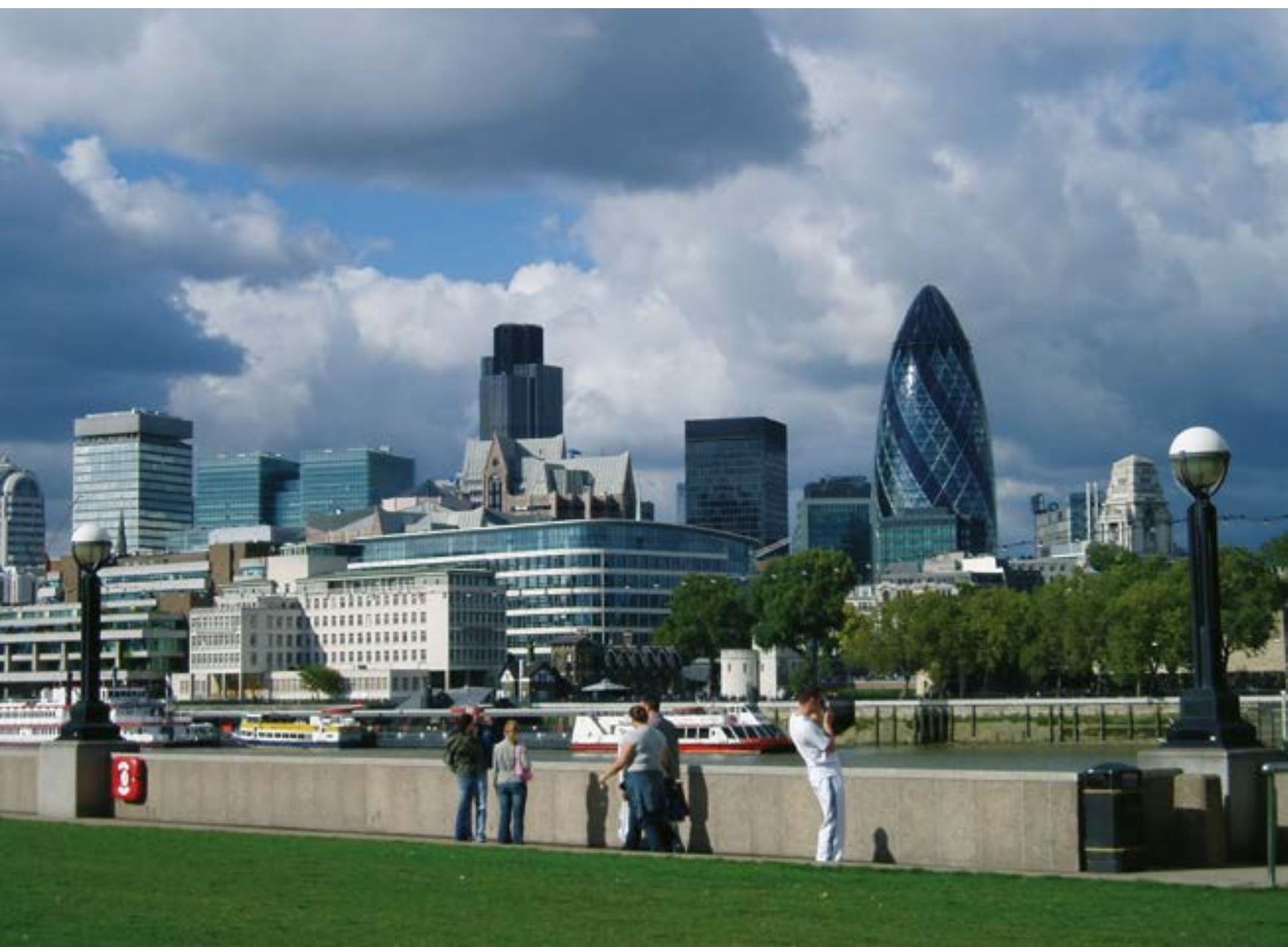
v «Огурец» Нормана Фостера