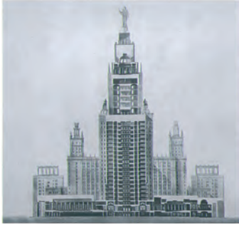
ЗДАНИЕ МГУ Москва, 1949–53, реализация архитекторы – Л. Руднев, С. Чернышев, П. Абросимов, А. Хрыков, В. Насонов BUILDING OF THE MOSCOW STATE UNIVERSITY Moscow, 1949–53, realization architects – L. Rudnev, S. Chernyshev, P. Abrosimov, A. Khryakov, V. Nasonov