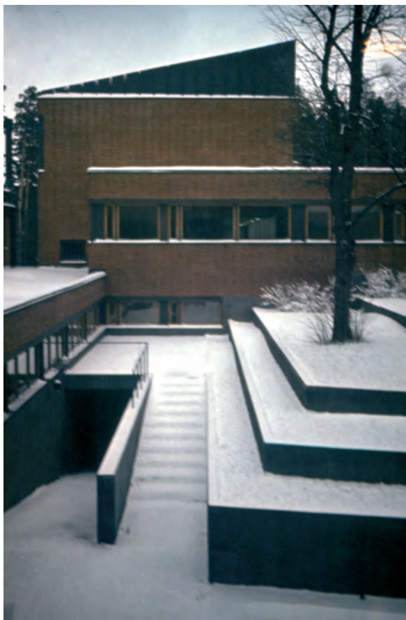
Алвар Аалто. Технический университет в Отаниemi

Итак, будем веселиться, пока мы молоды! После приятной юности, после тягостной старости нас возьмет земля.