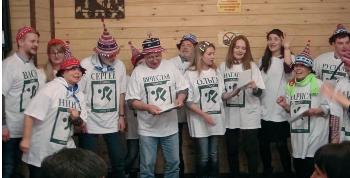
> Приветствие команды Томска