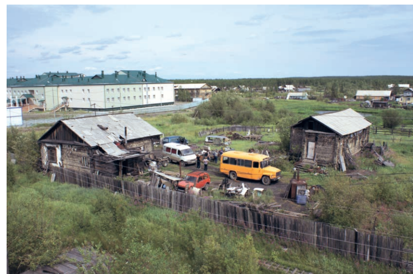
в Рис. 6. Лагерные строения в Хандыге / Camp facilities in Khandyga