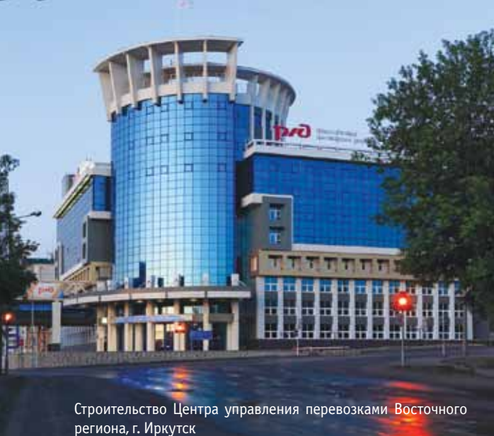
Строительство Центра управления перевозками Восточного региона, г. Иркутск