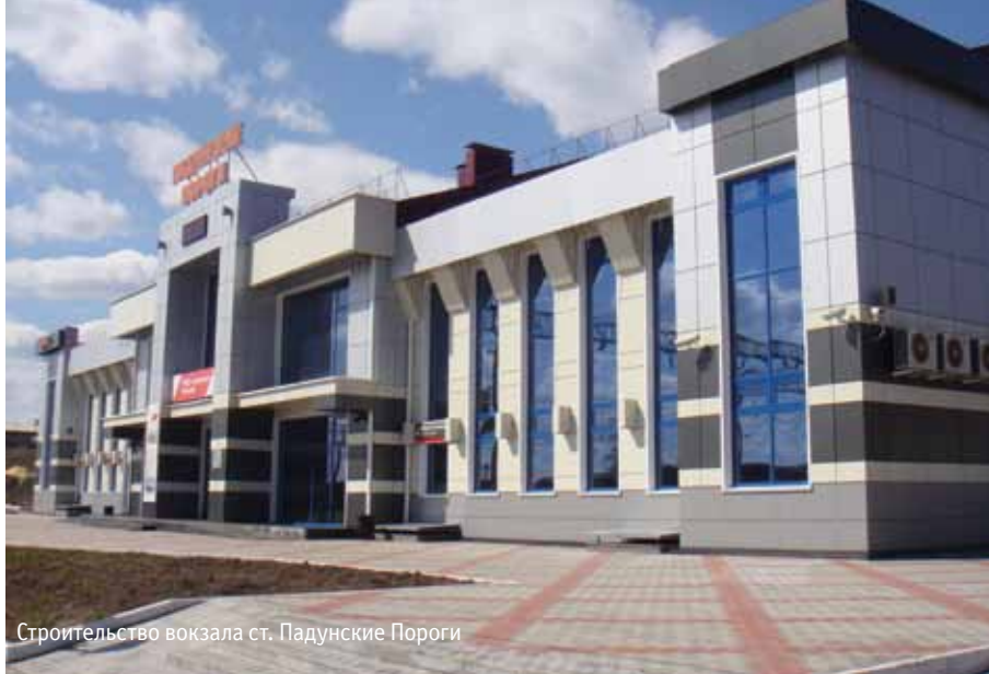
Строительство вокзала ст. Падунские Пороги