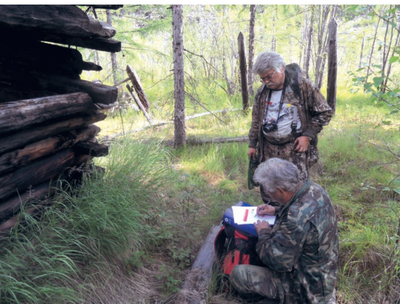
в Рис.11. Обмеры сохранившегося строения / Measurements of the survived structure

Не доезжая до Тополиного, остановились на ночевку, установили палатки, занялись приготовлением ужина. Все, как обычно, как и в предыдущие дни.