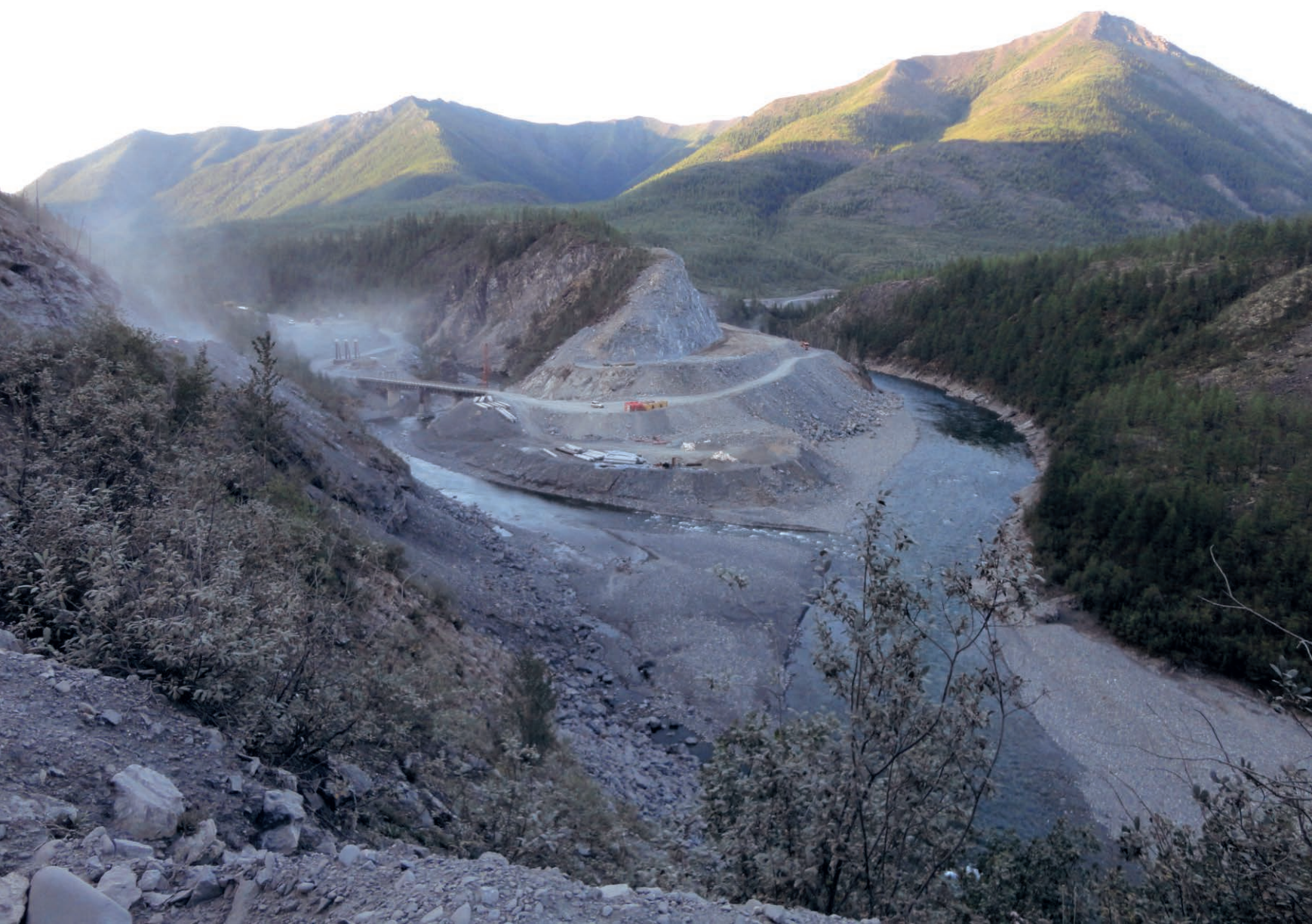
в Рис.12. Участок дороги под названием "Заячья петля" / A part of the road called "Hare's Loop"