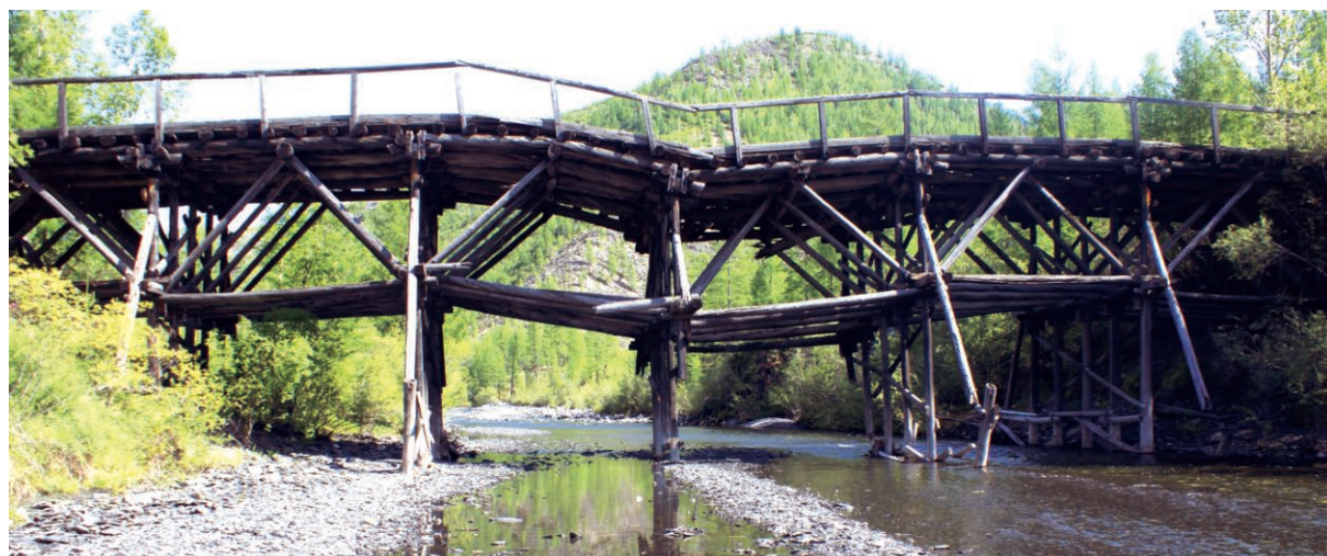
> Рис. 7. Остатки деревянного моста / Remains of a wooden bridge

В 2003 г. читинскими исследователями (Василевский В.И., Жеребцов Г.А., Соловьев А.В.) была издана небольшая, в 62 страницы, книжечка под названием «Карательная политика Советского государства. Краткая хронология событий», в которой перечисляются документы, касающиеся репрессий, за период с 1918 по 2003 годы. В ней собрано все – от репрессий до увековечивания памяти репрессированных и издания фолианта под названием «Книга памяти». Из перечня документов, в том числе и рассекреченных после 1998 года, удалось выяснить, например, что по личной санкции Сталина и его ближайших соратников по Политбюро к расстрелу и большому срокам наказания были приговорены почти 45 тысяч человек (по 383 спискам). Данный блок документов так и назывался – «Сталинские списки». Кстати, эта