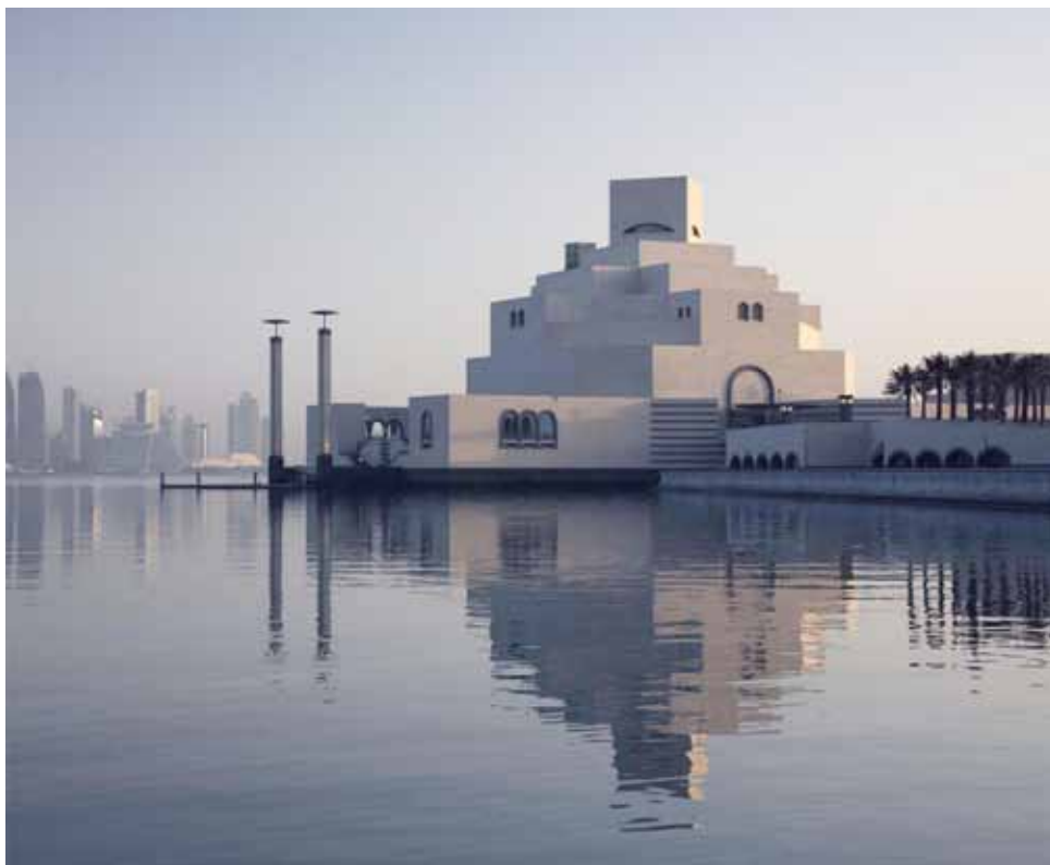
Museum of Islamic Art, Doha, Qatar designed by Ieoh Ming Pei, completed 2008 / Музей исламского искусства в Дохе (Катар) по проекту Юй Мин Пэя, 2008 год.

Malaysian architect and town-planner Esa Mohamed has been elected UIA President during the UIA General Assembly, which took place after the Congress, from 7 to 9