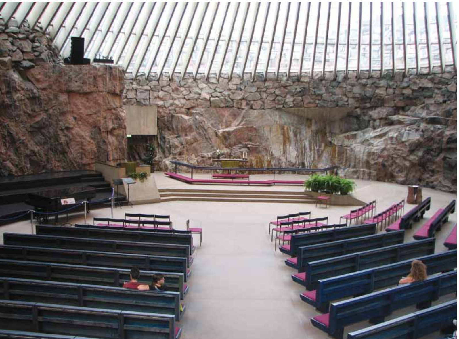
▽ Интерьер церкви Темпелиаукио братьев Суомалайнен в Хельсинки (1969)