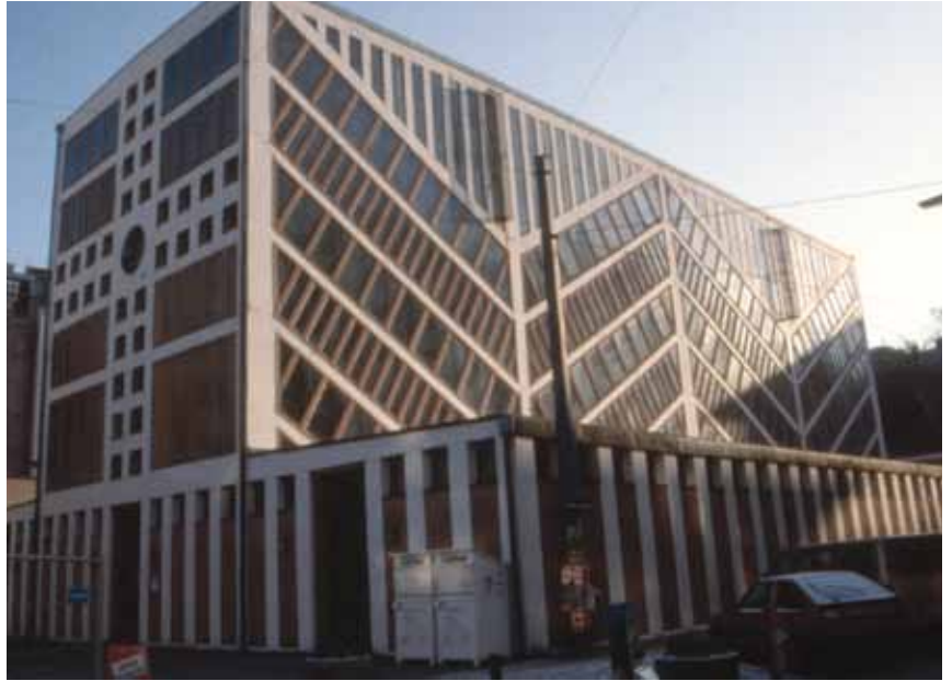
△ Гарнизонный православный храм-маяк