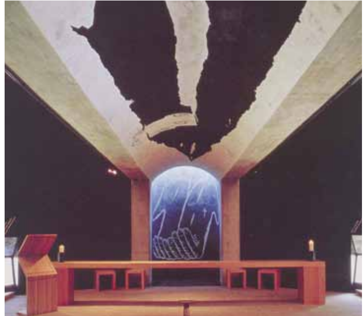
▲ Капелла Ле Корбюзье в Роншане (1955)

времена, шедевров много не бывает. Очень показательно, что в Дубае продают в качестве сувениров в основном изображения двух сооружений – знаменитых Бурдж-Халифа («Иглы») и Бурдж-аль-Араб («Паруса»). А ведь многие объекты в Дубае претендовали на уникальность. Интересно, что мечети в городе архитектурных чудес строятся вполне традиционные. Конечно, каменная резьба сделанная вручную, заменена в них менее трудоемкими декоративными элементами, и муэдзины уже не поднимаются на минареты, чтобы призывать правоверных на молитву (на минаретах есть динамики), но тем не менее связь времен в мечетях, построенных из новых материалов и по новым строительным технологиям, не прерывается. Традиция есть традиция.