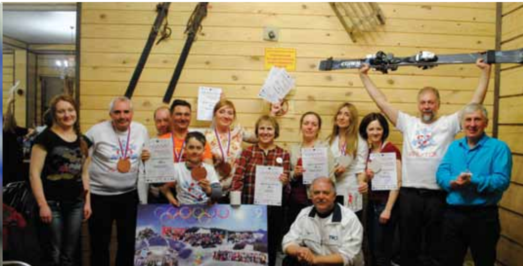
Команда Иркутска после церемонии награждения