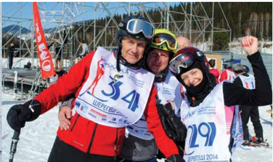
Династия Крайних (Новокузнецк) – абсолютные чемпионы