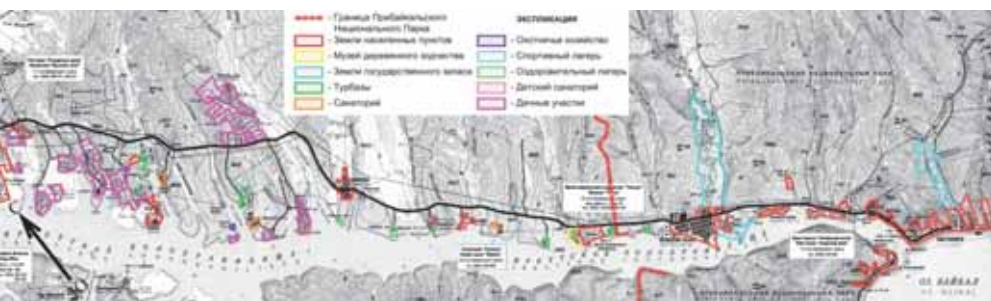
^ Поселок Листвянка и Байкальский тракт