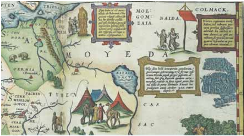
< Фрагмент карты Дженкинсона. В центре – Китайское озеро. Справа от него – окаменевшие люди. Выше и правее – каннибалы-самоеды, поклоняющиеся Солнцу в виде красной тряпки на шесте. Левее и выше – поклонение Золотой бабе. / A fragment of Jenkinson's map. In the center there is Chinese Lake. On the right – fossilized people. Above on the right – cannibals-ouroboros worshipping the Sun depicted as a red cloth on the stick. Above on the left – worship of the Golden lady