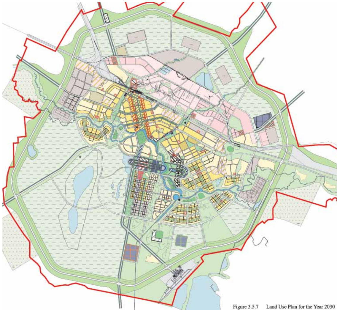
Figure 3.5.7 Land Use Plan for the Year 2030

Since the new capital will go through rapid growth, Kurokawa's plan proposes a Linear Zoning System (Linear Land Use) instead of the Radius Pattern, which has a core at the center of the city. The Linear Zoning System is based on