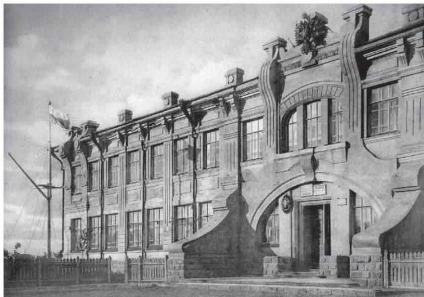
Первый корпус Политехнического института

на востоке азиатского региона, начало века ознаменовалось строительством новых крупных городов, в архитектуре которых проявились не только русские, но и общеевропейские стилистические новации. Получившие образование в России и европейских странах архитекторы и инженеры на огромном строительном полигоне, каким стала Китайская Восточная железная дорога, стремились внедрить все самое лучшее, передовое. Харбин явился ярким и убедительным подтверждением того, что новые идеи в архитектуре могут полнее всего воплотиться там, где присутствует размах строительства и где вложены крупные финансовые ресурсы. Харбин как очаг русской культуры прекрасно адаптировался к условиям культуры азиатской страны. Сохранившиеся памятники архитектуры Харбина – убедительное свидетельство сотрудничества в специфических условиях на протяжении нескольких десятилетий разных культур – европейской и азиатской. Тем более значимым представляется русское архитектурное наследие в Китае, требующим к себе не только пристального внимания, но и глубокого, систематического исследования.