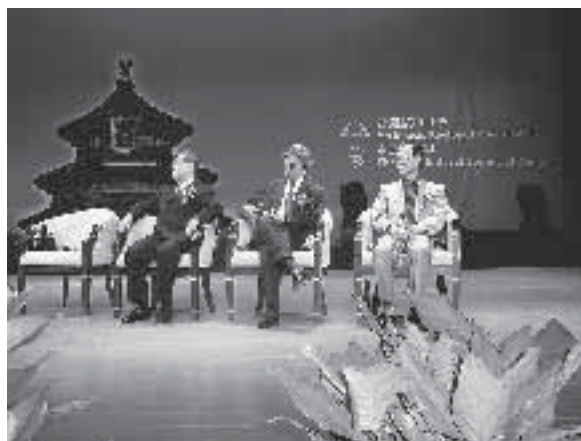
текст и фото Елена Григорьева