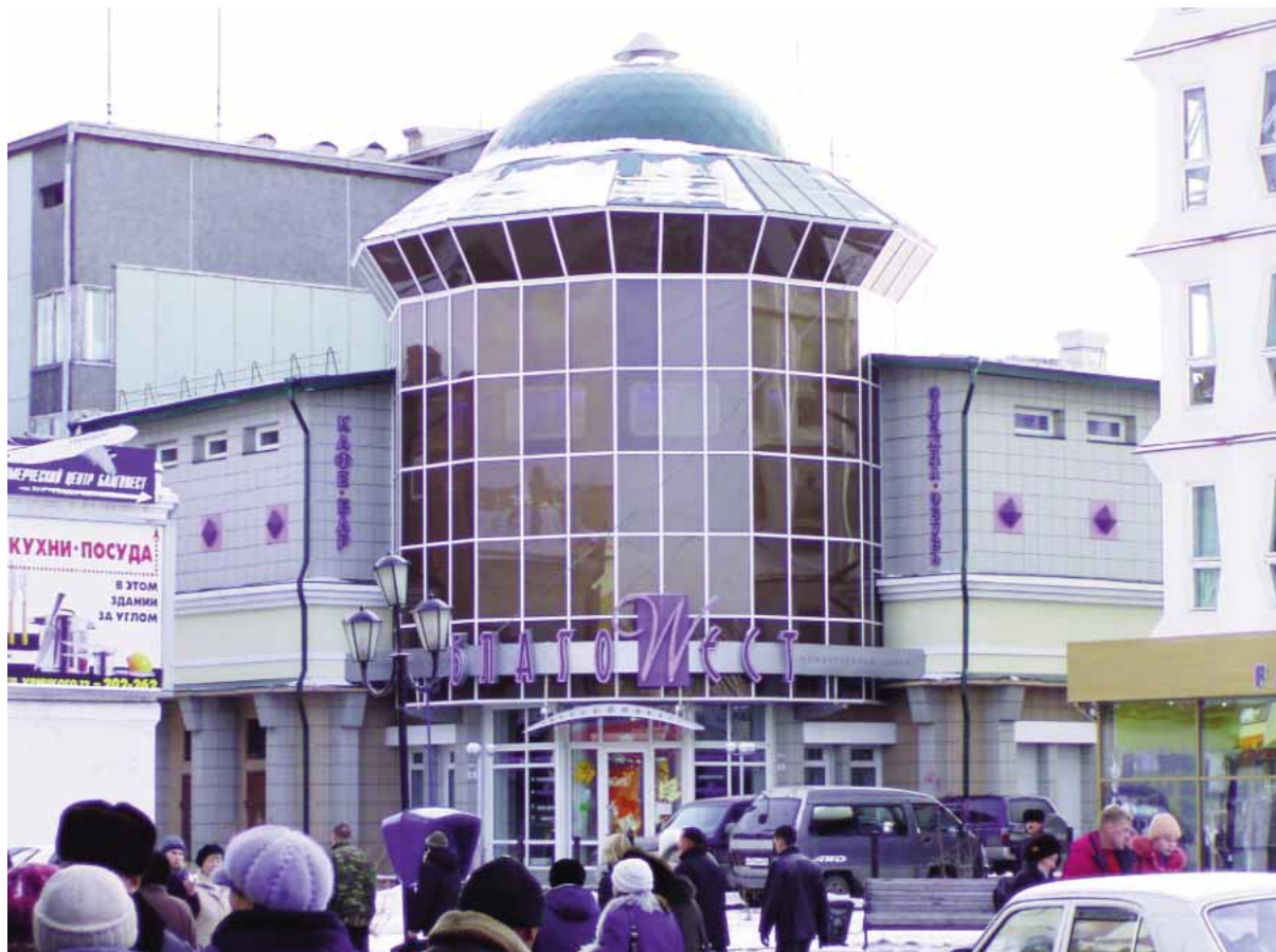
Вентилируемый фасад и алюминиевый витраж здания ТК «Благовест»