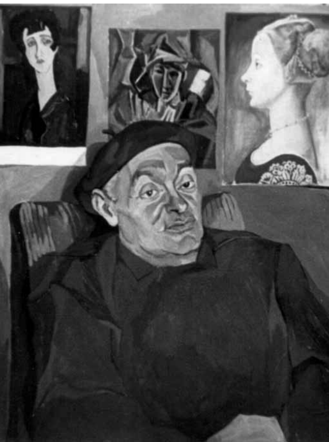
Портрет Бориса Кербеля, Г. Новикова