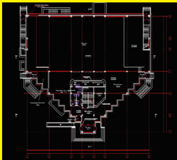
План на отм. 0.000