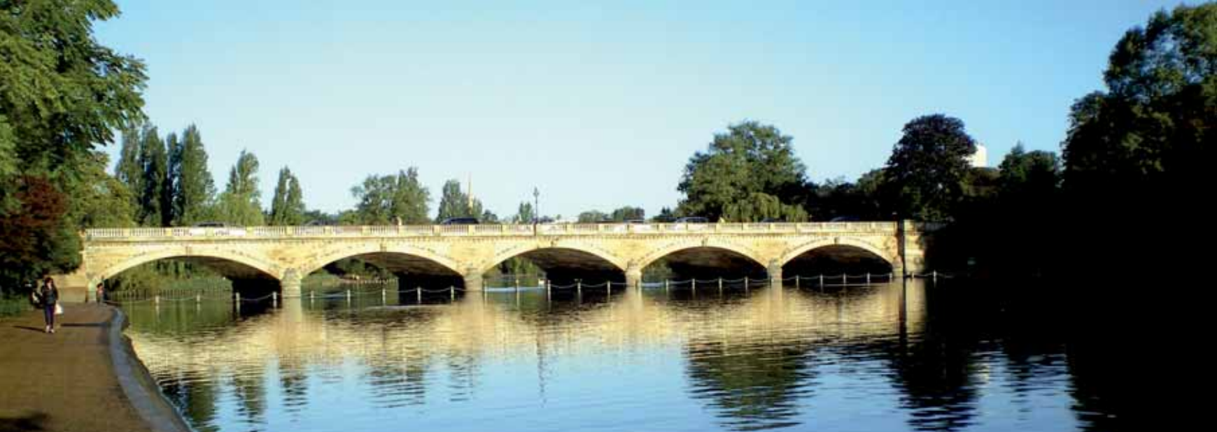
^ Мост на озере Серпентайн