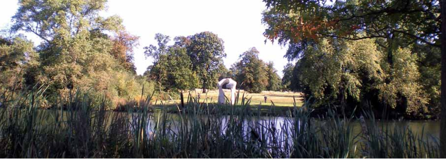
^ Неизвестная скульптура на другом берегу