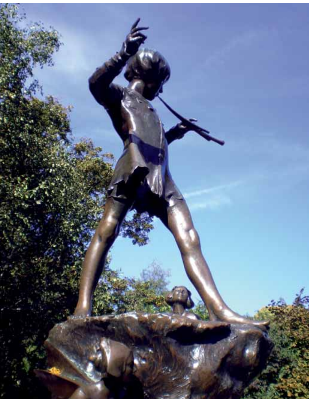
v Памятник Питеру Пену

емом, в котором два потока воды бегут навстречу друг другу через искусственные пороги и, встречаясь, исчезают в незаметной щели. Нет трибуны ораторов, нет Даши Намдакова. Устали. Ушли.