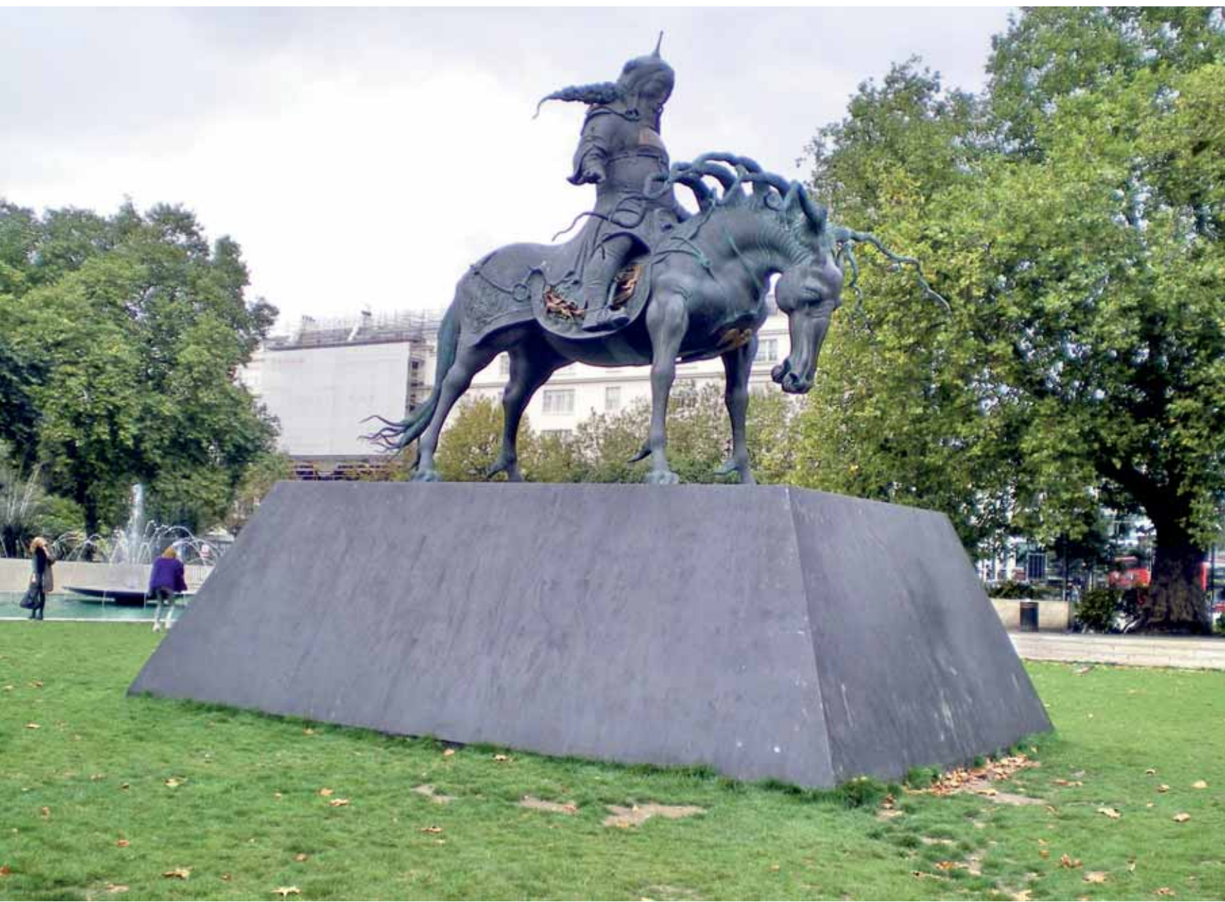
v Над пропастью