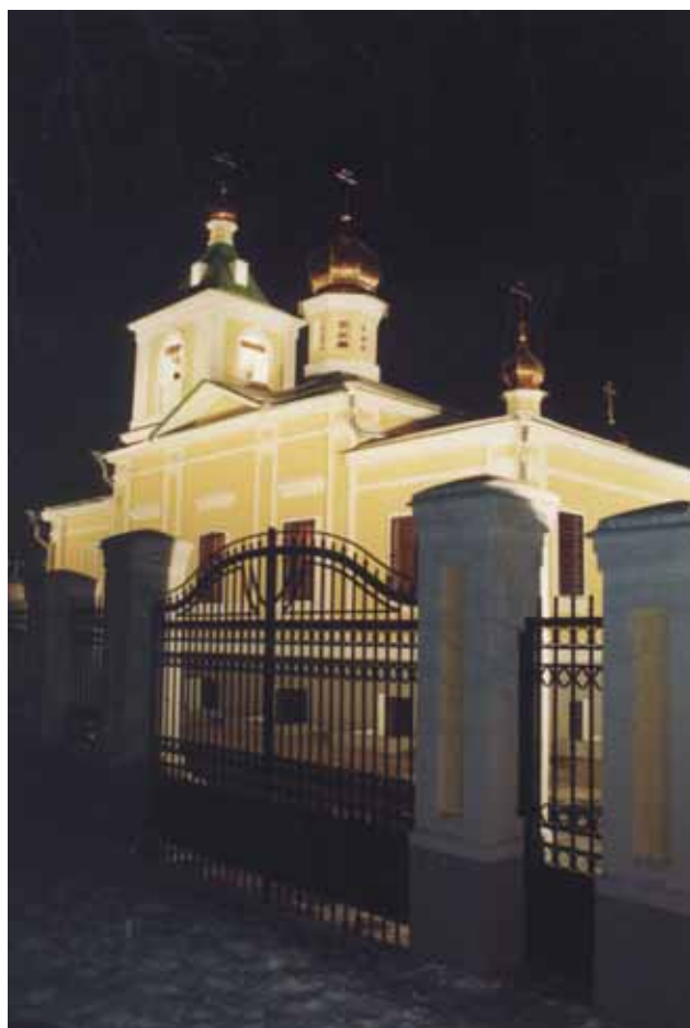
Вид церкви с юго-востока