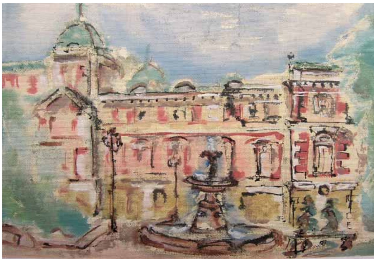
< Городской театр Боковой фасад