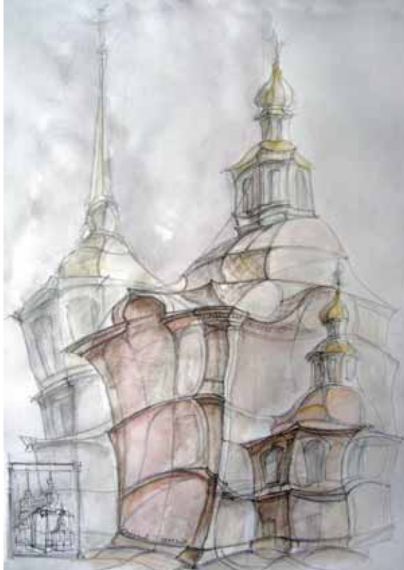
< Харлампиевская церковь («Морская») ул. Троицкая, 59 (5-й Армии)