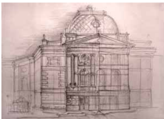
< Городской театр (камен., 1894–1897 гг., арх. В. А. Шретер). Центральный фасад