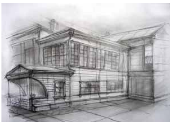
< Усадьба декабриста С. Г. Волконского (дерев., 1838 г.). Главный дом (вид со двора). пер. Волконского, 10

стоит, но «долгая память дерева и камня» (В. Распутин) все-таки предполагает и изменение – не перестройку или модернизацию – изменение, обновление восприятия. Алексей Островерхов стремится еще раз обратить внимание иркутян (в первую очередь именно их!) на оригинальность и незаметную для поверхностного взгляда изменчивость самого «постоянного» вида искусства – архитектуры.