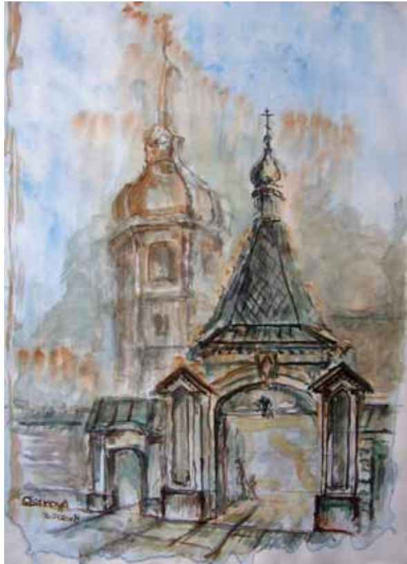
< Знаменский женский монастырь