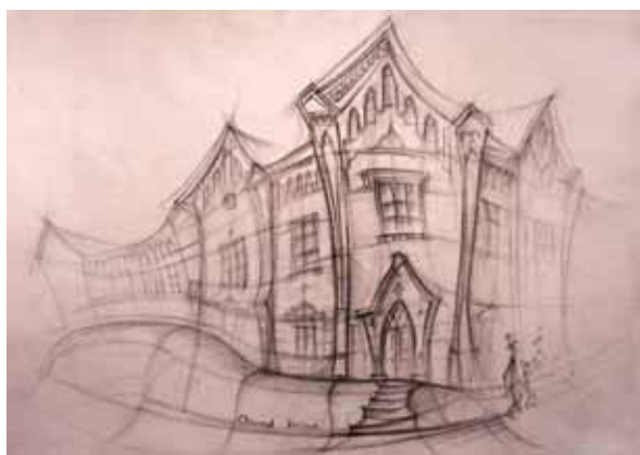
< Базановский вос- питательный дом (камен., 1880–1883 гг., арх. Г. В. Розен). Главный дом. ул. Амурская, 20 (Ленина)