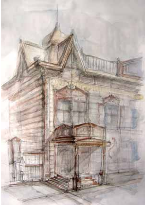
< Доходный дом А. И. Шастина (дерев., 1910–1911 гг.). Фрагмент. ул. Жандармская, 21 (Энгельса)