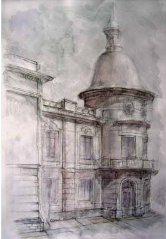
< Здание Иркутского отделения Русско- Азиатского банка (камен., 1910–1912 гг., арх. В. И. Коляновский). Центральный вход. ул. Амурская, 38 (Ленина)