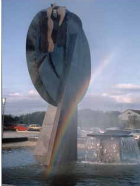
< Вячеслав Колейчук. Проекты двух объектов для городской среды