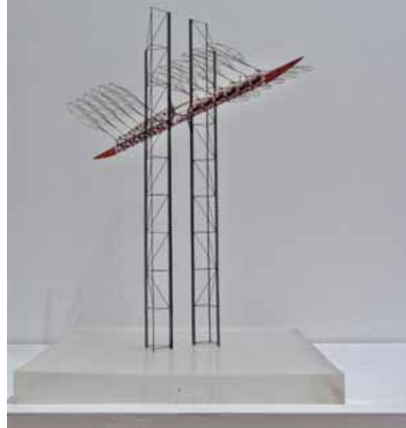
^ Юрий Аввакумов. Летающий пролетарий. Проект объекта для городской среды

Число объектов современного искусства в Москве я оцениваю в 1–3% от общего числа произведений монументального искусства в городе. Это мой первый тезис. Много это или мало – 3% произведений современного искусства для городской среды? Ответ зависит от того, в чем состоит миссия (назначение) традиционных, обычных произведений и произведений современного искусства.