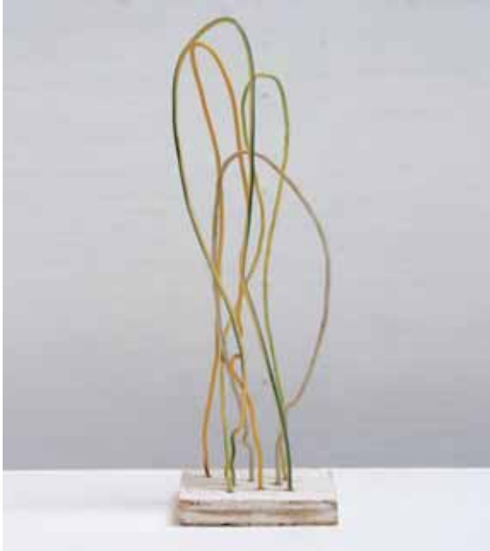
< Василий Павловский. Проект объекта для городской среды