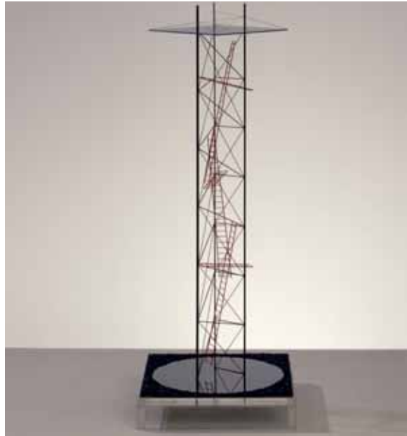
< Юрий Аввакумов. Полярная ось. Проект объекта для городской среды

визуального лица, транслирующего социуму, каждому жителю и всем приезжающим в Москву духовные цели и ценности. Речь идет, в конечном счете, о том, чтобы население Москвы и все, кто бывает в столице, своими глазами увидели и смогли почувствовать, что у человечества, у нас с вами, у тех, кто жил до нас, и кто придет после нас, существует «священное стремление именно в этом мире, где мы, как вспышка во мраке, возникли на одно мгновение из черного небытия бес-сознательного существования материи, осуществить требования Разума и создать жизнь, достойную нас самих и смутно угадываемой нами Цели» (Андрей Сахаров, из Нобелевской лекции, 1975 год).