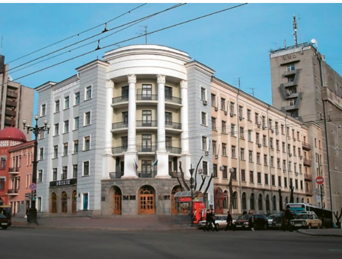
^ Рис. 5. Здание бывшей гостиницы Дальлеспрома. Архитектор Е. Серебряков. Годы строительства – 1935–1937