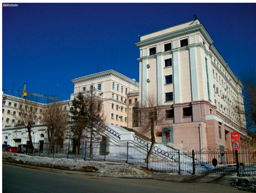
в Рис. 4. Здание Управления НКВД. Архитектор П. Панченко. Построено в 1936 году

Третий период (постсоветский) развития архитектуры Хабаровска – с 1991 года по настоящее время. В стране произошли значительные экономические и социальные изменения, начался процесс приватизации и восстановления исторических зданий. Были отреставрированы первые объекты, которые стали символами города. Частные инвесторы активно вкладывали средства в строительство, что способствовало появлению разнообраз-