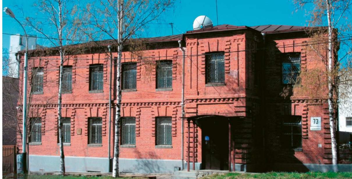
> Рис. 3. Здание штаба Хабаровского отряда пограничных судов. Построено в 1920-е годы

Первый период (ранний) – с 1860 по 1917 год. В это время территория активно осваивалась в качестве военного поста. Архитектура той эпохи представлена деревянными зданиями и простыми сооружениями, типичными для военных гарнизонов. С развитием города и началом строительства каменных зданий в 1890-х годах появляется кирпичная эклектическая архитектура, которая в большей степени характерна для ведомственных объектов. В это время были возведены военные, административные и складские постройки, а также инженерные объекты. В большом количестве строились частные здания – доходные дома и домовладения.