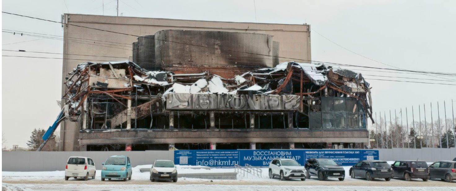
^ Рис. 8. Здание Хабаровского краевого музыкального театра. 2024

обогащает культурный ландшафт города, но и способствует его устойчивому развитию. Результаты проведенного исследования могут стать основой для разработки эффективных стратегий, направленных на сохранение архитектурного наследия и улучшение качества городской среды.