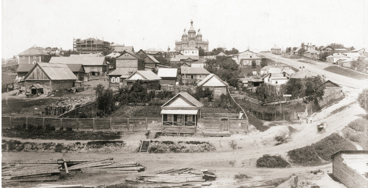
< Рис. 2. Деревянная Хабаровка

деятельности в формировании архитектурного ландшафта городов. Это подчеркивает необходимость дальнейших исследований в этой области.