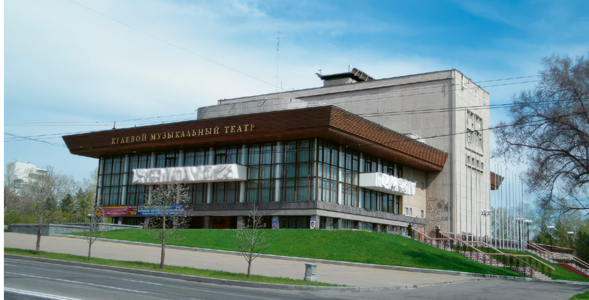
> Рис. 7. Здание Хабаровского краевого музыкального театра. Архитектор М. Шейнфейн

ям при сохранении исторического контекста. Принцип «новое в старом» предполагает сохранение исторического объема здания с добавлением современных элементов дизайна и функциональности. При этом могут использоваться современные материалы, технологии и планировочные решения, которые придают зданию новый облик, не нарушая его историческую целостность.