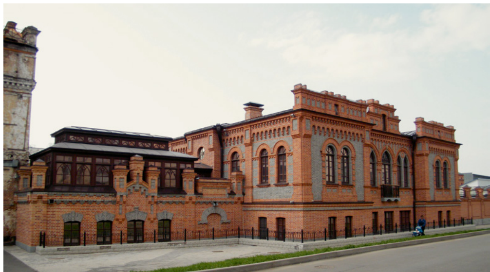
^ Рис. 11. Табачная фабрика Тифонтая

но и материалов. Приспособленные к современному использованию здания играют важную роль в формировании архитектурно-социального пространства. Однако в последние годы интеграция претерпела значительные изменения, и теперь она вмещает в себя общественное пространство. Включение в реконструкцию не только самих объектов, но и пространственной организации территории позволяет сочетать исторический контекст здания и среды.