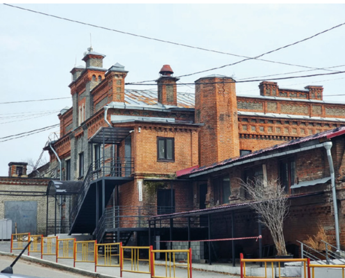
^ Рис. 10. Макаaronная фабрика Тифонтая. 2024