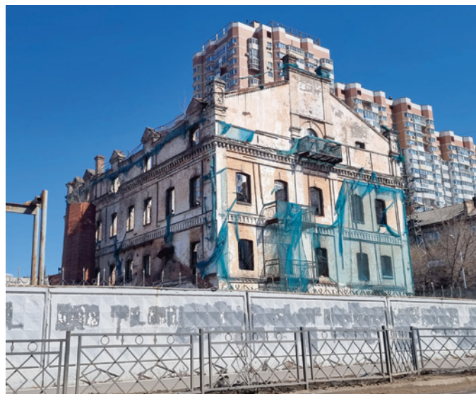
> Рис. 9. Паровая мельница Тифонтая. 2023

в 2013 году, проведенные с учетом исторической ценности объекта, позволили сохранить его архитектурные особенности (рис. 5, 6). При этом мало внимания было уделено развитию территории и внутреннему наполнению объекта. Фактически здание рефрижератора хоть и используется как коммерческая площадь, но все же не отвечает культурным требованиям. Этот случай подчеркивает необходимость комплексного подхода к реставрации и адаптации объектов культурного наследия, что позволит не только сохранять, но и развивать культурные пространства, обогащая жизнь общества.