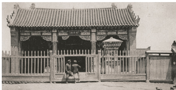
> Рис. 7. Китайская кумирня. 1903