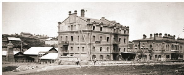
> Рис. 8. Постройки фирмы Тифонтая. Вид на мельницу и табачную фабрику