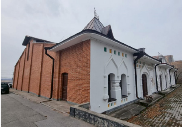
^ Рис. 5, 6. Здание рефрижератора. Фото автора. 2024