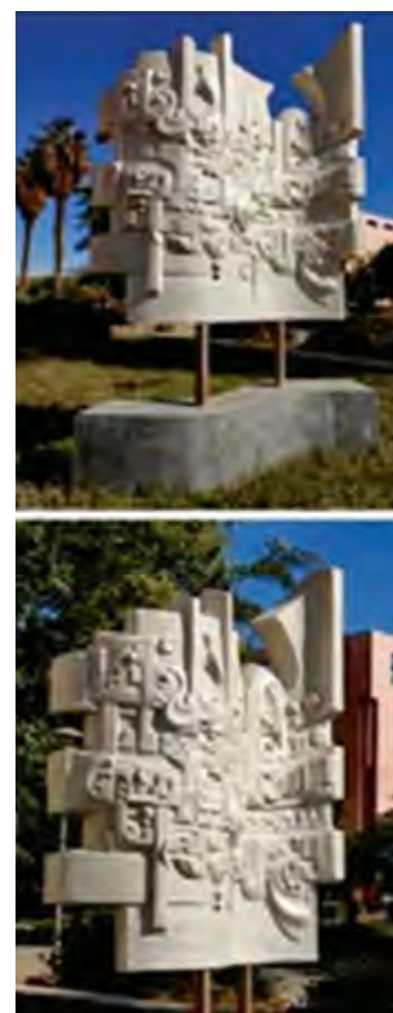
^ Рис. 1. Сидки Джамал. Композиция № 2. Стекловолокно. Каир, Египет. 2018 / Fig. 1. Sidqi, Jamal. (2018). Composition No. 2. Fiberglass. Cairo, Egypt