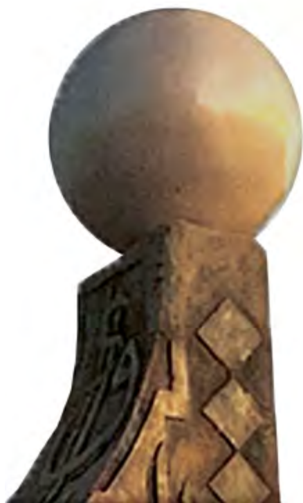
< Рис. 18. Четвертая часть – верхняя часть мемориала. Диаметр 50 см. Железо. Ирбид, Иордания / Fig. 18. Part Four – the upper part of the memorial. 50 cm diameter. Iron metal. Irbid/Jordan