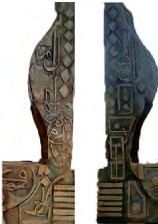
> Рис. 14 и 15. Средняя часть памятника. 300 см × 100 см × 50 см. Стеклофибробетон. Ирбид, Иордания / Fig. 14 & 15. The middle body of the monument, 300 cm × 100 cm × 50 cm. GRC. Irbid/Jordan

Задняя сторона этой части мемориала (рис. 15) так же важна, как и передняя. Исследователь использовал арабские буквы, геометрические фигуры и стихи из Корана, такие как «Нун» (Аль-Калам, 1), в качестве абстрактных элементов при создании этой работы и придании ей общей формы в различных изображениях и размерах. Этого удалось достичь, опираясь на такие принципы дизайна, как преувеличение, повторение и асимметричный баланс, и убедившись в том, что эти элементы будут взаимосвязаны с линиями, пространствами, поверхностями и объемами в работе. Были установлены взаимосвязи между элементами и скульптурными особенностями (Helmi, Atyh, Abdlsamad, & Ahmed, 2023).