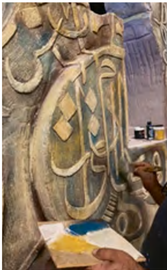
< Рис. 10. Мемориал окрашивается в белый цвет, которым снаружи окрашено основание / Fig. 10. The memorial is painted white, which is the foundation's exterior paint

< Рис. 11. Этап установки мемориала на предназначенное для него основание высотой 100 см, шириной 80 см и длиной 250 см / Fig. 11. The stage of installing the memorial on the base designated for it, measuring 100 cm high, 80 cm wide, and 250 cm long