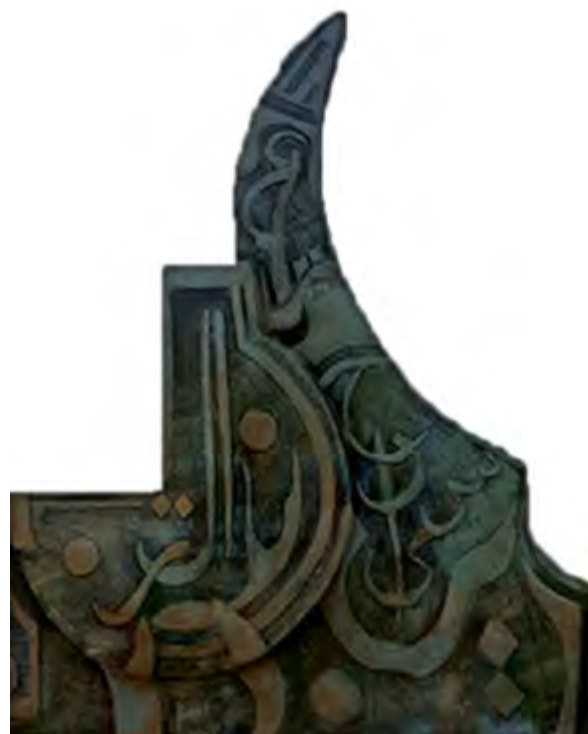
> Рис. 16 и 17. Средняя часть мемориала (слева). 100 × 150 × 50 см. Стеклофибробетон. Ирбид, Иордания / Fig. 16 & 17. The middle part of the memorial, located to the left of the monument. 100 cm × 150 cm × 50 cm. GRC. Irbid/Jordan