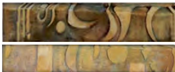
< Рис. 12 и 13. Нижняя часть мемориала спереди. 2,40 см × 30 см в высоту и 50 см в ширину. Стеклофибробетон. Ирбид, Иордания / Fig. 12 & 13. The floor of the memorial from the front, 2.40 cm × 30 cm height × 50 cm width. GRC. Irbid/Jordan