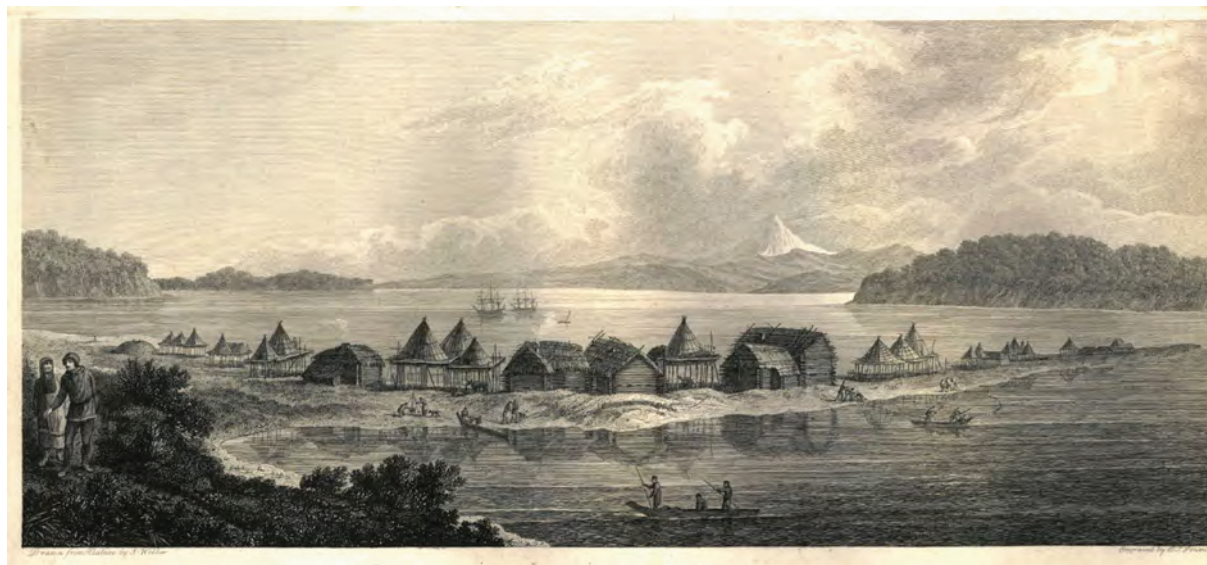
< Рис. 8. Город и бухта Петропавловска на Камчатке. Б. Паунси (B. Pounsey). Гравюра по акварели Д. Веббера. 1784 (National Library of Australia, Rex Nan Kivell Collection, NK1426)

(Tomlinson) «Интерьер жилища в Восточной Татарии». Как показано, нижняя его часть целиком сложена из дерева и укреплена протяженными балками, а верхняя учитывает сплошное утепление стен по деревянному каркасу. При этом оконные проемы полностью отсутствуют, а естественный свет проникает лишь через верхнее отверстие, служащее также дымоходом. Показательно, что и входной проем более всего похож на лаз: он существенно приподнят над полом, что позволяло выбираться наружу даже при больших сугробах.