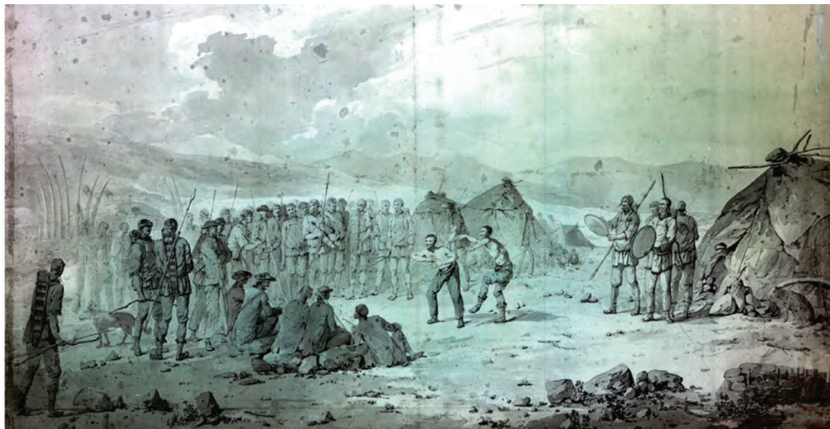
< Рис. 5. Д. Веббер. Танцующие перед капитаном Куком и его офицерами чукчи на фоне собственных жилищ. Акварель. 1778 (National Maritime Museum, Greenwich, London, PAJ2965)

пребывания в Китае в составе британского посольства. Назначенный же самим Биллингсом «официальным» художником экспедиции являлся выпускник петербургской Академии художеств, «рисовальный мастер» Лука Воронин (1765 – ?). В дошедшем до нас альбоме художника на 1, 3, 4, 5, 6, 7 и 13 листах прямо под рисунками находим подлинный его автограф («Лука Воронин»), а на первом листе, прямо под разъясняющим текстом, встречаем и подпись на английском языке: «Martin Sauer». Он-то и выпустил в свет упомянутое иллюстрированное издание. В тексте книги встречаем и некоего Робика (Mr. Robeck), которого составитель книги уважительно называет не иначе, как «наш рисовальщик» («our drawing-master»). На всем протяжении экспедиции наброски карандашом и пером делал и сам Соьер, о чем и упомянул в Предисловии. Впрочем, уже доставленные в английскую столицу всевозможные зарисовки и эскизы нуждались для последующего гравирования в создании качественных рисунков, чем и занялся впоследствии Александр.