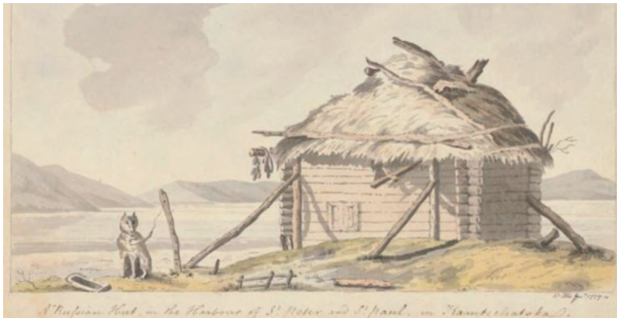
> Рис. 9. Русская изба в гавани Петропавловска. У. Эллис (W. Ellis) Акварель. 1778 (National Library of Australia. Pic-an 2816699)

of Yakout Yourt, Oudskoi, Fox-trap, Ghijigha, Light-house at Ghijigha, View in Markova, Head-quarters at Markova).