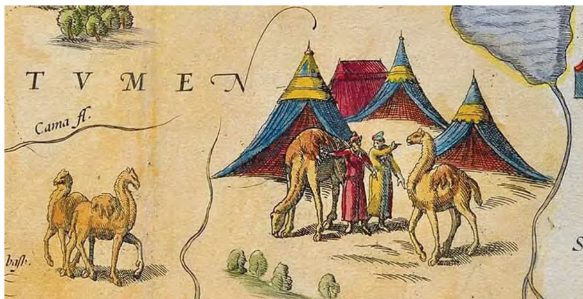
< Рис. 1. А. Дженкинсон. Россия, Московия и Тартария. Фрагмент карты. 1562

дымок, однозначно свидетельствующий о наличии оборудованного очага и для обогрева, и для приготовления пищи.