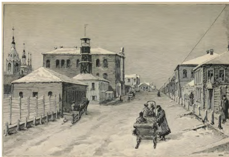
^ Рис. 16. Главная улица Енисейска. Гравюра неизвестного лондонского мастера по рисунку Ю. Прайса. 1882 [14]

into English by James Grieve. – L.: Printed by R. Raikes for T. Jeffry's geographer to his Majesty, 1764. – 312 p.