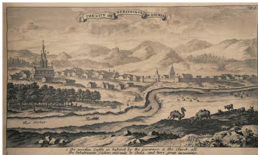
в Рис. 4. Город Нерчинск в Даурии. Гравюра неизвестного лондонского мастера. 1706 [1]

Тот же Повелл на основе очередного исполненного Александром чистового рисунка создаст гравюру «Вид города Зашиверска» (Powell. Sculp. View of the Town of Zashiversk. Published March 2ed. 1802. By Cadell & Davies Strand). Располагавшийся за полярным кругом в среднем течении р. Индигирки, «за шиверами» (порогами), этот