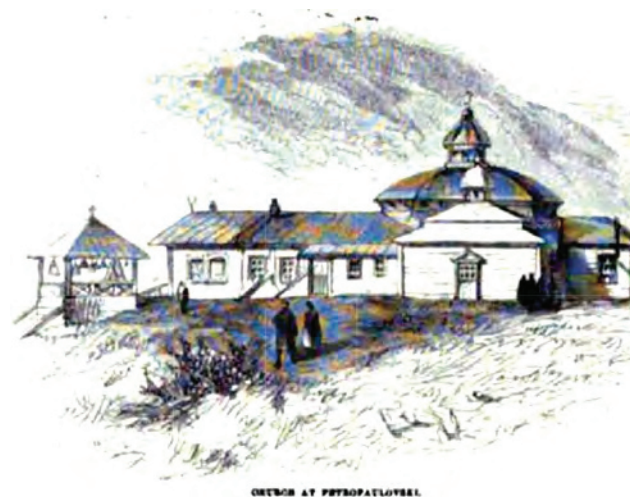
^ Рис. 13. Церковь в Петропавловске. Гравюра неизвестного лондонского мастера по рисунку Р. Буша. 1871 [10]