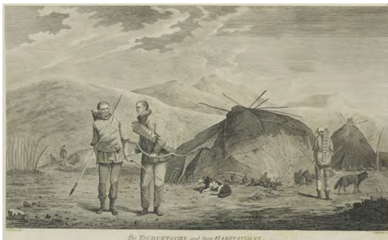
^ Рис. 6. Чукчи и их дома. Гравюра Д. Лерпиньера (D. Lepinier) по акварели Д. Веббера. 1784 (State Library of New South Wales, Australia)