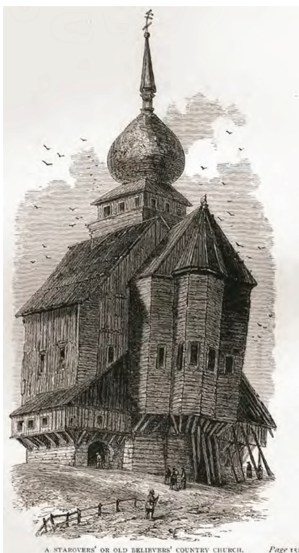
> Рис. 14. Сельская церковь староверов или старообрядцев. Гравюра неизвестного лондонского мастера по рисунку Г. Лэнсделла. 1882 [13]

Изначально основным импульсом к появлению упомянутых в статье графических работ послужил характерный для эпохи Просвещения колоссальный интерес английской читательской аудитории ко впечатляющему многообразию мира, а в дальнейшем этот интерес неизменно стимулировался и английским книжным рынком. Публиковавшиеся в технике гравюры иллюстрации наглядно демонстрируют характерные особенности изобразительной манеры самих авторов. Среди особо примечательных предметов огромного и все еще малоизвестного мира им удалось отобразить в заявленных хронологических рамках архитектурное и градостроительное своеобразие азиатской России. Документальная и художественная ценность этих графических произведений весьма значительна, ибо все они фиксируют полностью утраченную к настоящему времени самобытность архитектурно-пространственной среды целого ряда городов и селений азиатской России, а также отдельных ее строений и сооружений самой различной функциональной принадлежности.