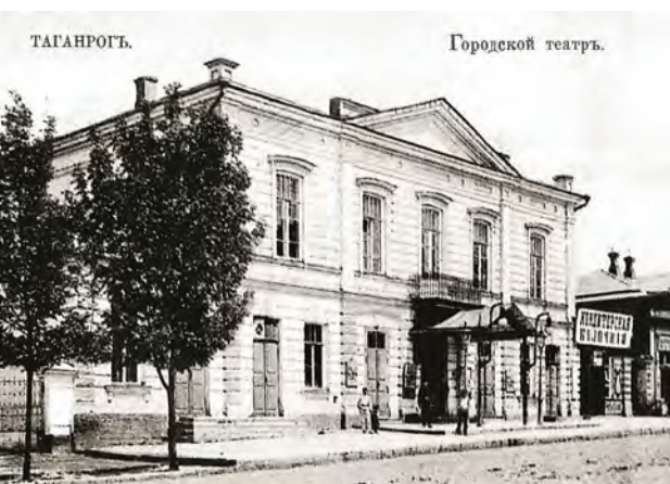
^ Рис. 2. Театр в Таганроге. Архитекторы К. Лондерон, Р. Н. Трунов. 1866 ( rostov.kp.ru/chehovskiy.ru/o-theatre/istoria-theatre )