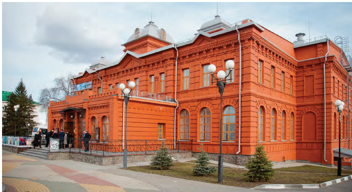
< Рис. 4. Старый Оскол. Театр детей и молодежи им. Б. И. Равенских. Архитектор Эйнци. 1888

Старый Оскол (рис. 4). Театр занял здание духовного училища, построенного в 1888 году на пожертвования горожан. Архитектор Эйнци. В 1918 году здание стало Дворцом труда, затем домом культуры, с 1965 года – театр детей и молодежи им. Б. И. Равенских [7].