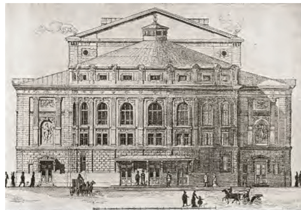
Фасад театра в Рыбинске. 1874.

В 2004 году был проведен конкурс на воссоздание театра. Победителем стал проект ООО «ТТА» с правом на реализацию, но на проектирование и строительство не нашлось средств. До наших дней труппа драматического театра Рыбинска работает в абсолютно не приспособ-