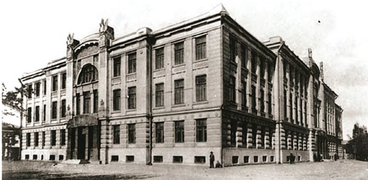
> Рис. 7. Театр в Новочеркасске. Архитектор А. Н. Бекетов. 1909

В начале XX века в малых городах театральные труппы размещались в народных домах, затем в клубах и домах культуры. (Зеленодольск, Ковров, Ростов Великий, Переславль-Залесский, Озерск, Ноябрьск). Приведенные примеры показывают интерес к самому театральному искусству и в лучших случаях – стремление сохранить