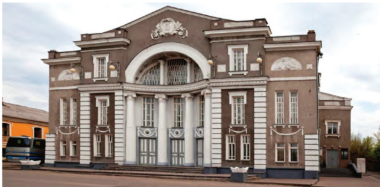
< Рис. 8. Драматический театр в Мичуринске. 1912

памятники архитектуры. В худших случаях труппы сохраняются, но после разрушения исторических зданий перемещаются во дворцы культуры или абсолютно непригодные здания. Один из таких примеров – недавно выявленный объект культурного наследия Городской театр Ростова-Великого.