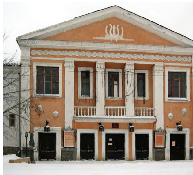
^ Рис. 6. Шадринск. Театр им. В. Ф. Комиссаржевской. 1909

Бийск (рис. 5). В Бийске первый театральный коллектив был основан в 1887 году и работал в здании общественного собрания. С 1914 года Драматический театр размещается в здании, построенном как Народный дом архитектором И. Ф. Носовичем на средства купца 2-й гильдии П. А. Копылова [8]. В 1984–1985 была проведена реставрация здания: подняты ряды амфитеатра для улучшения видимости, добавлены осветительские ложи. Внешний вид здания не претерпел существенных изменений.