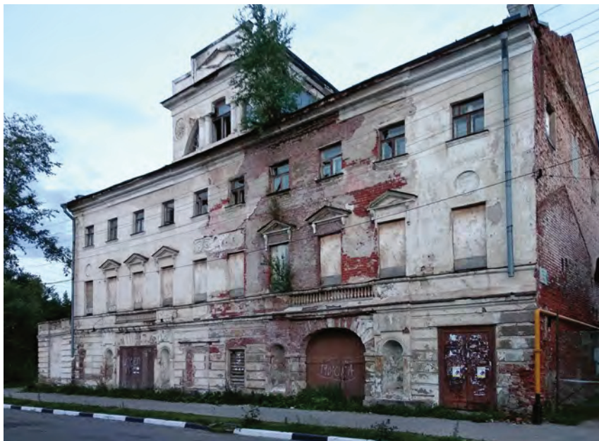
< Рис. 9. Ростов Великий. Городской театр

и, если не использовать накопленный опыт, остается рассчитывать только на государственное финансирование.