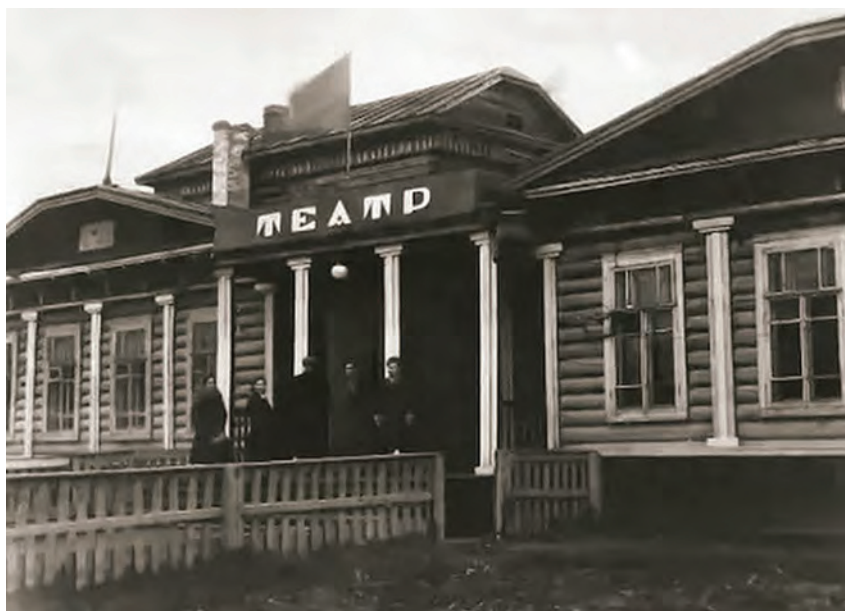
> Рис. 10. Котлас. Старое здание театра

3. Сидорченко, В. П. Иркутская антреприза : страницы истории городского театра 1790–1920 годов. Изд. 2-е. – Иркутск : Оттиск, 2021. – 392 с. : ил.