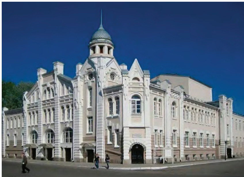
^ Рис. 5. Театр в Бийске. Архитектор И. Ф. Носович. 1914