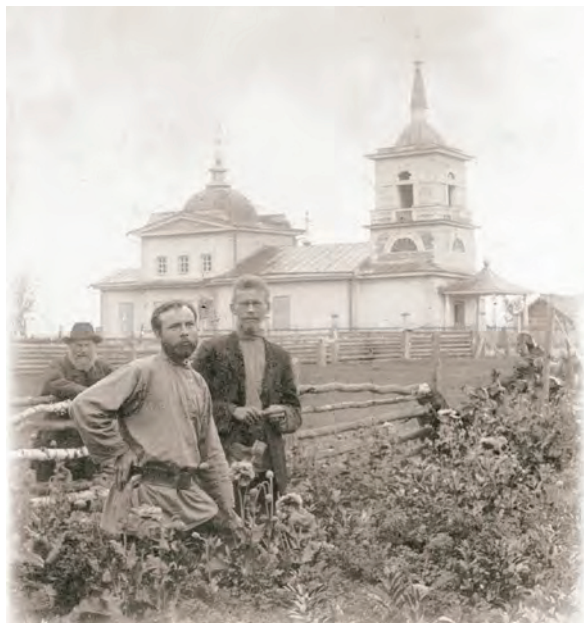
> Рис. 4. Церкви во имя святого Пророка Илии в с. Новоильинка Колпашевского района: а) 1841 года постройки. Фото 1908; б) 1902 года постройки. Фото 1931.