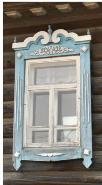
< Рис. 3. Жилой дом на ул. Сибирской, 19 в с. Тогур. 2019

Самые ранние сведения о селе зафиксированы в научных публикациях сосланного в 1867 году в с. Ново-Ильинское исследователя-этнографа Нарымского края Николая Петровича Григоровского, который отметил: «Село растянулось в длину на несколько верст с верстовыми и более промежутками на высоком материнском берегу. Эти промежутки разделяют село на несколько деревень – где пять домов, где восемь, а где и более, – каждая из этих деревень носит особое название. Собственно, само село, т. е. где находится церковь, имеет домов восемнадцать и расположено на загибе материчного берега к старице...» [6, с. 232].