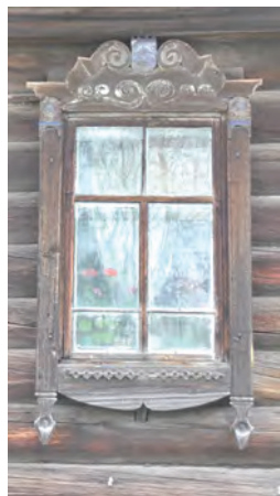
^ Рис. 2. Жилой дом на ул. Сибирской, 105 в с. Тогур. 2019