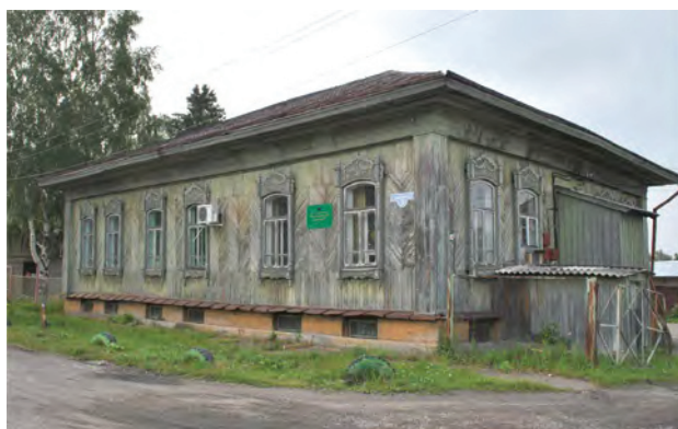
в Рис. 11. Бывший дом Волковых по ул. Советской, 9. 2019

Yakovlev, Ya. A. (Ed.). (2000). Zemlya Kolpashevskaya: Sbornik nauchno-populyarnykh ocherkov [Kolpashevskaya land: Collection of popular science essays]. Tomsk: Izd-vo Tomskogo universiteta.