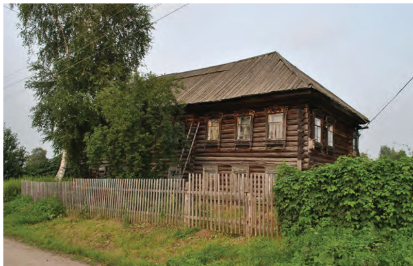
в Рис. 5. Двухэтажные дома в с. Новоильинка. 2019

Петропавловская церковь была одноэтажная, но довольно высокая, обшита тесом «под кирпич». Храмовая часть представляла собой четверик, перекрытый четырехскатной крышей, завершающейся пятиглавием. К зданию была пристроена небольшая трапезная (в одно окно) и двухъярусная колокольня, представляющая собой квадратный в плане четверик, переходящий в высокий восьмигранный объем, завершающийся высоким шатром с фронтонами килевидной формы по четырем сторонам, увенчанным главкой с крестом. К колокольне примыкала паперть с двухскатным навесом на столбах. Аналогичные навесы располагались и по боковым сторонам храмовой