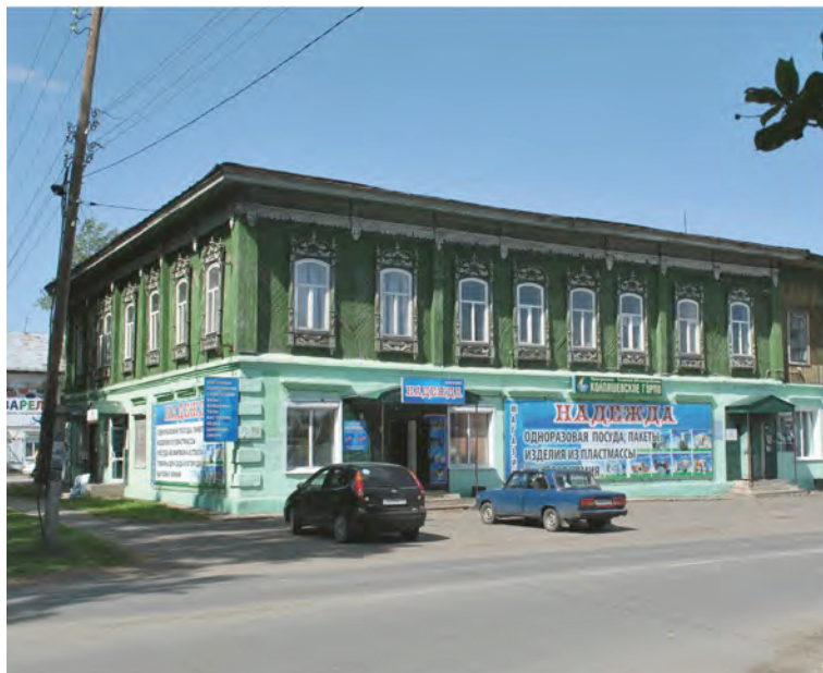
> Рис. 9. Современный вид бывшего дома Колесниковых. Фото Е. Ситниковой. 2019