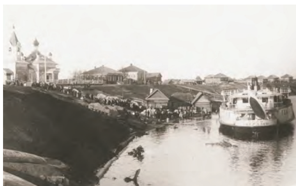
> Рис. 10. Бывшие дома братьев Волковых. Фото во время первомайской демонстрации 1930.