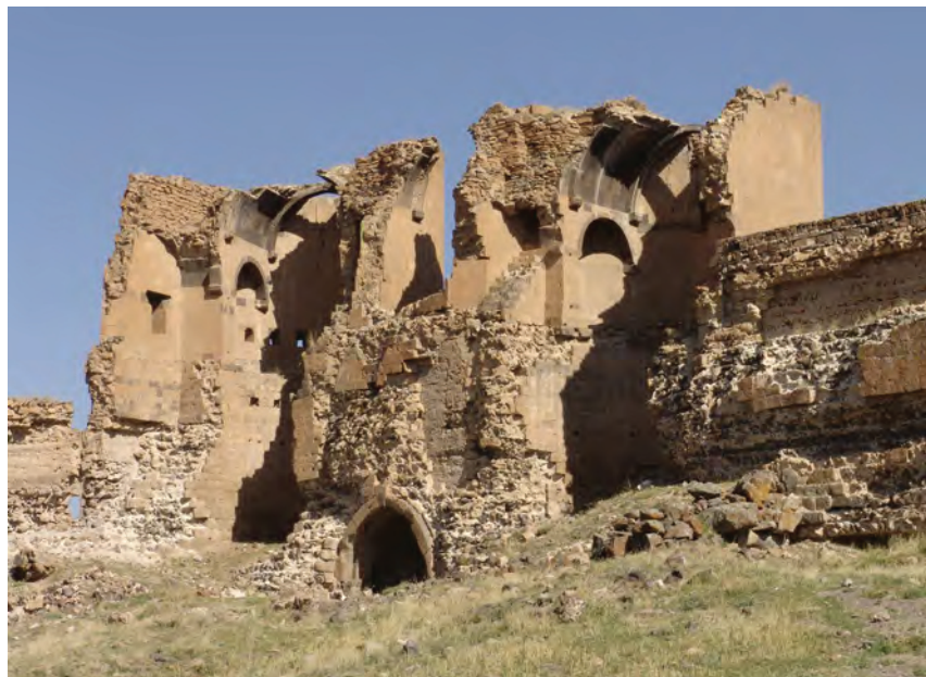
^ Рис. 7. Карсские ворота со стороны города. Фото А. Казаряна. 2005