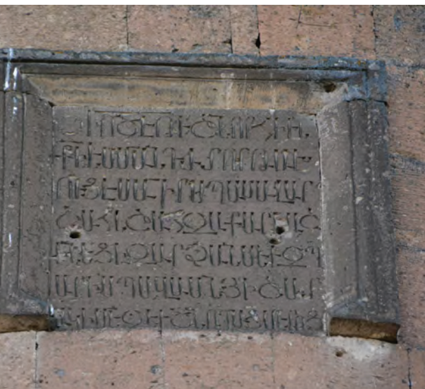
^ Рис. 5. Надпись правителя Ани Закаре. 2018