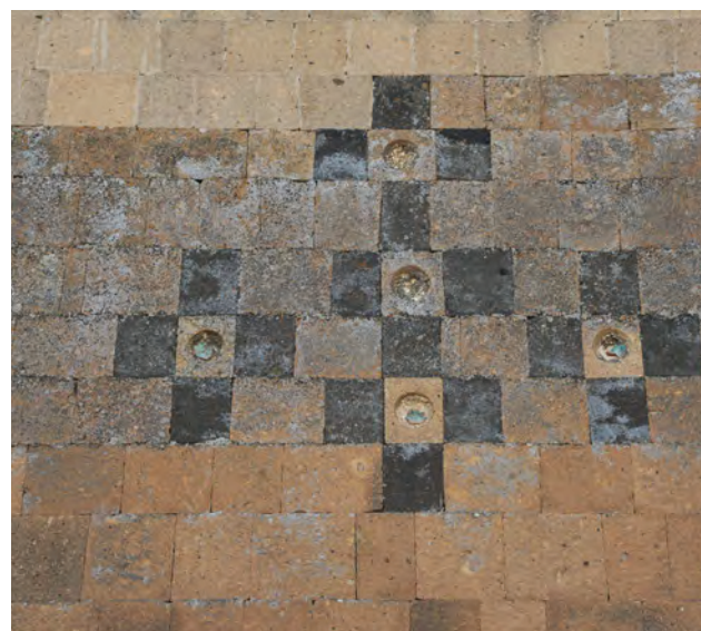
^ Рис. 12. Крест или композиция из пяти крестов со вставленными блоками на восточной половине стен. Фото А. Казаряна. 2015