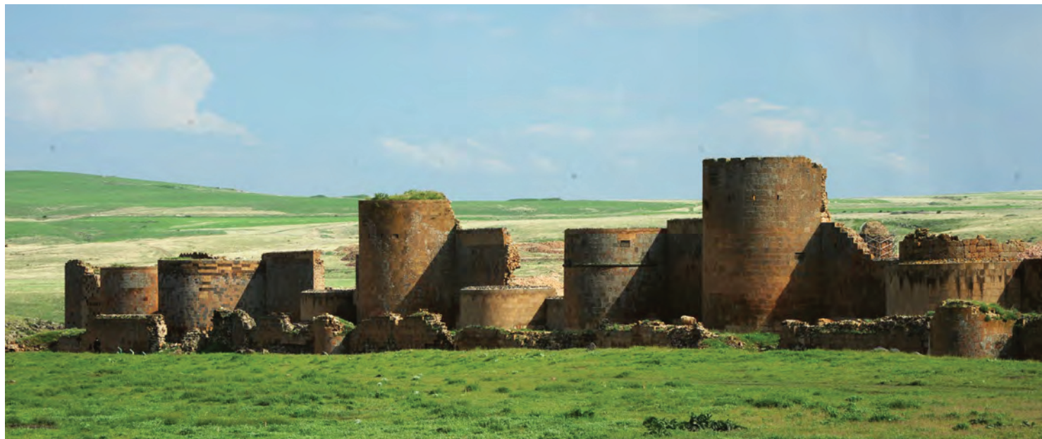
^ Рис. 1. Вид на город Ани со стороны плато. Восточная часть Смбатовых стен. 2019

Н. Я. Марр насчитывал в городских стенах Ани (не считая стен на периферии и Ашотовых) 80 башен, 11 ворот и 3 калитки, причем 55 башен располагались в двух рядах параллельных Смбатовых стен [4, с. 79]. Трое ворот были основными и самыми монументальными. Это Главные, или Львиные (по барельефу льва), Карсские и Шахматные, в XIX в. ошибочно называвшиеся Двинскими. Цифры, приведенные Н. Я. Марром, требуют уточнений, для чего необходимо оперировать не только топонимикой и фотографиями, но и исследованием на местности, чего были лишены ученые с 1920 года по конец XX в. Да и по сей день городище, расположенное в турецкой, пограничной с Арменией зоне, продолжает находиться на границе страны НАТО с Арменией, где расположена российская военная база. Все это ограничивает возможности изучения памятников архитектуры и археологии.