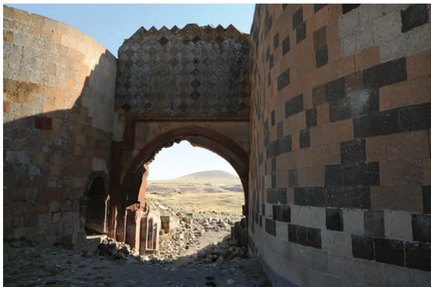
^ Рис. 6. Шахматные ворота. 2015

Укрепление городских стен было делом не только правителей, но и всех горожан, вносивших в него свой посильный вклад. Содержание надписей свидетельствует о том, что укрепление стен и строительство новых башен в Ани считалось богоугодным делом.