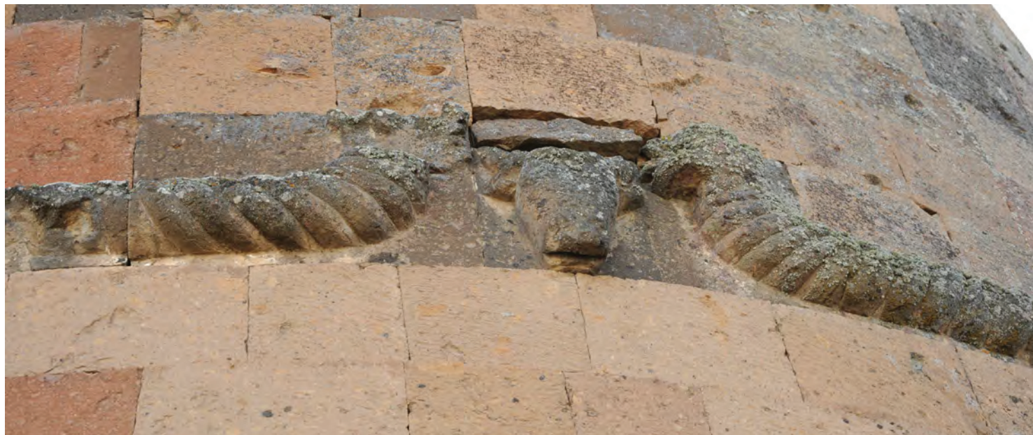
^ Рис. 4. Рельефное изображение головы быка между змеями/драконами. Фото А. Казаряна. 2015

История поновлений и перестроек Смбатовых стен воссоздается по эпиграфическим источникам. Наряду со всего лишь одной надписью на арабском языке [11, с. 54], относимой к периоду правления в Ани Мануче (1071–1110) из рода курдских эмиров Шаддадидов, матерью которого была дочь анийского царя Ашота IV Багратуни (ум. 1041). Остальные надписи о строительстве стен высечены на армянском, включая древнейшую, середины XI в., которая находится не на оборонительных стенах, а на стене кафедрального собора. Из 17 армянских строительных надписей 14 содержат даты: одна 1160 год, то есть принадлежит еще эпохе Шеддадидов, остальные охватывают период с 1206 по 1231 годы [12, с. 1–8], то есть относятся к начальному периоду управления страной Закаридами. Три надписи без дат относятся к тому же времени в связи с упоминанием в них известных личностей. Не исключено нахождение надписей эпохи Багратидов на редких фрагментах конструкций того времени, которые оказались в дальнейшем обстроены, как была обстроена и башня с упомянутой куфической надписью следующим, наверняка XIII в., слоем кладки: сейчас участок с этой надписью демонстрируется в шурфе данной кладки.