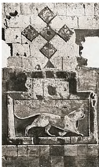
> Рис. 10. Композиция со львом и крестом в комплексе Главных ворот: а) на фотографии начала XX века; б) состояние после реставрации стены. 2018