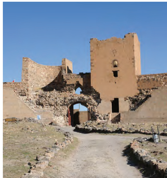
^ Рис. 9. Главные ворота со стороны города. Фото А. Казаряна. 2010

врезается в полуцилиндр полукружия стены [7, с. 70–71]. Близкий пример пересечения округлых форм известен в интерьере второго яруса сохранявшейся еще в начале XX в. Пастушьей церкви вне стен Ани (первая половина XI в.), где крестово-купольная структура перекрытий с арками на кронштейнах завершала цилиндрическое пространство.