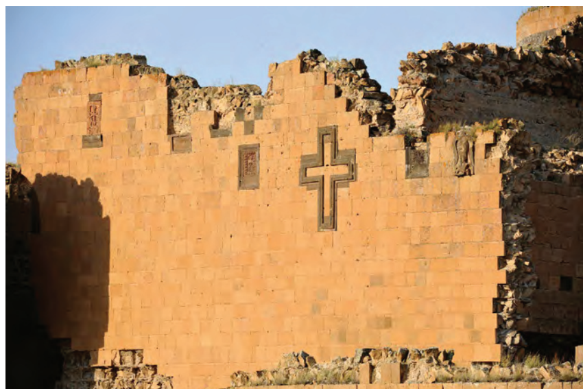
^ Рис. 11. Западная оконечность Смбатовых стен. 2025