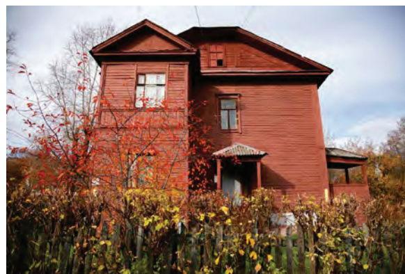
< Рис. 3. Квартал «Красный просвещенец», Нижний Новгород

В конце 1930-х годов права собственности были законодательно отменены, участники кооператива получили компенсацию. И несмотря на то, что окраинные районы активно застраивались, состав семей в целом оставался прежним. Во время Великой Отечественной войны квартиры становились коммунальными, количество проживающих увеличивалось, впоследствии временные