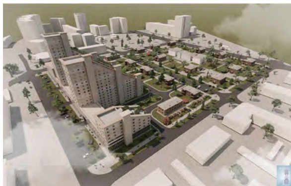
> Рис. 4. Проект сохранения квартала «Красный просвещенец» ( https://pravda-nn.ru/articles/zhiltsy-krasnogo-prosveshchentsa-razrabotali-proekt-zastroyki-kvartala-chtoby-spasti-svoi-doma/ )