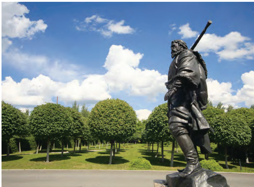
^ Рис. 3. Памятник Ермаку Тимофеевичу

Основные достопримечательности парка размещены как вблизи границы обрыва, так и в глубине парка. С обрывистого берега открывается неповторимый величественный вид на необъятные сибирские просторы. Его созерцание – одно из главных, запоминающихся событий во время посещения парка.