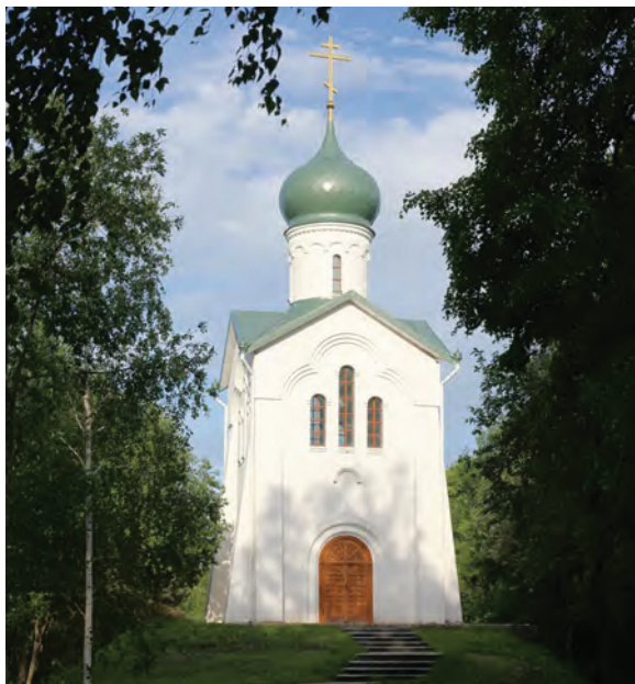
< Рис. 14. Часовня Димитрия Солунского

На примере создания парка «Ермаково поле» можно немного порассуждать, насколько велика роль Заказчика в архитектурном творческом процессе. Работая над парком на протяжении 17 лет, могу с уверенностью констатировать, что работа шла в творческом плане достаточно легко. Если доверие Заказчика к Автору является полным и безоговорочным – это мощнейший стимул для вдохно-