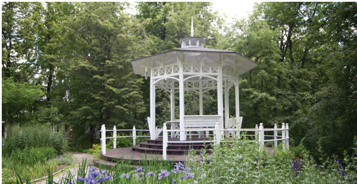
> Рис. 11. Беседка «Алябьевская»

метру памятника выполнена округлая скамья, где можно присесть, подумать. На плитах у подножия написаны все научные звания Д. И. Менделеева и изображена его периодическая таблица так, как она выглядела на момент первой публикации.