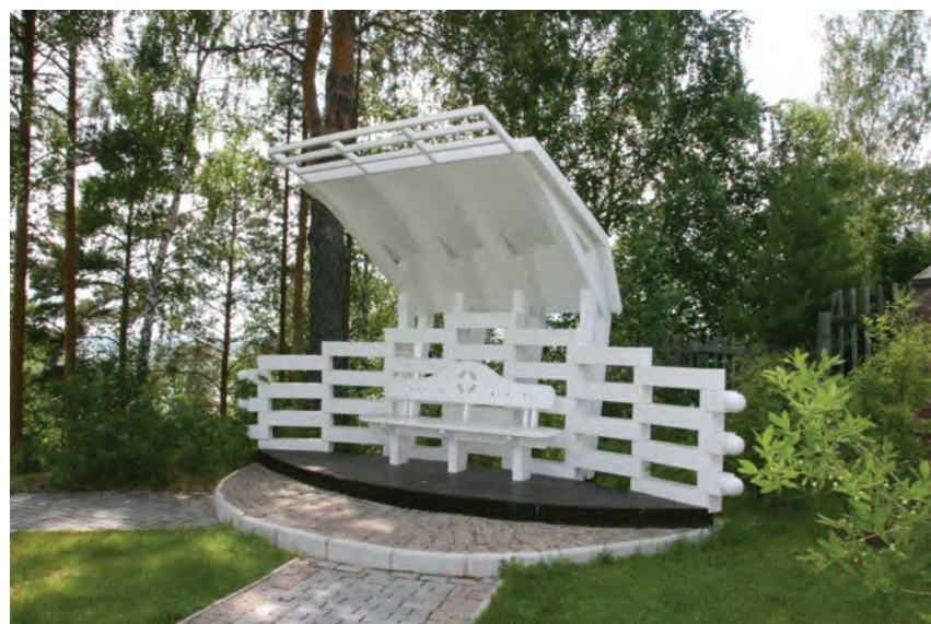
> v Рис. 12–13. Скамья с навесом «Перспектива»

Кроме того, на территории парка за последние 10 лет построены гостевой дом и дом садовника с оранжереей. Но самым крупным объектом, который предполагается возвести в будущем, должен стать музей лауреатов премии имени Федора Конюхова, учрежденную фондом