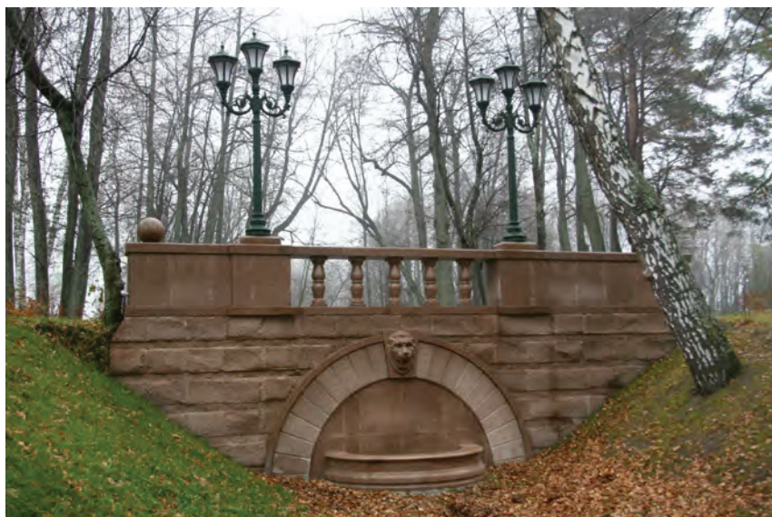
> Рис. 16. Подпорная стенка «Петербург»

– было стремление добиться эффекта легкости, поэтичности, считываемости образов для не очень сильно искусленного в ассоциативных связях зрителя. Поэтому в характере архитектуры парковых объектов присутствует литературность, историчность, фигуративность, соответствующие духу данного Места ( genius loci ). Настоящая Достопримечательность всегда уместна;