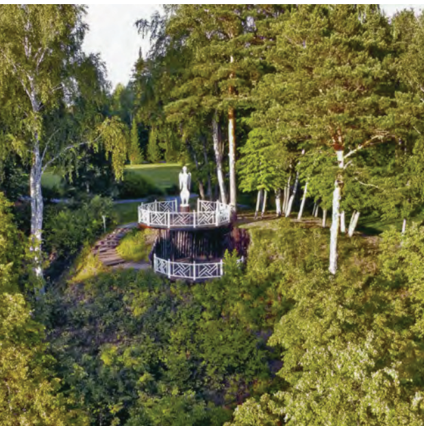
^ Рис. 7. Видовая площадка «Ангел Сибири».