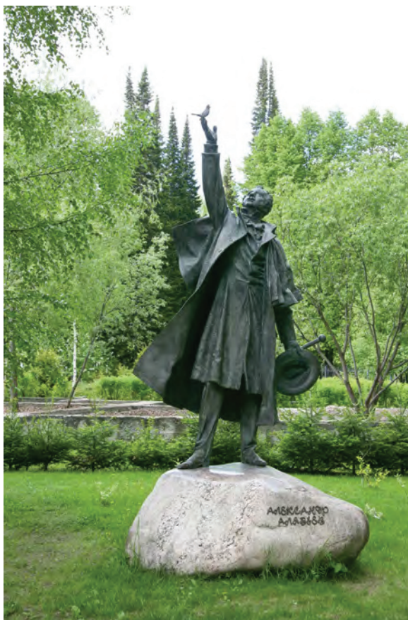
< Рис. 4. Памятник А. А. Алябьеву