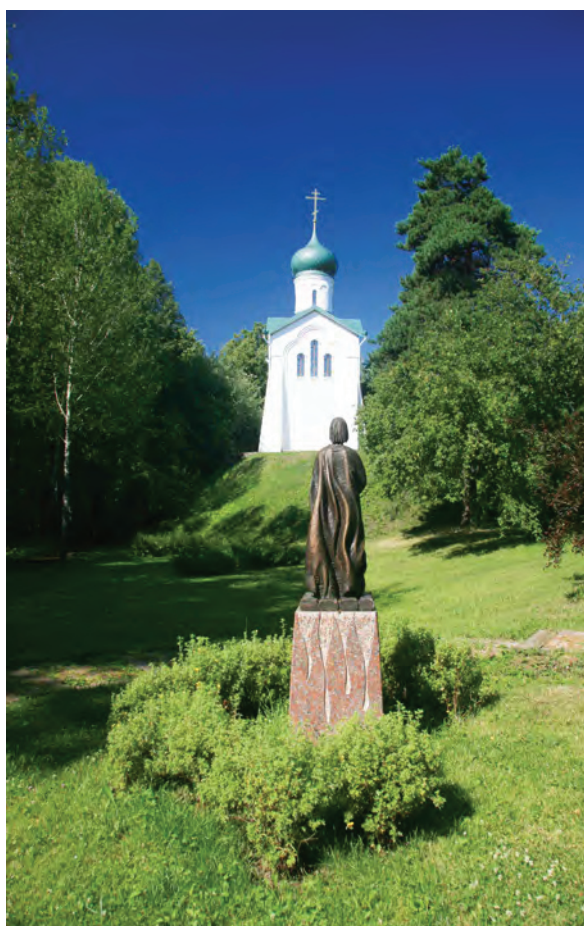
> Рис. 6. Памятник протопопу Аввакуму

с одноименным названием. Площадка двухуровневая, спускающаяся каскадом по обрывистому склону. Двухуровневость площадки имеет символический смысл, связанный с градостроительным расположением Тобольска. Город крутым перепадом рельефа делится на 2 части: нагорную – там, где расположен кремль, и подгорную, где исторически в основном жили горожане и где сохранилась большая часть старинной застройки. Стилистически