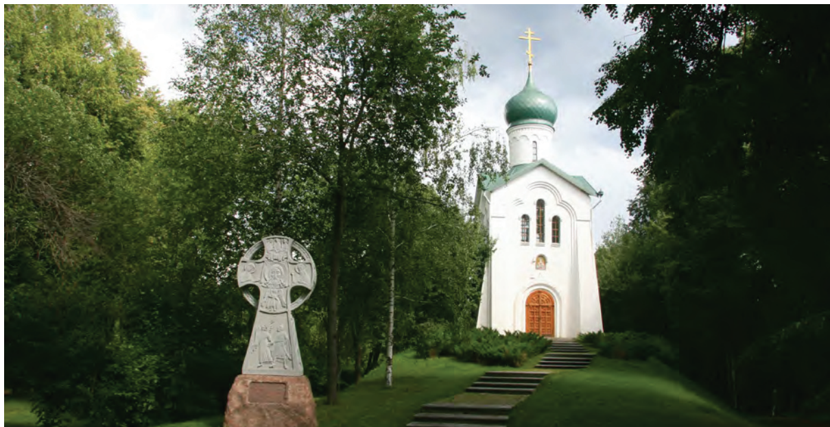
> Рис. 5. Памятный Крест Ермака

с одноименным названием. Площадка двухуровневая, спускающаяся каскадом по обрывистому склону. Двухуровневость площадки имеет символический смысл, связанный с градостроительным расположением Тобольска. Город крутым перепадом рельефа делится на 2 части: нагорную – там, где расположен кремль, и подгорную, где исторически в основном жили горожане и где сохранилась большая часть старинной застройки. Стилистически