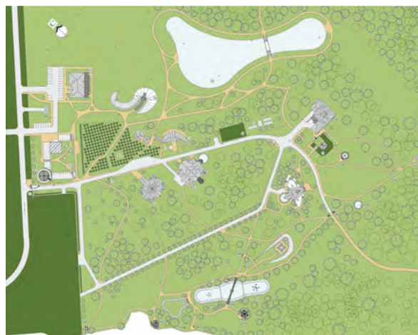
< Рис. 1. Схема генерального плана парка «Ермаково Поле»