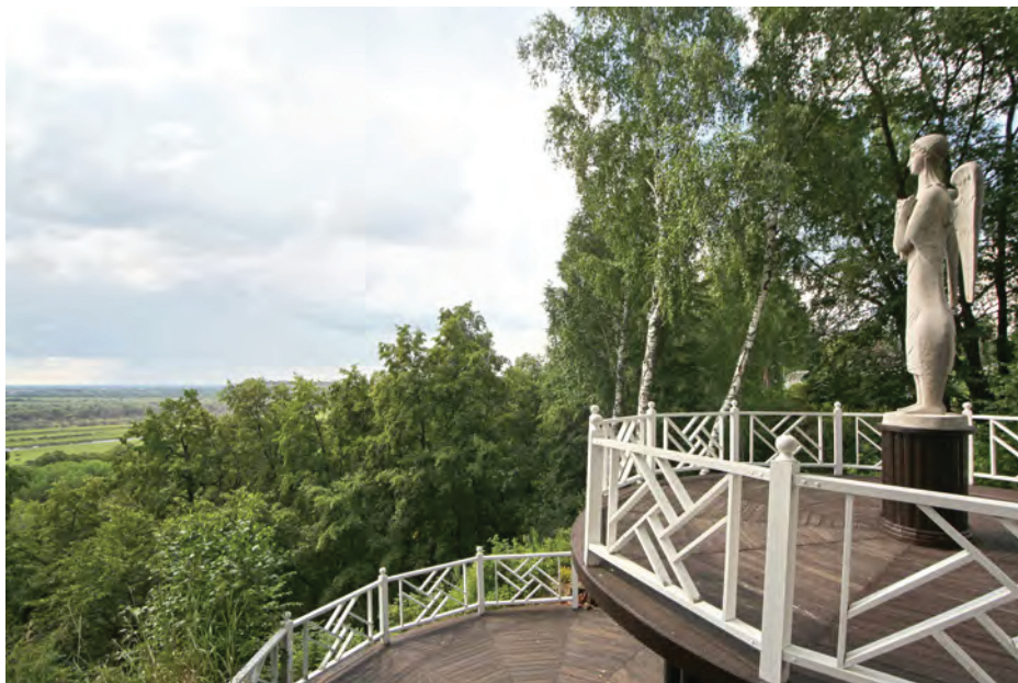
^ Рис. 8. Видовая площадка «Ангел Сибири».

необходимое в этом случае настроение торжества и величия силы Духа. Покрытие кирпичных стен Часовни трехчастной белой известковой обмазкой хорошо проявляет на солнце фактуру кирпичной кладки и добавляет образу Часовни настроение древней старины.