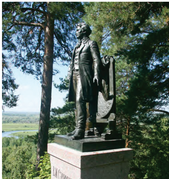
^ Рис. 2. Памятник В. И. Сурикову