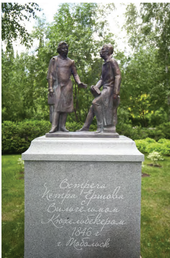
< Рис. 9. Памятник протополу Аввакуму