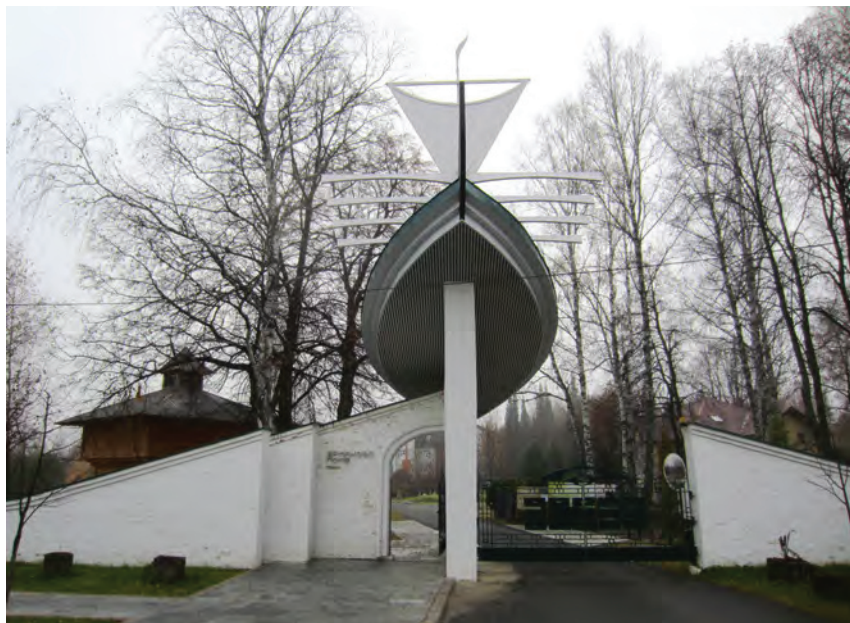
^ Рис. 15. Главный вход в парк