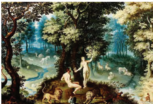
> Рис. 1. Ян Брейгель. Райский пейзаж (wga.hu)

В предпринимаемых проектах благоустройства часто доминируют решения с ярко выраженным присутствием дизайн-интервенций, преобразующих сложный природный космос места в поверхностный нарратив на основе заданного функционального алгоритма и имитации природного компонента. Имитационный образ декоративно оформленного «природного компонента» является распространенной практикой современного ландшафтного дизайна, наиболее адаптированной горожанами и туристами. В ситуации, когда предлагаемый сюжет сада (парка) распознается незамедлительно, начиная от точки входа, смысл дальнейшего перемещения по аллеям приобретает ритуальный, а не метафизический контекст. Так возникает второй типологический тренд, ориентированный на ритуал (перформанс) – в качественном диапазоне от упрощенной версии до роскошной.