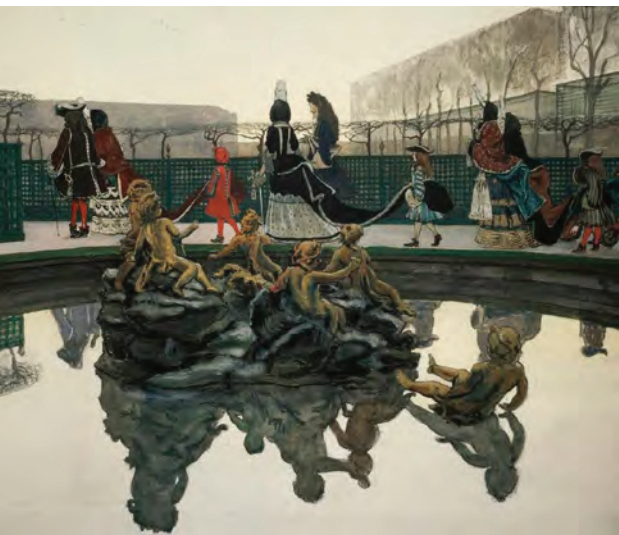
^ Рис. 4. Александр Бенуа. Прогулка короля. 1906