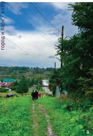
^ Рис. 6. Город Тутаев: а – спуск к Волге по тропе мимо Благовещенской церкви; б – заросли лопуха по обочинам.