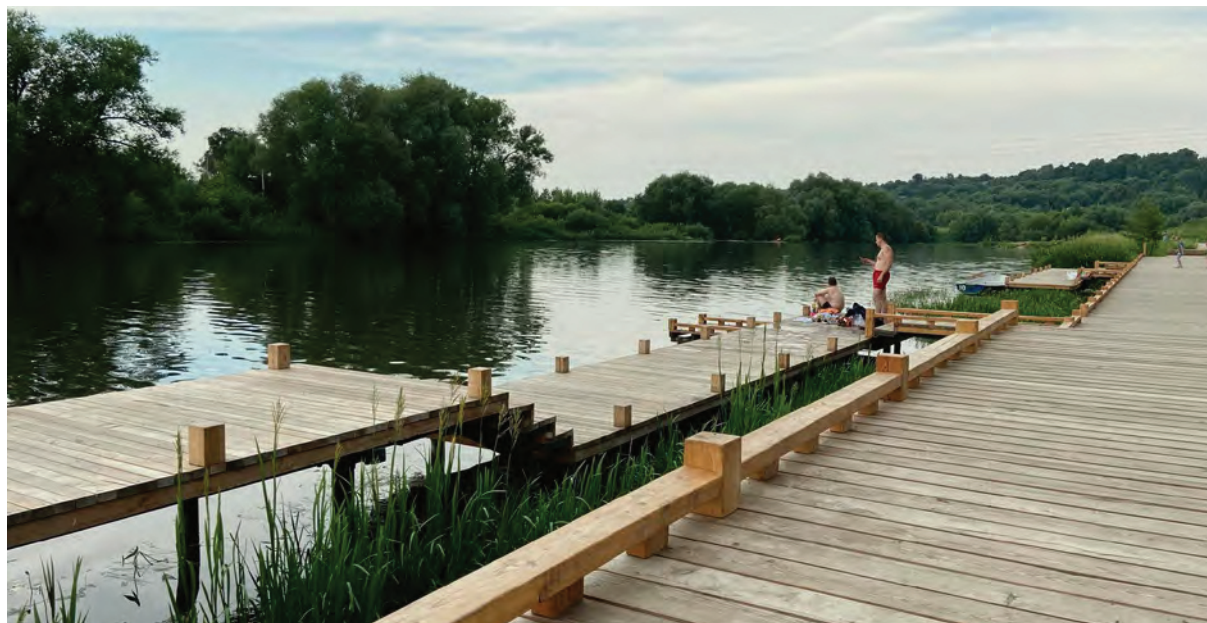
< Рис. 8. Набережная в Зарайске. Компания Mirror Group. 2021

вождения, выбирая не спроектированные для этой цели сады и парки, а промежуточные территории и объекты, не определяемые в терминах рассматриваемых типологий. Например, дети чувствуют более интересные возможности, карабкаясь на кучи песка и щебня, сложенные на стройплощадках. Взрослым больше нравится выезжать на берег реки, оставшийся без проектного освоения. Путешествия по городским переулкам и пустырям, посиделки на лавках в уютных дворах старых кварталов – элементы городского перформанса, воспринимаемые как интуитивно выстроенная программа, сближающаяся по потенциалу с обеими альтернативными системами типологиями сада: тактильной (спонтанной) и перформативной (ритуальной) (рис. 9). Спонтанность и самоорганизация становятся важным фактором сада как альтернативы системе и образу жизни в мегаполисах. Сад приобретает новые границы как типология персонального бесцельного странствия горожанина в пределах очерченной им ойкумены.