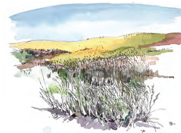
^ Рис. 5. Пшеничное поле в деревне Сергиевка Самарской области. Рисунок автора

> Рис. 7. Примеры спонтанной интеграции благоустройства «по месту»: