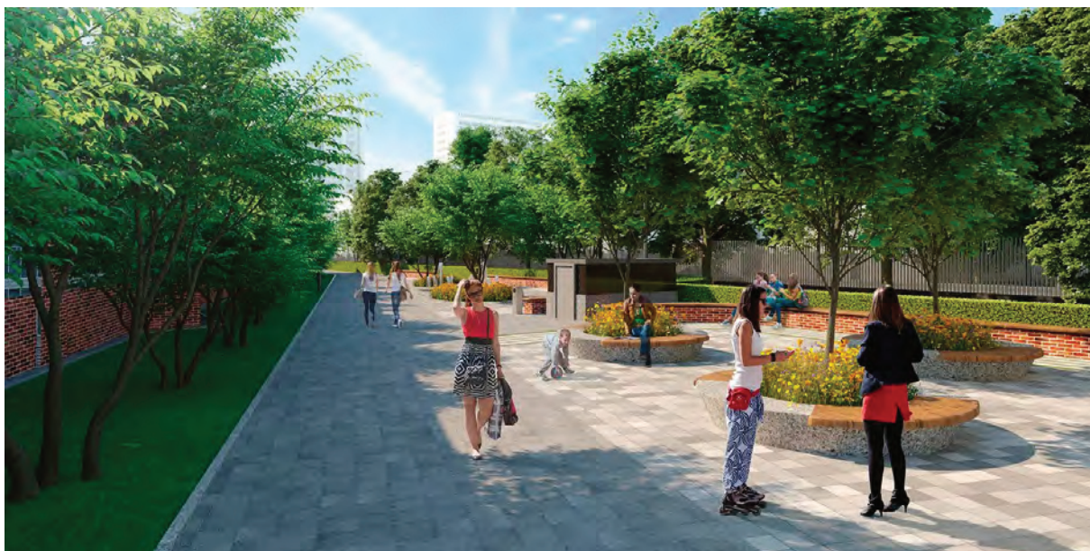
> Рис. 2. Концепция сада как коллективного прогулочного маршрута

располагало к радости, но самую высокую радость первозданные люди испытывали оттого, что имели общение с Богом – неисчерпаемым Источником благ» [2]. Анализ существующих повествований, связанных с райским садом, создает картину уже свершившейся интеграции двух сюжетов: условно природного (типологии тактильного) и перформативного (типологии ритуального). Согласно различным источникам, Эдем, хотя и является райским садом, но по сути есть религиозный и исторический прецедент, материальная субстанция которого, по разным источникам, ассоциируется с конкретным «земным расположением» на территории Междуречья (рис. 1). Разнообразие исторических версий сада, начиная с сада царицы Хатшепсут и одного из семи чудес света – висячих садов Семирамиды, рассматривается в научной публикации М. Соколовой [3].