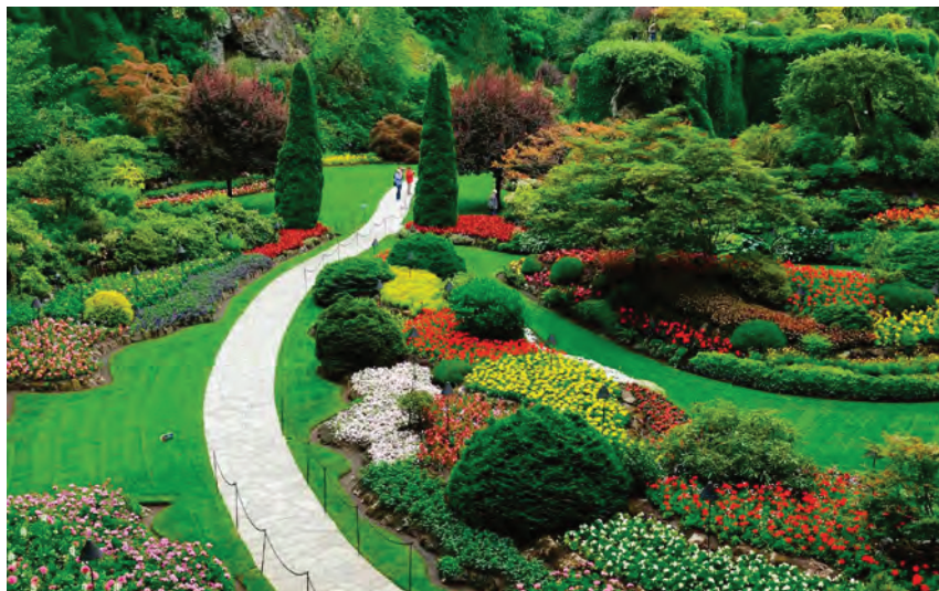
^ Рис. 3. Хелен-парк. Ванкувер. Автор проекта Роберт Брукема ( getyourguide.ru ). Дорогостоящая реплика на тему райского сада

Подобный процесс приводит в итоге к исчезновению места как райского сада в его не выдуманном, а естественно сложившемся виде. При этом дорогостоящие имитационные проекты, несмотря на существенные затраты, сохраняют видимость «прекрасного» природного окружения, ассоциируемого с Эдемом (рис. 3). Укреплению второй названной типологии способствуют современные образовательные программы, не настаивающие на необходимости ценить естественную среду.