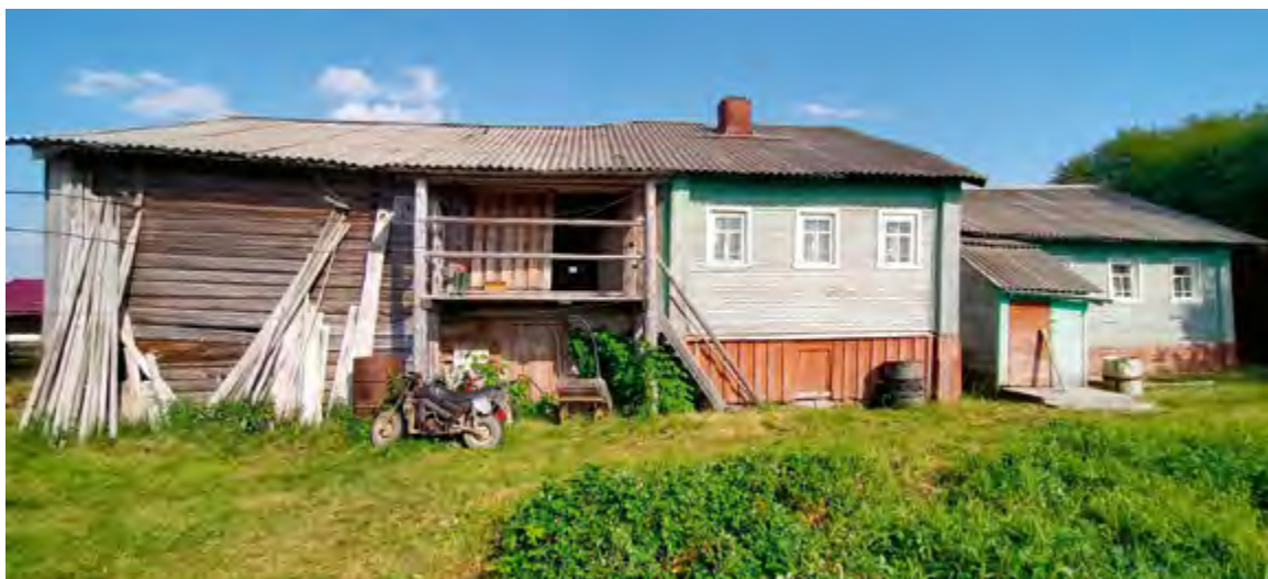
^ Рис. 9. Дом-двор В. Е. Копытовой (кон. XIX – нач. XX в.). С. Пурнема (д. Низ), Онежский р-н. 2021