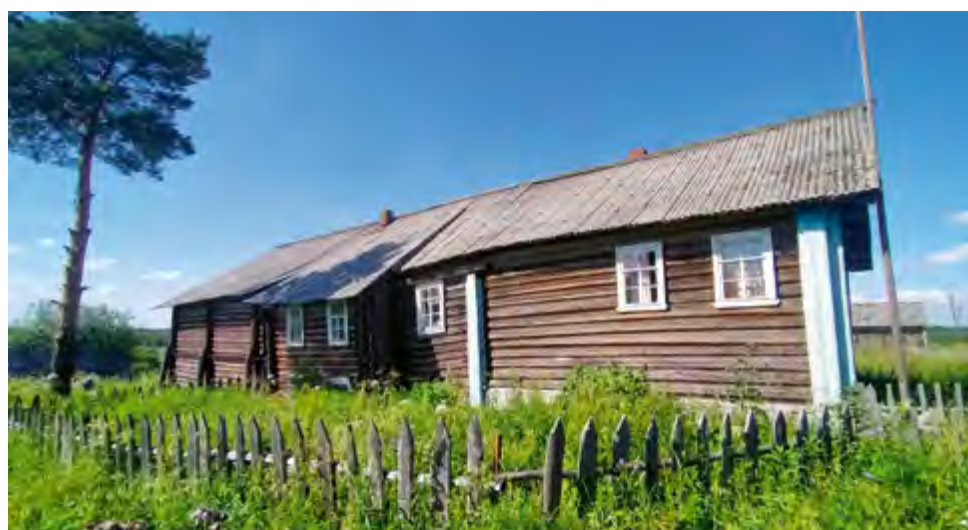
^ Рис. 7. Дом-двор Токаревых-Томиловых (нач. XX в.). С. Турчасово (д. Заполье), Онежский р-н. 2024

торговцев или для жилищ, хозяева которых столкнулись с неординарными условиями, например, началом войны, после которой хозяйственная часть уже не понадобилась.