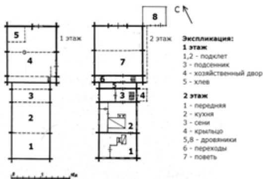
ПЛАН ДОМА-ДВОРА Берты Павловны Ауровой с. Малошуйка (д. Низ), Онежский район 1917 год

Руководитель научного проекта д. культ. А.Б. Пермиловская Научная информация и обмеры А.А. Усова Камеральная обработка арх. Н.А. Подобиной, 2019