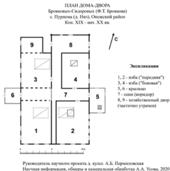
^ Рис. 15. План дома-двора Ф. Т. Бровкова (Бровковых-Сидоровых) (кон. XIX – нач. XX в.). С. Пурнема (д. Низ), Онежский р-н. Рук. научного проекта А. Б. Пермиловская, научная информация, обмеры и камеральная обработка А. А. Усова. 2020