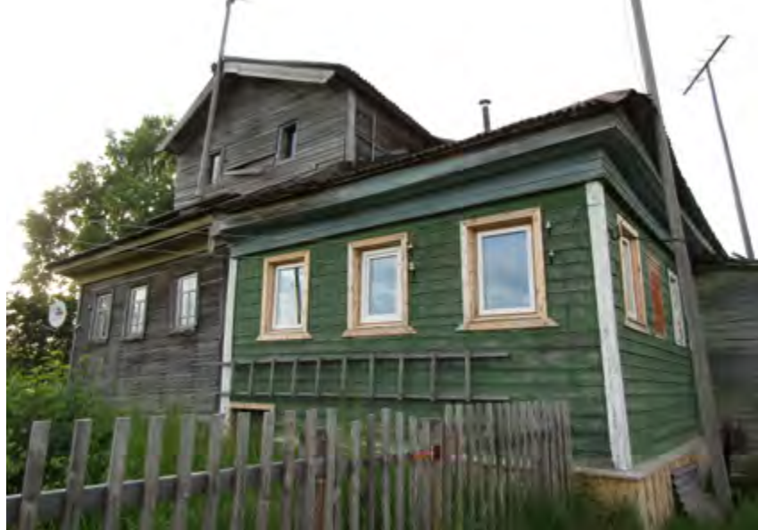
^ Рис. 14. Комплекс дома-двора Ф. Т. Бровкова (нач. XX в.). С. Пурнема (д. Низ), Онежский р-н. 2020

дом может быть приравнен к сохранившему отдельные элементы интерьера, но все-таки нежилому пространству. К сожалению, такие дома-комплексы получают все большее распространение и становятся символом заката традиционного жилища.