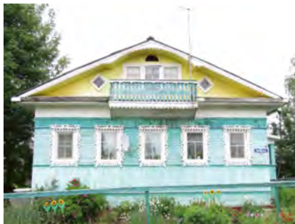
< Рис. 11. Деревянный конек-охлупень на крыше избы Ф. Сафонова (1849). Д. Кимжа, Мезенский р-н. 2024