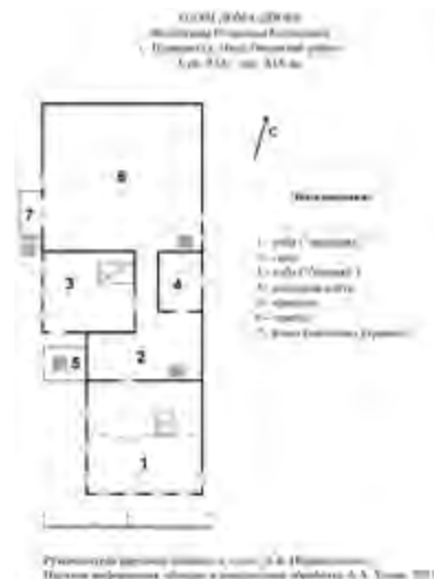
^ Рис. 10. План дома-двора В. Е. Копытовой (сер. XIX – кон. XX в.). С. Пурнема (д. Низ), Онежский р-н. Рук. научного проекта А. Б. Пермиловская, научная информация, обмеры и камеральная обработка А. А. Усова. 2021

нежилое пространство, зажиточный/незажиточный хозяин и другие смысловые пары актуализируются благодаря визуализации, воплотившейся за счет применения новых материалов на традиционном архитектурном субстрате (рис. 14, 15).