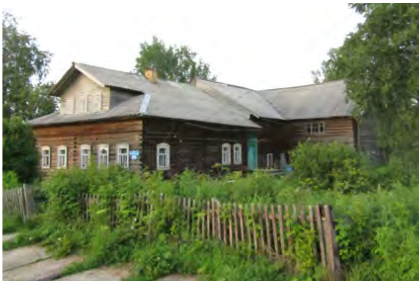
^ Рис. 6. Дом-двор Колапышевых (кон. XIX – нач. XX в.). С. Чухчерема (д. Поташевская), Холмогорский р-н. 2023

Полностью отсутствующий двор характерен или для больших двухэтажных домов зажиточных