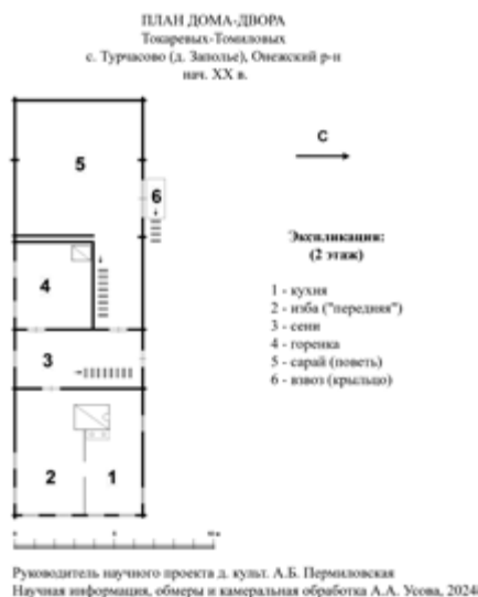
^ Рис. 8. План дома-двора Токаревых-Томиловых (нач. XX в.). С. Турчасово (д. Заполье), Онежский р-н. Рук. научного проекта А. Б. Пермиловская, научная информация, обмеры и камеральная обработка А. А. Усова. 2024