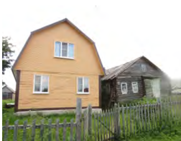
< Рис. 1. Соседство дачного дома (коттеджа) с мансардой и традиционного крестьянского дома-комплекса или с традиционным крестьянским домом-комплексом типа «брус». С. Варзуга (Никольская сторона), Терский р-н. 2022

Для домов различных поселений даже в пределах одного района могут быть характерны специфические отличительные особенности, но их архитектурно-конструктивное и планировочное устройство, как правило,