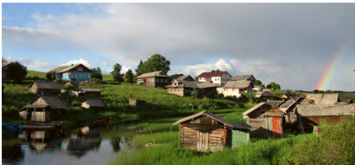
> Рис. 13. Культурный ландшафт д. Нижозеро, Онежский р-н. 2020

лишают избу свойства domesticiрованной территории. На рубеже XX – XXI вв. большие русские печи на Севере стали разбираться, зачастую заменяются исключительно печами-голландками. В новейших вариантах ремонта появились полностью лишенные печей избы, снабженные газовыми и электрическими плитами. Это привело к очередному парадоксу: современные деревни могут сохранять традиционную застройку и планировку, а жилища обладать всеми внешними признаками памятников народной архитектуры. Но при попытке фиксации и проведения обмеров обнаруживается, что даже жилой дом-комплекс – всего лишь пустая оболочка, лишенная связи с традиционной культурой. Отсутствие печи значительно меняет и упрощает быт и жизненный уклад, а исчезновение и трансформация святого угла разрушает преемственность православных традиций. Когда жилище теряет связь с ключевыми принципами, основой культуры повседневности Русского Севера, это равносильно гибели дома. Таким образом, живой, внешне традиционный по своему архитектурно-конструктивному и планировочному устройству, но очищенный изнутри