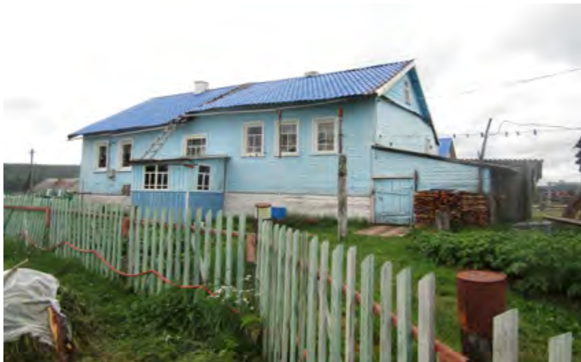
^ Рис. 4. Дом-двор В. В. Бирюковой (1964). С. Варзуга (Никольская сторона), Терский р-н. 2022