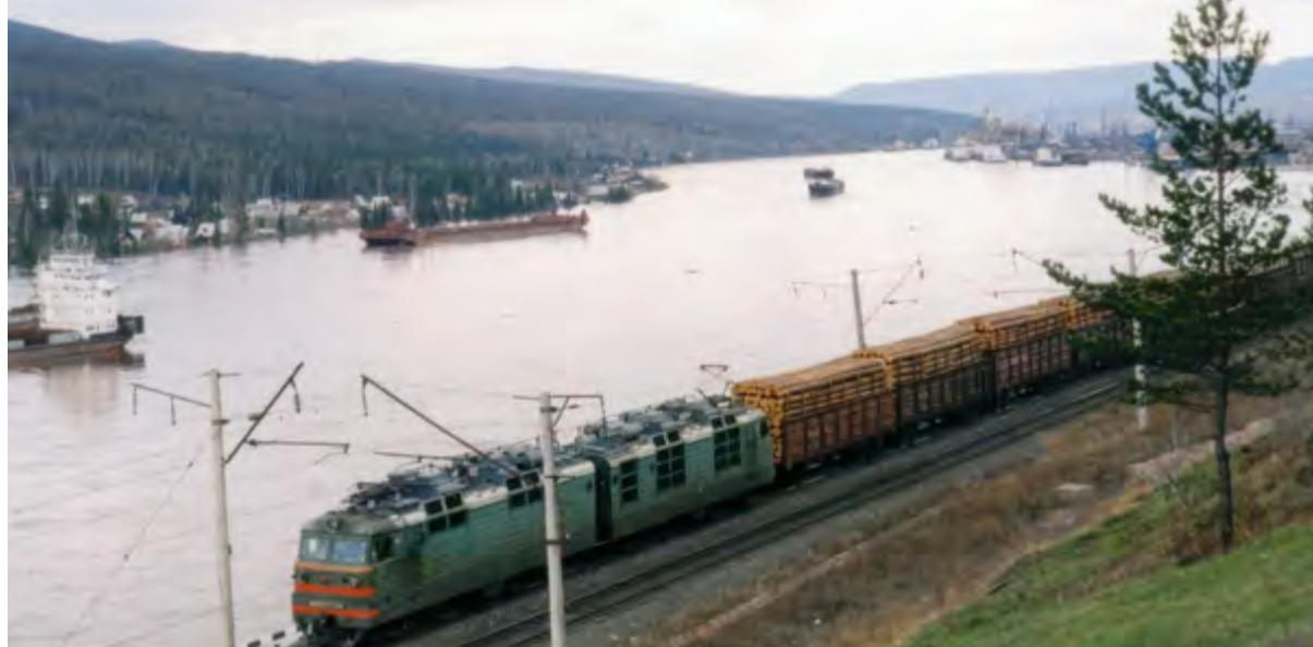
< Усть-Кут – транспортный перекресток.

производственных площадей, 5 тыс. м 2 офисных и 1,5 м 2 складских помещений превратились в «места Сталкера».