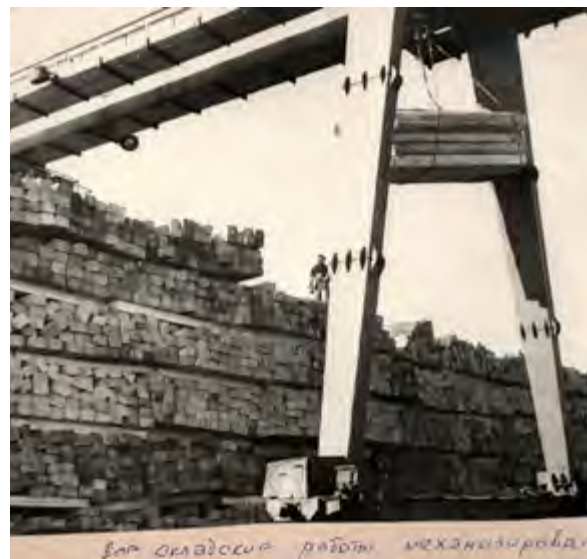
^ Тайшетский шпалопропиточный завод. 1960-е годы. Архивное фото [12]