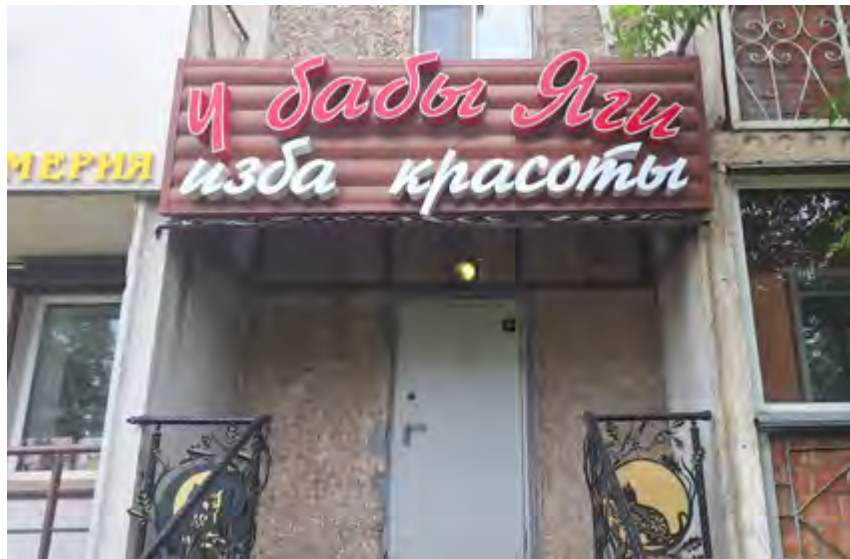
^ Тайшет. Салон красоты на ул. Транспортной.