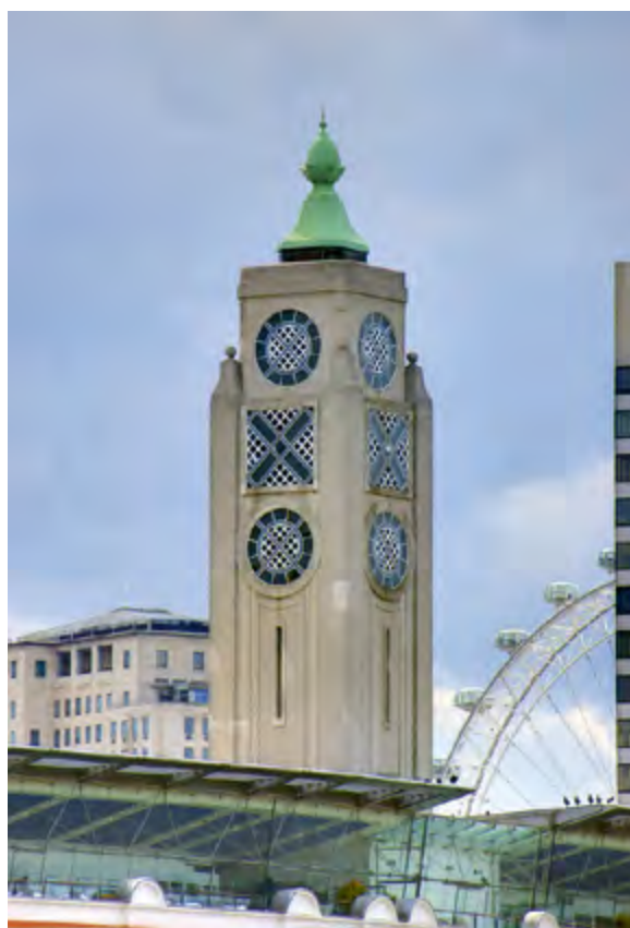
< Рис. 7. Башня Оксо (Лондон)