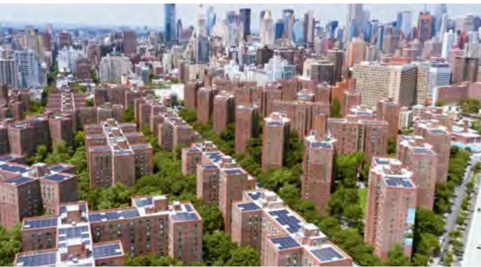
^ Рис. 4. Стайвесант-таун – Питер-Купер-Виллидж (Нью-Йорк). Вид на район сверху ( https://clck.ru/3CgSdt )