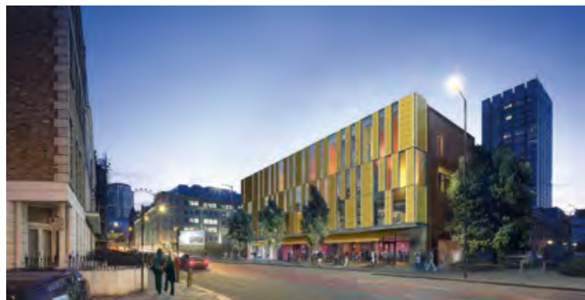
^ Рис. 5. Коин-стрит (Лондон) – район гармоничной артикуляции географического и социологического воображения ( https://clck.ru/3CgTUG )