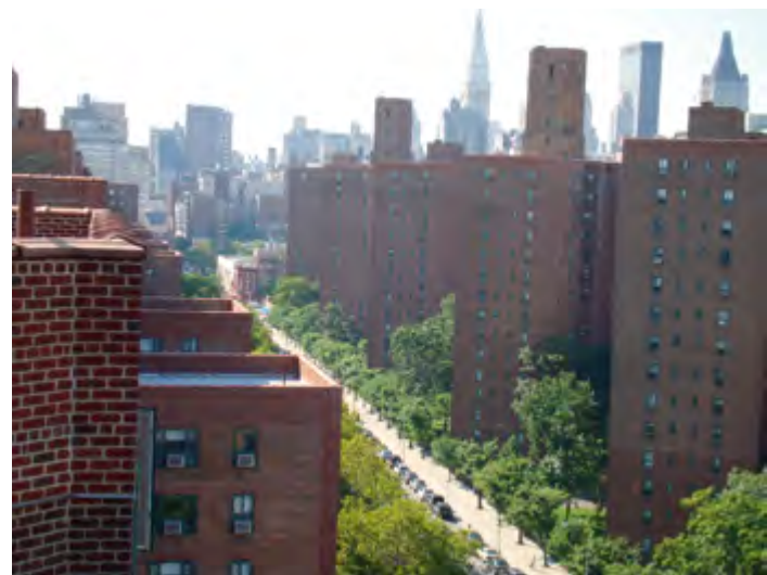
^ Рис. 3. Стайвесант-таун – Питер-Купер-Виллидж (Нью-Йорк) – попытка экспликации социологического воображения ( https://clck.ru/3CgSWz )