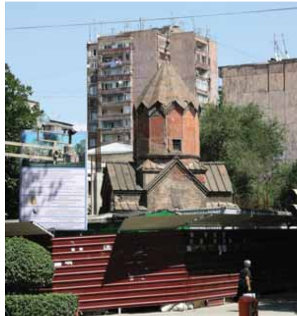
^ Рис. 6. Церковь Катогики (XIII в.).

зонгального» среднего наследия 1960-х пишет и Рубен Аревшатян (Arevshatyan R. Blank Zones in Collective Memory or the Transformation of Yerevan's Urban Space in the 60s // Red Thread. Issue 2 (2010) // http://www.red-thread.org/en/article.asp?a=33 ).