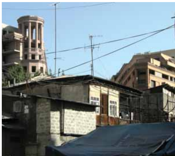
^ Рис. 3. Северный проспект упирается сегодня в вернакулярную застройку квартала между улицами Абовяна, Арами, Налбандяна и Пушкина. Данная территория объявлена зоной приоритетных государственных интересов. Собственность отчуждена. Вероятность сохранения этого уголка старого Еревана очень мала...

С города нельзя, как в самые счастливые минуты с женщины, снять последний покров, обнажив – пусть – ее суть, ее душу. Душа города всегда в чем-то спрятана. Но чуть подсмотреть, приоткрыть – где один «лепесток», где несколько, где случайным попаданием в резонанс, где усилием мысли, где интуицией – иногда получается. Вдруг повезет?