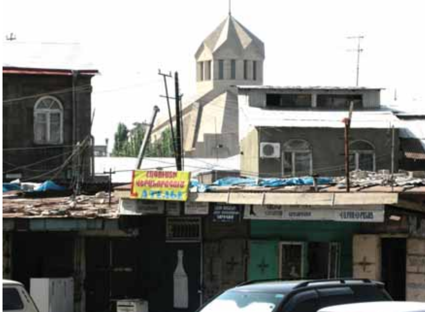
^ Рис. 14. Рынок близ ул. Бузанда и собор Св. Григория Просветителя (2001).

Будки – одно из немногих армянских слов, которые я пока запомнил, – тоже проявление этой стихийной деятельности малых субъектов по обустройству городской среды – «низовому» градоустройству. Жаль, что сегодня – почти единственно для них возможное.