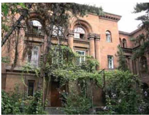
< Рис. 9. Район Козерна. Панорама застройки. 2011