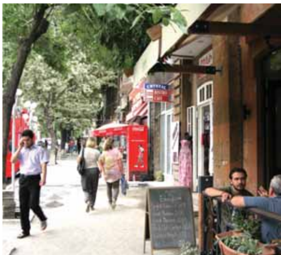
< Рис. 4. Дом на углу улиц Абовяна и Арами (на фото справа – адрес Арами, 30) так естествен, что почти незаметен. Не памятник. Но таких живых, полноценно функционирующих, аутентичных исторических зданий в Ереване осталось уже СЛИШКОМ МАЛО. В конце ноября 2011 года был обнесен строительным забором, что в Ереване означает скорый снос. Молодежь города при поддержке нескольких НПО встала на защиту этого здания.

– Сколько каменных – точнее «памятных» – кож у