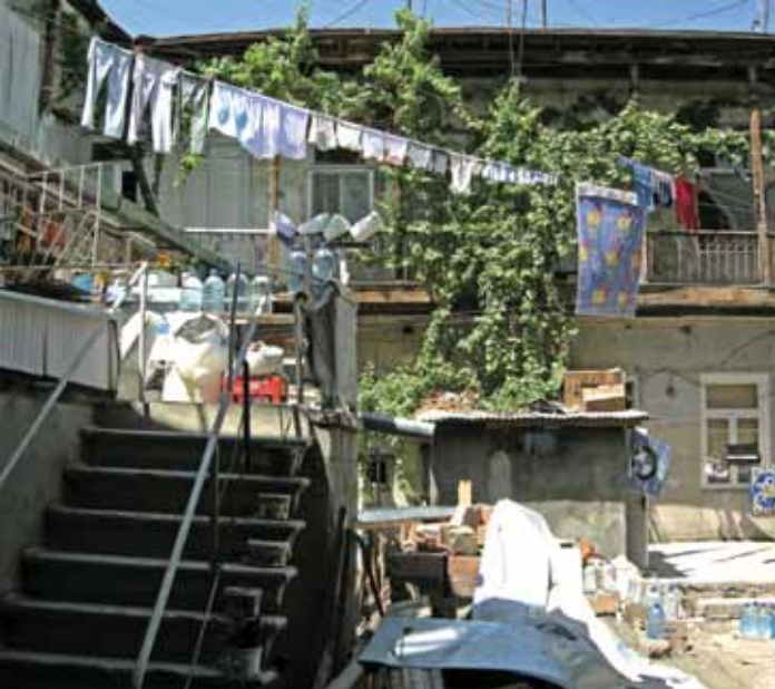
^ Рис. 13. Дворик на ул. Абовяна, 1. Фото автора, 2011