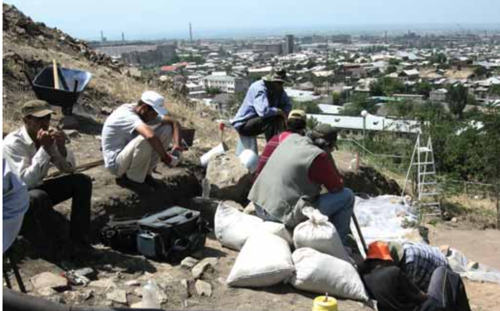
^ Рис. 5. Городище Эребуни. Археологические раскопки культурного слоя VII в. до н. э. на холме Аринберд под руководством археолога Ашота Пилипосяна. Фото автора, 2011