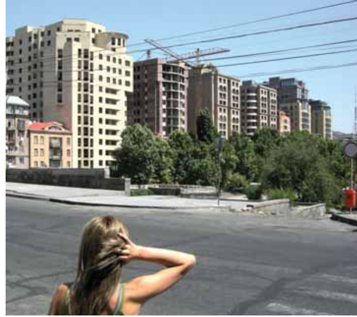
^ Рис. 12. Новый жилой комплекс на ул. Арами. Вид с ул. Сарьяна.

15. Open Source Urbanism. An op-ed from New York by Saskia Sassen // domus, June 29, 2011 // http://www.domusweb.it/en/op-ed/open-source-urbanism/ .