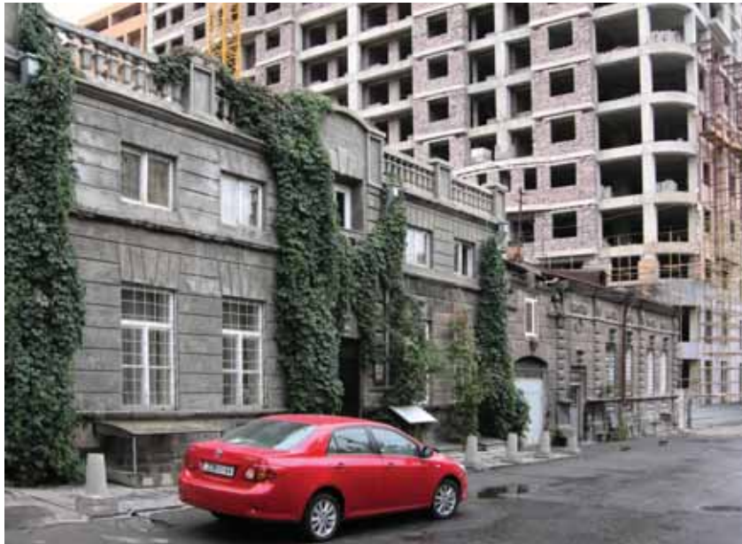
< Рис. 7. Минарет Гей-мечети (1760–1768) и окружающая застройка.