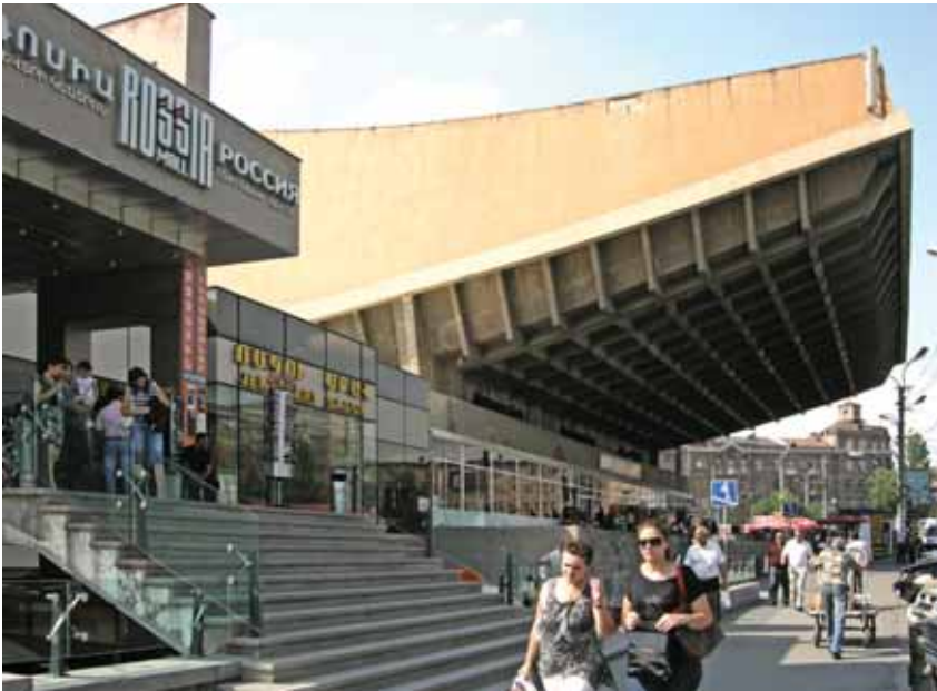
^ Рис. 11. Кинотеатр «Россия» – ныне торговый центр Rossiya Mall (арх. А. Тарханян, Г. Погосян, С.Хачикян, 1975).