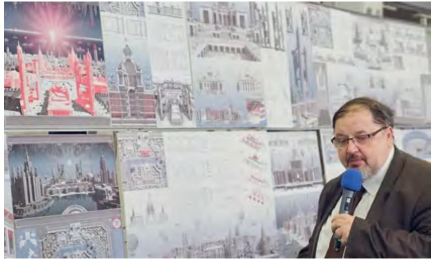
^ Рис. 5. Ректор МАРХИ Д. О. Швидковский. Предзащита

стве есть подготовленная почва. Есть ли она сегодня? Набирают ли в российской архитектуре вновь силу символическое и неоклассическое направления – покажет время.