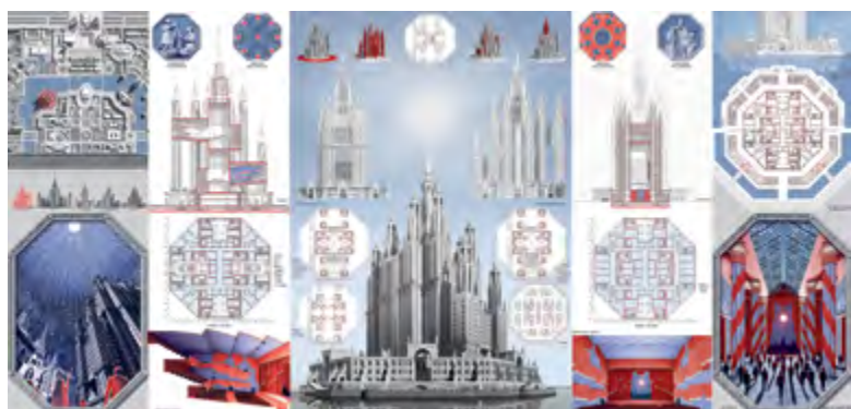
v Рис. 6. С. Павлов. Театр. Дипломный проект