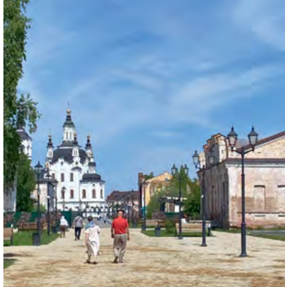
^ Tobolsk. Пешеходная улица