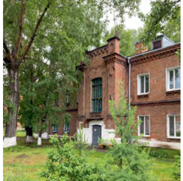
^ Канск. Военный городок