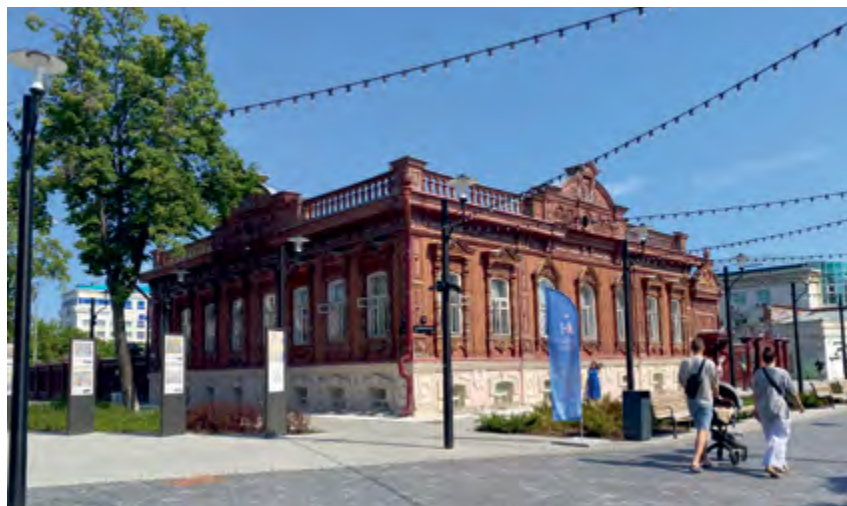
^ Тюмень. Пешеходная улица