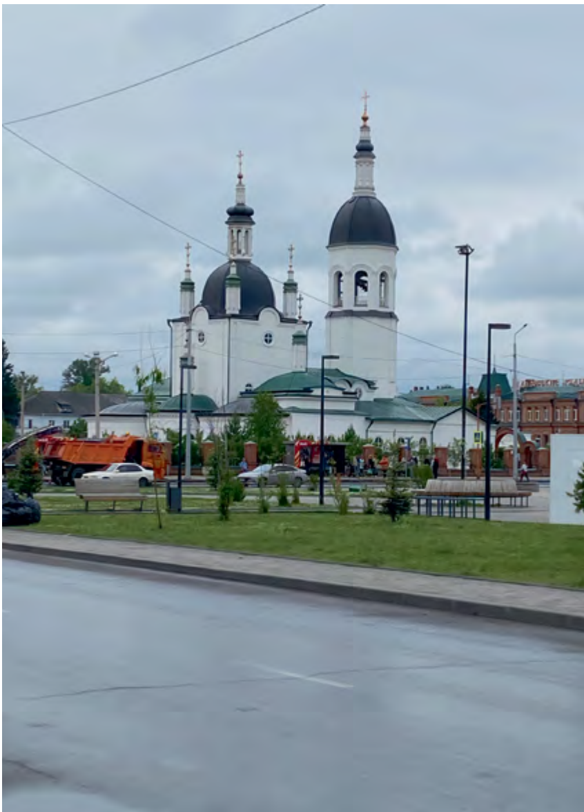
v Канск. Храм на главной городской площади

архитектурного и ландшафтного наследия и приспособления их к современным условиям» жюри отметило Золотым дипломом администрацию города Тобольска, представившую программу «Тобольск настоящий – создаем будущее, не изменяя прошлому».