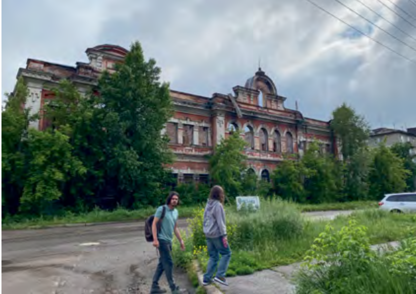
^ Канск. Не лучшие времена...