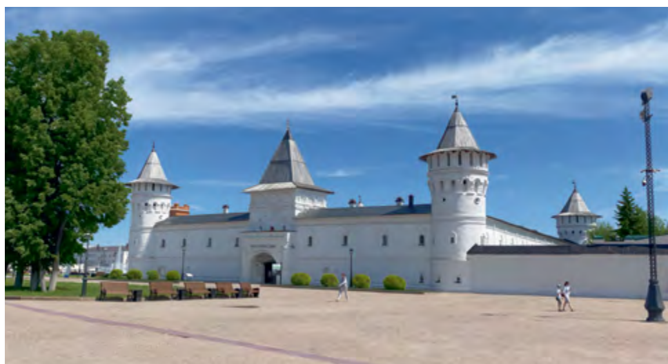
^ Тобольск. Гостиные ряды

Keywords: architectural monuments; Tobolsk; Yeniseysk; ZVS Festival 2024; Tyumen; Kansk; historic city; public spaces.