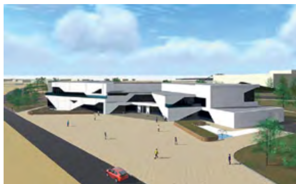
< Рис. 4. Музей азиатского искусства

Возле торгового центра «Яркомолл», вблизи исторического 130-го квартала, предлагается создать отдельный музей для существующей в городе коллекции азиатского