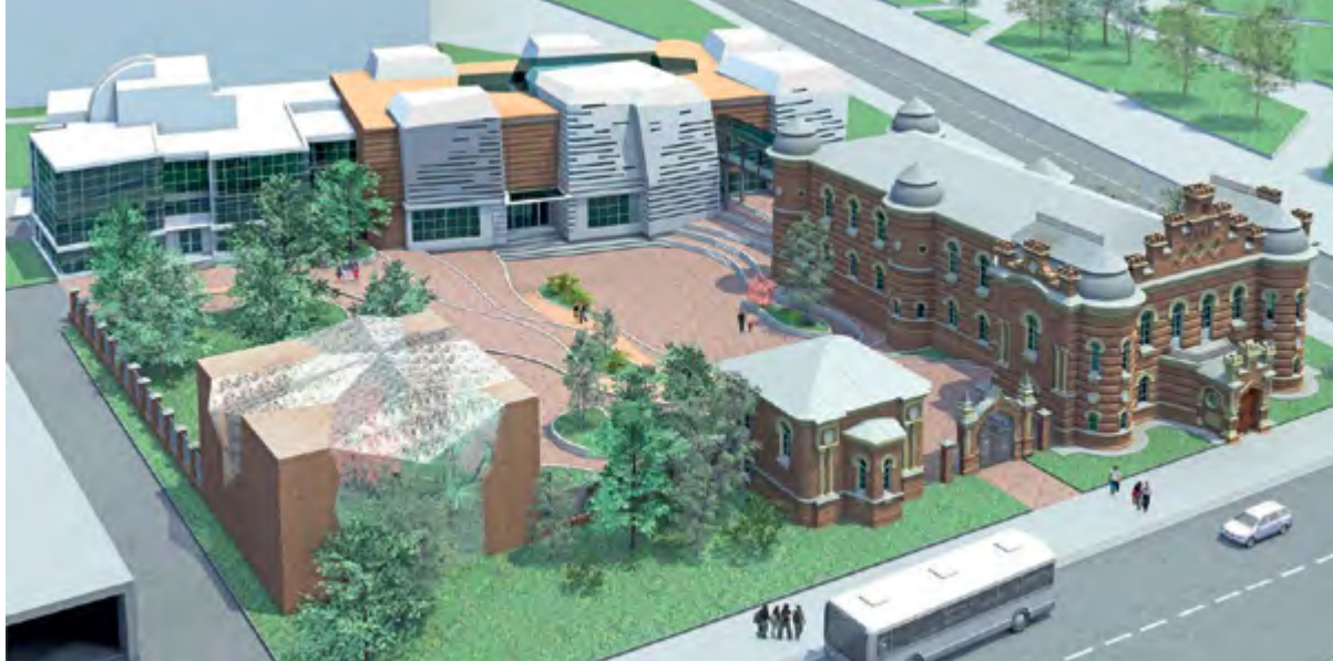
< Рис. 2. Проект реконструкции Иркутского областного краеведческого музея