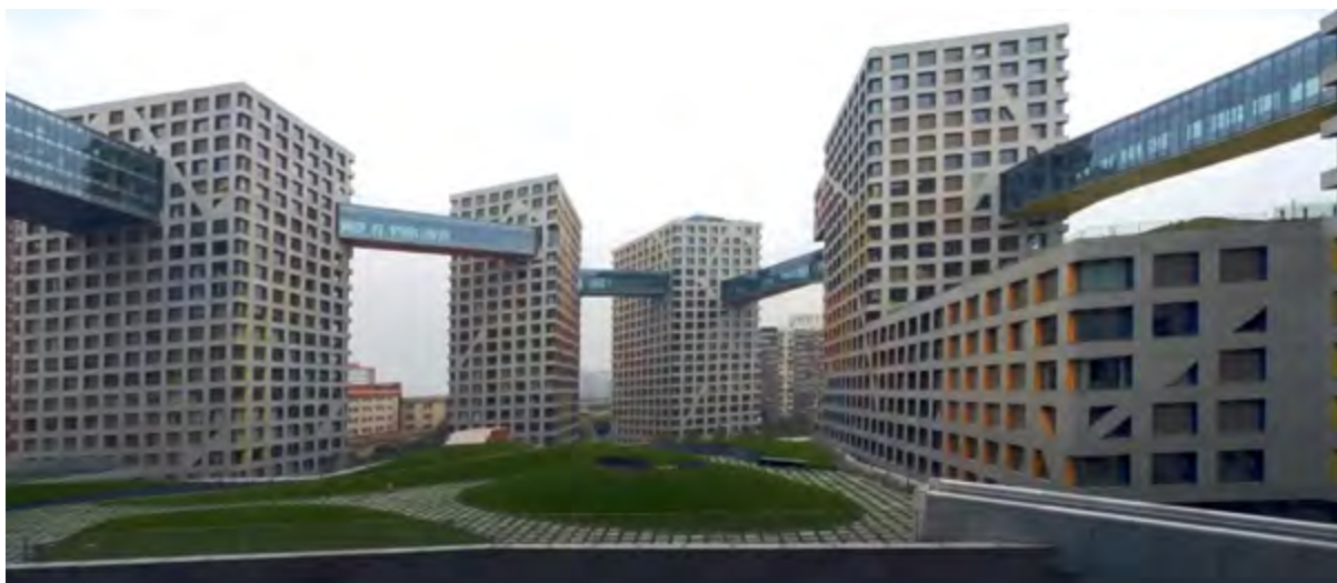
< Рис. 3 Linked Hybrid в Пекине. Вид на часть комплекса днем ( https://www.youtube.com/watch?v=HaVG4V25av0 )

ции стал микроурбанизм, или «город в городе». С. Холл критикует типичный сегодня способ застройки высоких монофункциональных зданий, лишенных общего пространства и соответствующего «чувства пространства». Он противопоставляет этому проект-гибрид объединенных общей территорией жилых башен, дополненных множеством инфраструктурных объектов, включающих, помимо прочего, зеленые сады на крышах, общественные пространства и кафе. Комплекс был удостоен ряда архитектурных премий, в том числе за высокую экологичность и энергоэффективность.