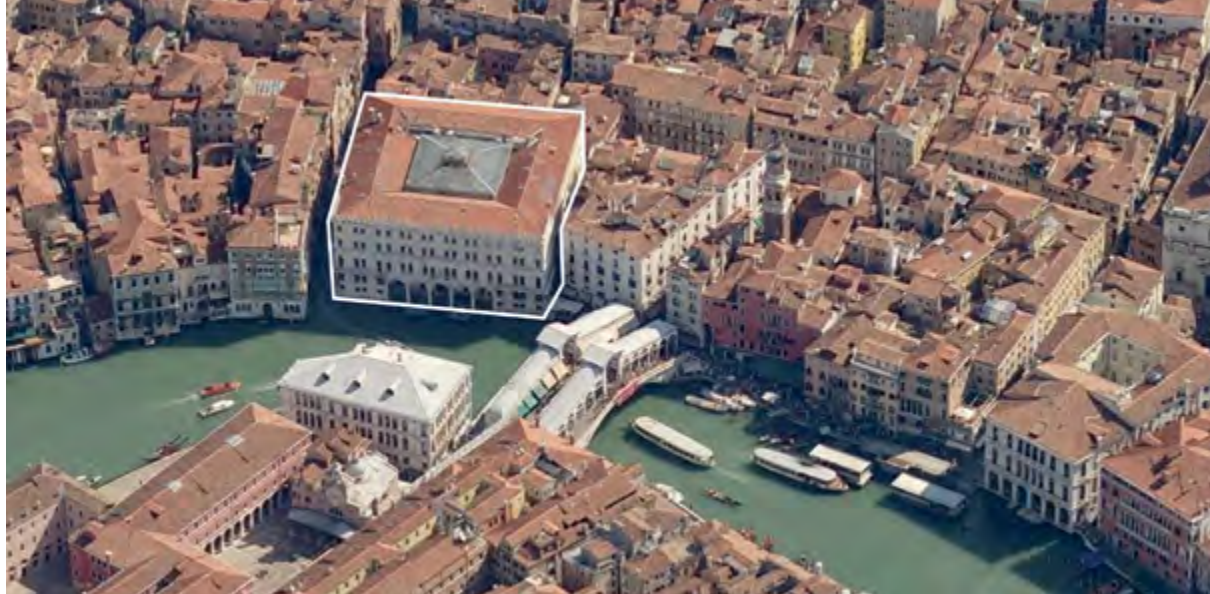
> Рис. 5. Фондако-деи-Тедески (немецкое подворье) в Венеции. Ныне – одноименный торговый центр, принадлежащий группе Benetton

Согласно онтологическому пониманию политического, оно пронизывает все городские процессы, реализуясь в борьбе за власть. В городе физическое пространство отражает это состояние конкурентного соревнования, проявляющегося в непрерывной территориализации капитала и смыслов, которые оказываются в серьезной взаимной зависимости. Смыслы, в свою очередь, связаны с процессом культурной интерпретации мира и пространства, в том числе физического. Проведение культурных и социальных различий в городе зачастую совпадает с реальным обозначением границ районов и территорий. Общественные пространства отделяются от частных, районы отличаются по престижности, уровню инфраструктурного развития, экологии и безопасности. Идея локализации групп, формирование гетто, экономическая и социальная демаркация пространства сопровождаются в исторической перспективе развитие городов. Городское пространство существует в разнящихся установках принятия/отторжения людей, населяющих его, вследствие чего разные стратегии идентификации с местом приводят к созданию противоречивого социального ландшафта. Примером может послужить почти каждый город-мегаполис или исторически значимый центр культурного и политического влияния.