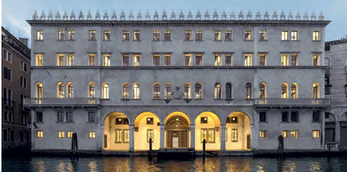
< Рис. 6. Жилое и торговое пространство Фондако-деи-Тедески

систематизации, редукции и следования заданной системе смыслов становятся неразличимы. Универсализация интуитивно связывается с объективностью и рациональностью, за которыми трудно разглядеть притязание на монополистическое доминирование определенных смыслов, не допускающих «кинаковости». Принадлежность другой системе рассматривается в антинаучных категориях иррационального, фрагментарного, этически недопустимого. Научные методы городского планирования и управления вытесняют из публичного пространства саму возможность делиберативной практики, живого, в духе Агоры, диспута. Горожанам предлагается выбирать из заданного списка возможностей. Алгоритмичность и технократичность принятия решений из эффективного метода превращается в идеологию.