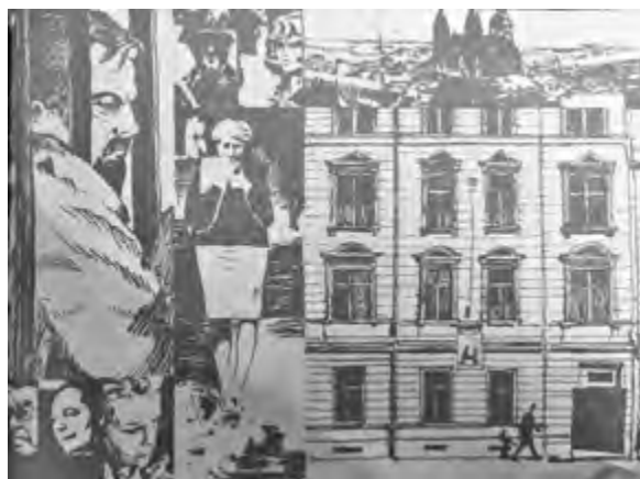
^ Рис.3. Иллюстрации к книге Л.И. Шинкарева «Длинная командировка» [10]

танцевальной веранды на тему «Ритмы/джаз» и триптиха «Прекрасное – жизнь» (4,5 × 1,5 м) в Боровом, триптиха «Ноктюрн. Баллада. Оратория» (3 × 1 м) для краевого драмтеатра.