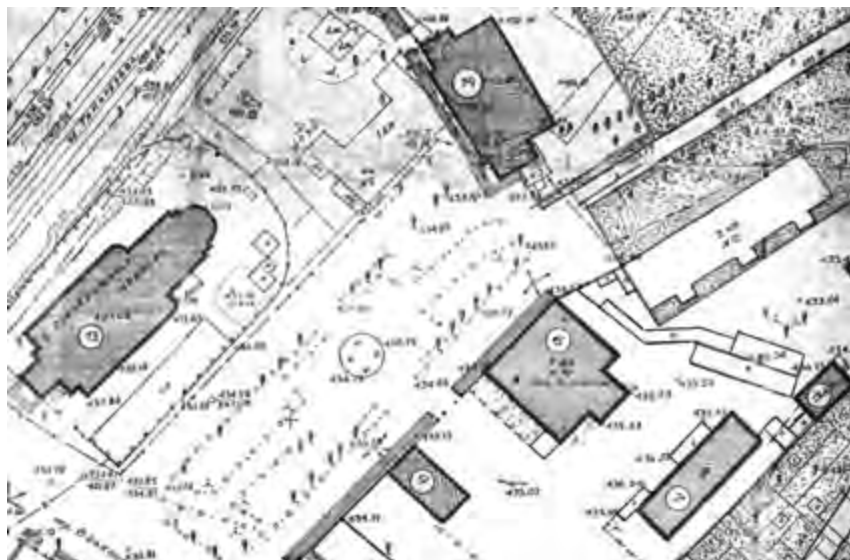
v Рис. 1. Фрагмент генплана комплекса Декабристов [5]