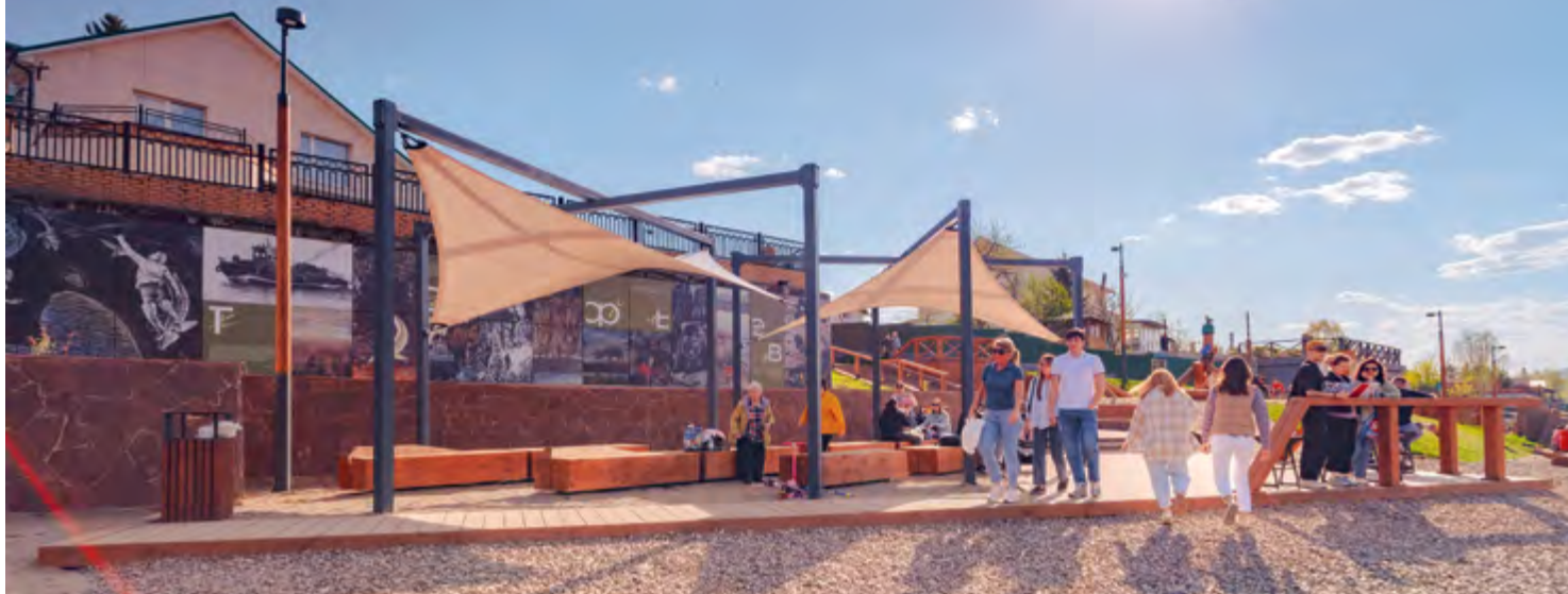
^ Набережная Овсянки.