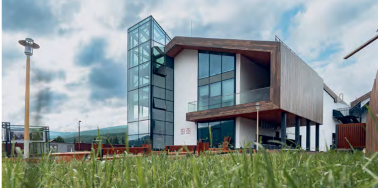
< Северо-западный угол.

ся к России мира. А там, глядишь, и заметной статьей Красноярского бюджета» [1, с. 10; 2].