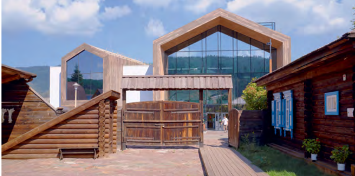
< Южный фасад. Вид с территории музея повести «Последний поклон».

и растворяет объект в панорамах села, визуально расширяет прилегающие к зданию пространства, приглашает зайти и прикоснуться к истории жизни и творчества великого писателя, а также познать глубину сибирской души и сибирской природы.