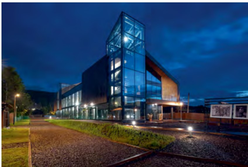
^ Северо-восточный угол. Фото «КПМ А-2»