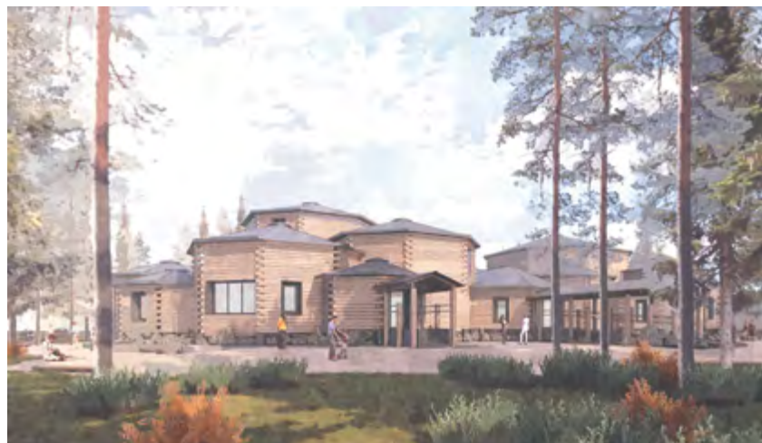
^ Депозитарий «Небесное Кенозерье»

только через объездную трассу. И другого пути нет. Это, конечно, очень мило, но с градостроительной точки зрения – просто безобразие. Правда, есть второй путь: спуститься вниз пешком, пройти 3 километра и подняться в другом месте. И третий путь – пиратским образом ехать через лес. Увы, в Шерегеше есть серьезные проблемы и в общей планировке поселка, и в его структуре. И пока не будет некоего механизма планового воздействия на эту среду, все идеи рискуют обернуться утопиями.