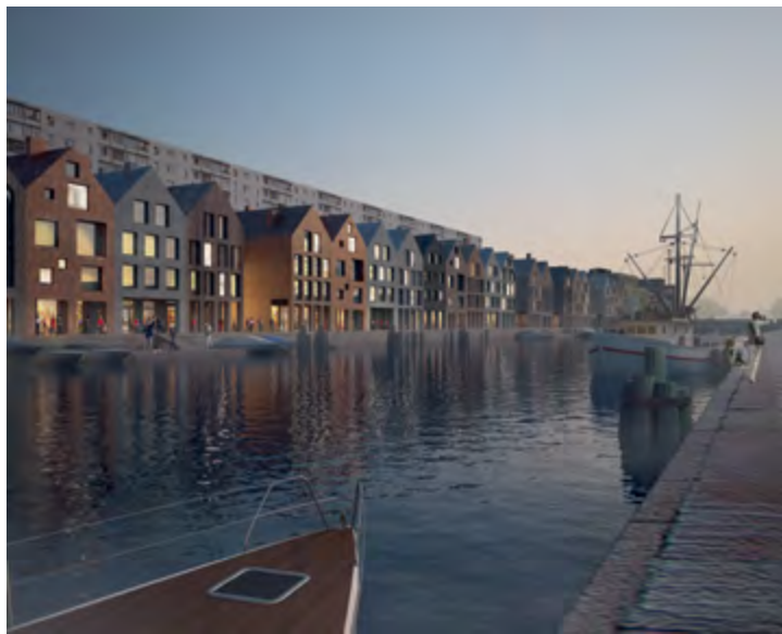
v Концепция развития исторического центра Калининграда