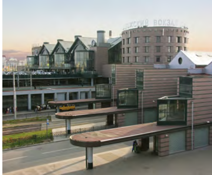
^ Вокзальный комплекс «Ладожский» в Санкт-Петербурге.

Keywords: architect N. Yavein; projects; buildings; apprentices; studio; St. Petersburg.