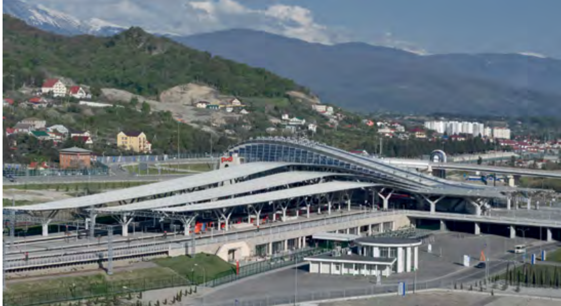
^ Вокзал «Олимпийский парк» в Сочи.

Никита Явейн Да, наверное! Кроме того, это ведь страшно – под давлением авторитета оказаться. Такая перспектива пугает, и тут я своих детей понимаю.