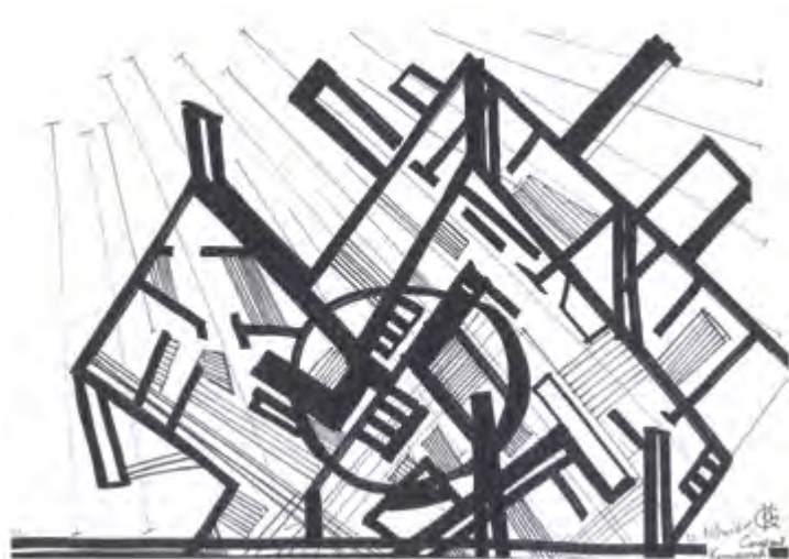
^ Рис. 6. Работа лауреата студенческой номинации Софьи Кузьминой