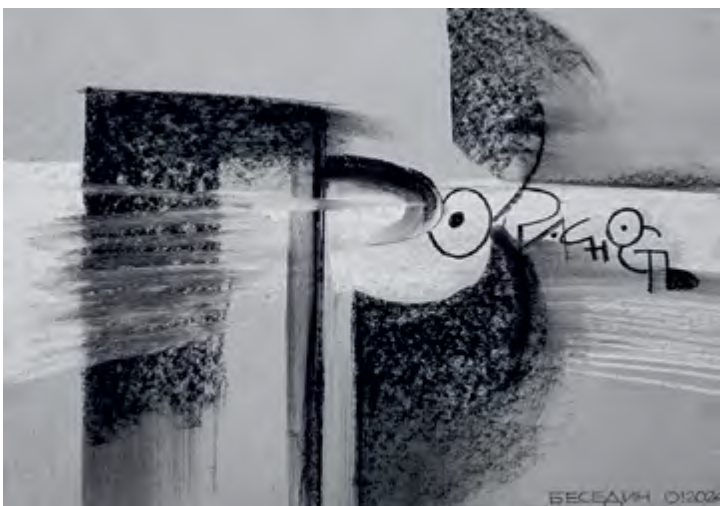
^ Рис. 7. Работа Олега Беседина. Топ-10