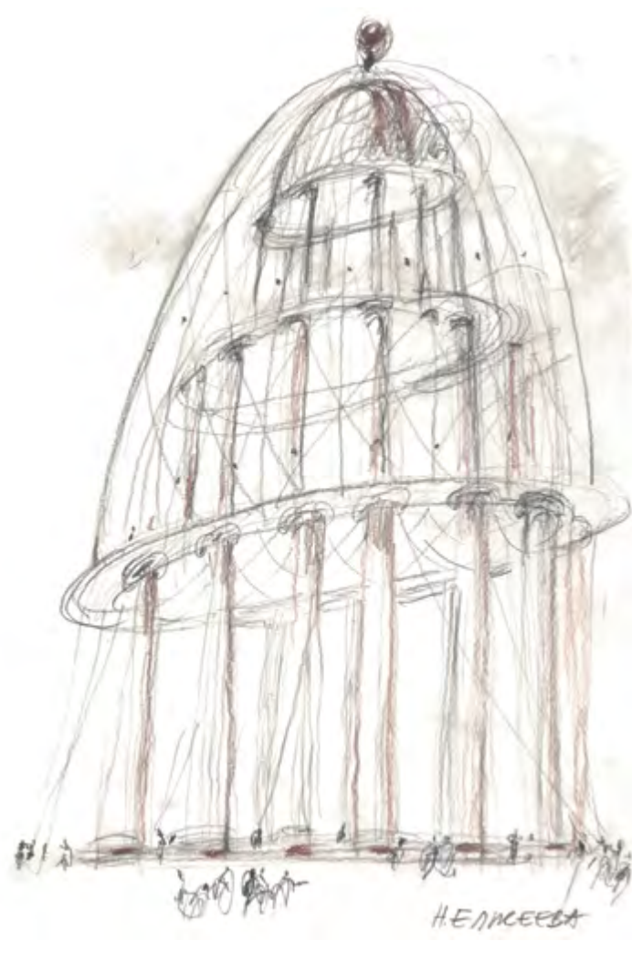
^ Рис. 8. Работа Натальи Елисеевой. Топ-10

25 студентов). В обеих номинациях жюри отметило 10 лучших работ.