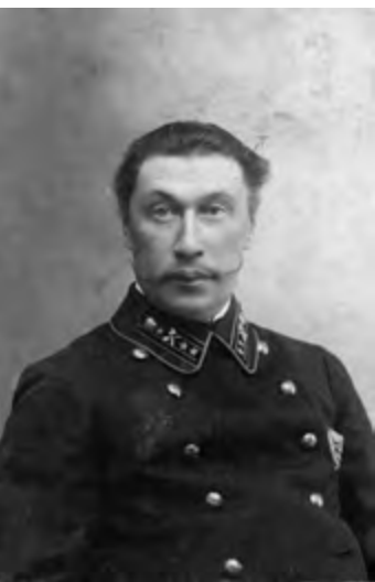
< Архитектор В. А. Соколовский.

Статья знакомит читателей с жизнью и деятельностью выдающегося сибирского зодчего Владимира Александровича Соколовского в преддверии его 150-летнего юбилея. Описаны сохранившиеся постройки архитектора в Красноярске, показано влияние архитектуры Соколовского на формирование сибирского модерна и эклектики. Показана роль архитектора в становлении и развитии архитектурной среды Красноярска первой половины XX века. Описана история двух построек деревянной и каменной архитектуры, к возникновению которых Соколовский был причастен и как архитектор, и как реставратор.