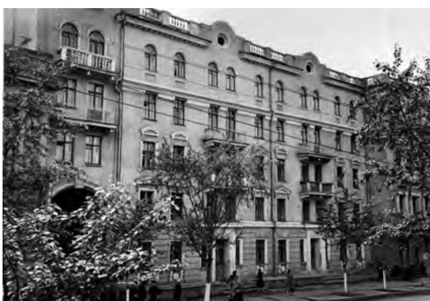
^ Рис. 18. Трехэтажный дом купца Абудеева, встроенный в административно-жилое здание ГХК (фото слева). Общий вид административно-жилого здания ГХК (фото справа). 1957

их объектов, детали его интерьеров вызывают восхищение – от каминов до дверных ручек, лепнины на потолках, прекрасных полотен живописи на стенах, изящной ковки решеток и скобяных изделий. Нельзя тут не отметить и то, что его инженерный талант проявлялся в обеспечении функциональности зданий.