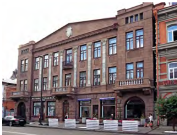
< Рис. 10. Красноярск. Торговый дом «Ревильон-братья».