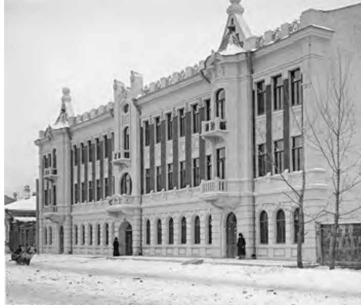
^ Рис. 8. Красноярск. Доходный дом с почтамтом.

приватной и хозяйственной зон. К просторной передней примыкали кабинет и гостиная, в глубине квартиры располагались спальня и детская. Окна жилых комнат выходили на главный фасад, окна кухни и столовой – во двор. Хозяйственная зона включала столовую, кухню, санузел и кладовые. Все квартиры имели второй выход на «черную» лестницу через кухню.