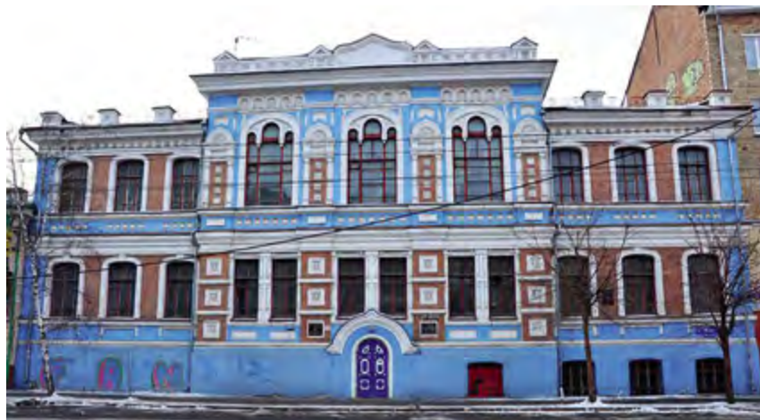
^ Рис. 2. Красноярск. Епархиальное училище. Фото авторов