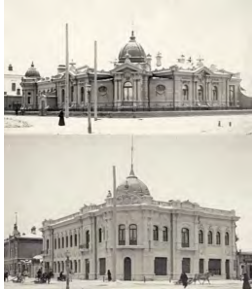
^ Рис. 4. Красноярск. Особняк В. Н. Гадаловой (вверху). Особняк М. М. Зельмановича (внизу).

церкви (1901–1918); проект постройки административного города для Урянхайского края – название Тывы в 1914–1921 (1910-е; не осуществлен из-за начала Гражданской войны); здания различного назначения для культбазы в урочище Тур на р. Нижней Тунгуске: проект и строительство первой очереди, основанной в 1926; ныне Тура – административный центр Эвенкийского авт. округа (1928–1930).