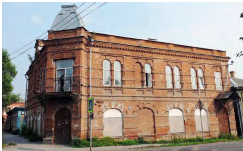
^ Рис. 1. Ачинск. Жилой дом с магазином (слева). Здание женской прогимназии (справа).