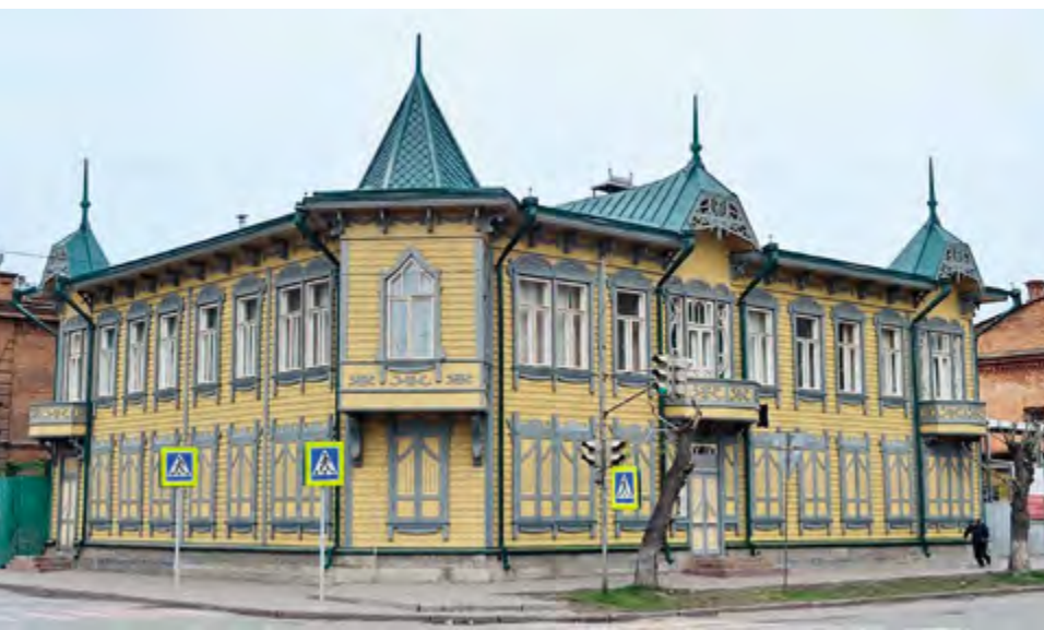
^ Рис. 12. Красноярск. Дом Севастьянова.