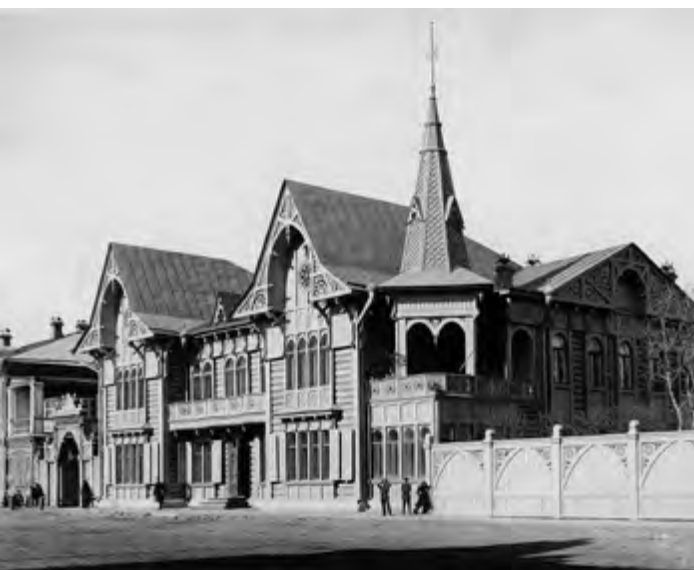
^ Рис. 14. Красноярск. Дом Ф. Цукерман.