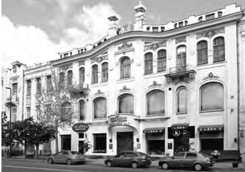
^ Рис. 7. Красноярск. Торговый дом И. С. Либмана.