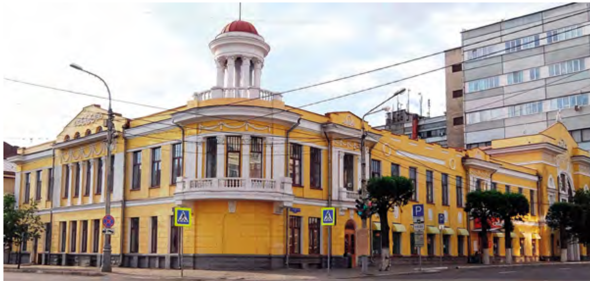
< Рис. 11. Красноярск. Здание Общественного собрания.

Архитектурно-художественное решение в целом отвечает стилистике московского ампира. О московских ампирных особняках напоминает цветное решение с выделением белых ордерных деталей и лепного декора на фоне цветной штукатурки стен, скругленный угол, отмечающий угловое положение здания на перекрестке улиц и акцентированный небольшой купольной ротондой. Главный вход, располагающийся с переулка, выделен большим полуциркульным окном с барельефами над ним.