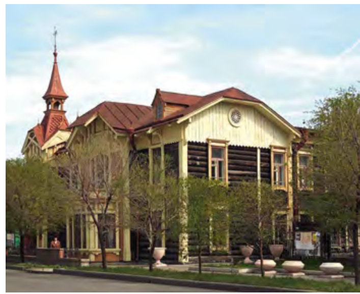
^ Рис. 13. Красноярск. Дом Дмитриева.

попарно и обрамлены сквозными брусками-стойками «фахверка». Ризалиты главного фасада выявлены высокими крутыми фронтонами с арками-затяжками и резным заполнением. Дополнила образ стрельчатые обрамления окон и узоры в форме трилистника над ними.