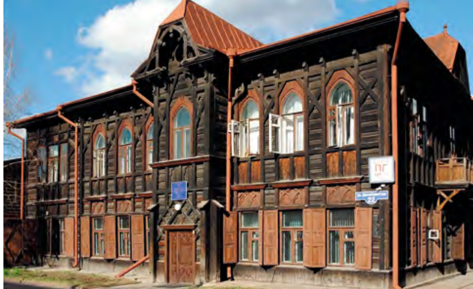
^ Рис. 3. Красноярск. Римско-католический костел (слева). Дом ксендза (справа).