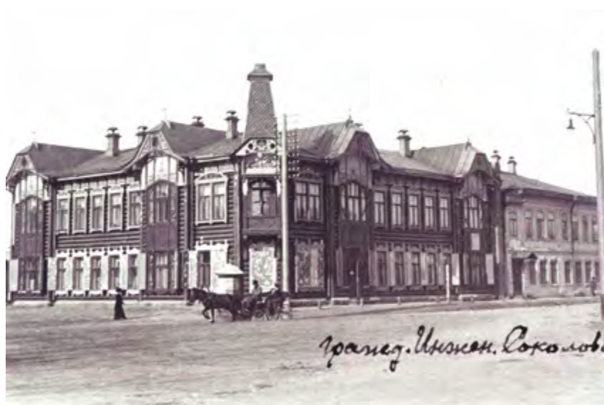
^ Рис. 15. Красноярск. Доходный дом (не сохранился).

Вскоре каменный дом усадьбы Цукерманы сдали внаем Красноярскому землемерному училищу до 1920 года. В 1913 году вся усадьба была оценена в 33825 рублей. Это была очень внушительная сумма; например, стоимость городского сада в эти годы была 12000 рублей.