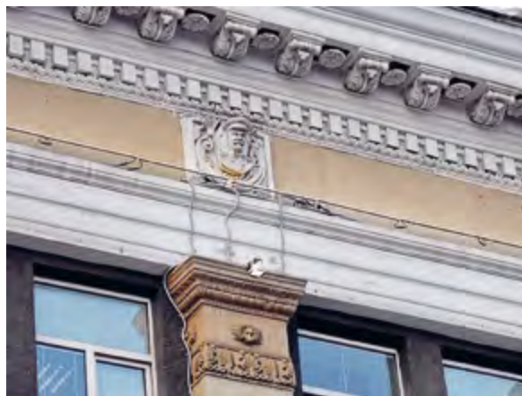
< Рис. 8. Фрагмент фронтона Управления ВСЖД. Фото Василия Лисицина. 2023