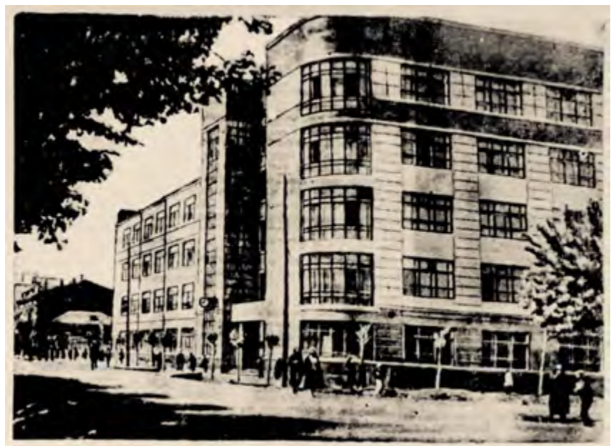
v Рис. 1. Фото здания Управления ВСЖД [7]

После Великой Отечественной войны динамично шло восстановление народного хозяйства, в связи с чем увеличились темпы груза и пассажироперевозок по Восточно-Сибирской железной дороге. Существующих площадей для аппарата Управления ВСЖД стало не хватать, и было принято решение реконструировать здание с увеличением общей площади за счет сноса деревянных дореволюционных построек, а также надстроить рядом стоящее каменное здание, в котором располагалась типография газеты «Восточно-Сибирский путь», и начать строительство нового объема («левого крыла»). Стилистика предполагаемого строения лежала в плоскости господствующего в то время советского неоклассицизма.