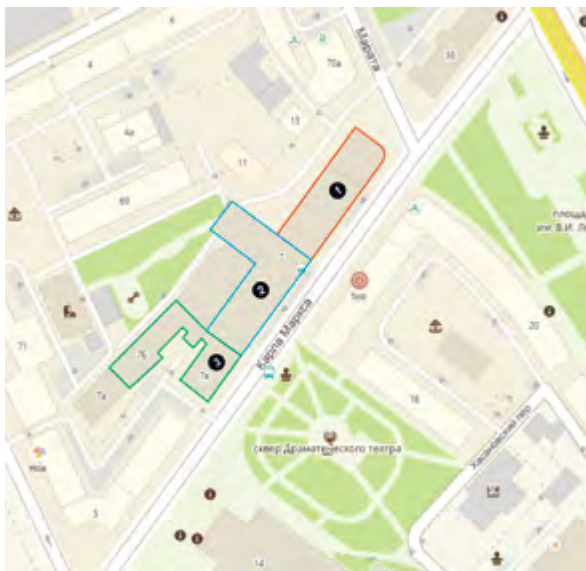
^ Рис. 6. Этапы застройки здания Управление ВСЖД (карта 2ГИС): 6а. Постройка 1930-х. Архитектор К. Миталь 6б. Постройка конца 1940-х. Архитектор Д. Гольдштейн 6в. Историческая дореволюционная застройка