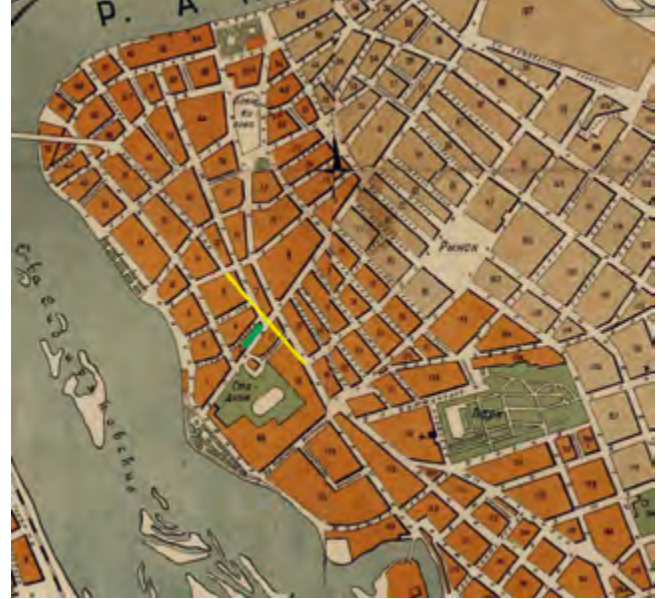
^ Рис. 4. Фрагмент плана города Иркутска 1940. Здание Управления ВСЖД (зеленый цвет). Трассировка ул. Степана Разина до Иркутского театра музыкальной комедии (желтый цвет)

Проект, реконструкция и строительство здания осуществлены в 1947–1950 годы. Автор проекта архитектор Давыд Моисеевич Гольдштейн, выпускник Московского архитектурно-строительного института 1934 года, автор многих иркутских проектов, в т. ч. главного корпуса здания Иргиредмет (ныне бульвар Гагарина, 38; 1950-е), здания общежития Иркутского финансово-экономического института (ул. Ленина, 11; 1952) и др.