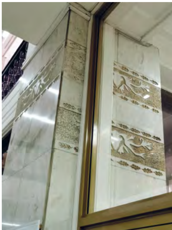
> Рис. 12. Фрагмент рельефа на мраморной отделке несущей конструкции здания Управления ВСЖД. 2023

1. ГАИО. Ф. № Р-750. Оп. № 1. Всесоюзное объединение по добыче золота «Восток-золото» Народного комиссариата тяжелой промышленности СССР г. Иркутск Восточно-Сибирского края 12.11.1931 – 26.04.1933 // Архивный путеводитель. – URL: https://