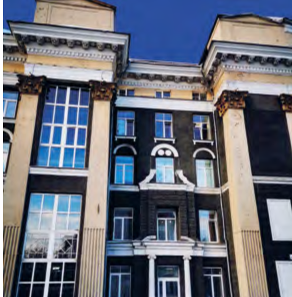
> Рис. 11. Главный вход Управления ВСЖД. 2023