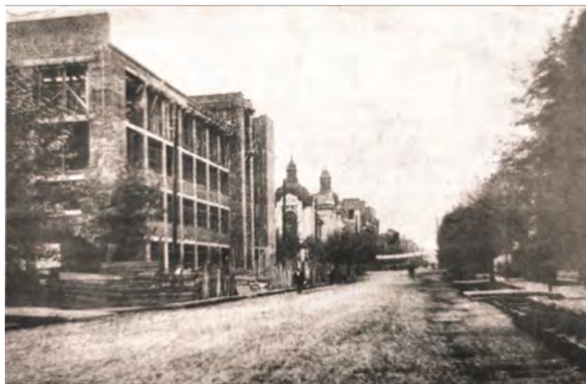
^ Рис. 7. Недостроенное здание треста «Востокзолото» [8, с. 586]

кулярный объем со стороны двора. Здание типографии надстраивать не стали, и внешне оно осталось нетронутым; в настоящее время соединено с главным объемом общими коридорами первого и второго этажей. Шпиль и часы не установили, но в остальном проектное решение было выполнено (рис. 5).