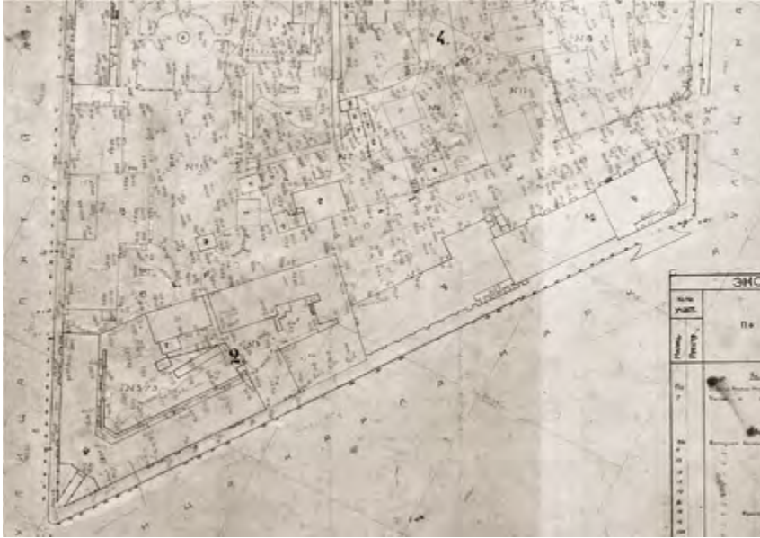
^ Рис. 3. Фрагмент реестрового плана г. Иркутска. 1929. Квартал 2 и 4