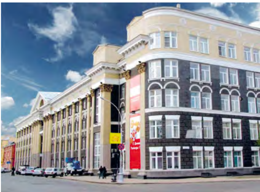
v Рис. 5. Перспектива здания Управления ВСЖД (перекресток улиц Марата и Карла Маркса). 2010

В целом архитектор сохранил существующий объем и планировочную структуру старого здания, добавив основной четырехэтажный объем между миталевским «правым крылом» и зданием типографии и перпенди-