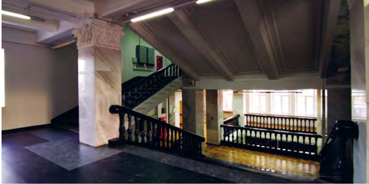
< Рис. 13. Интерьер лестничного пространства парадной лестницы между вторым и третьим этажами. 2023