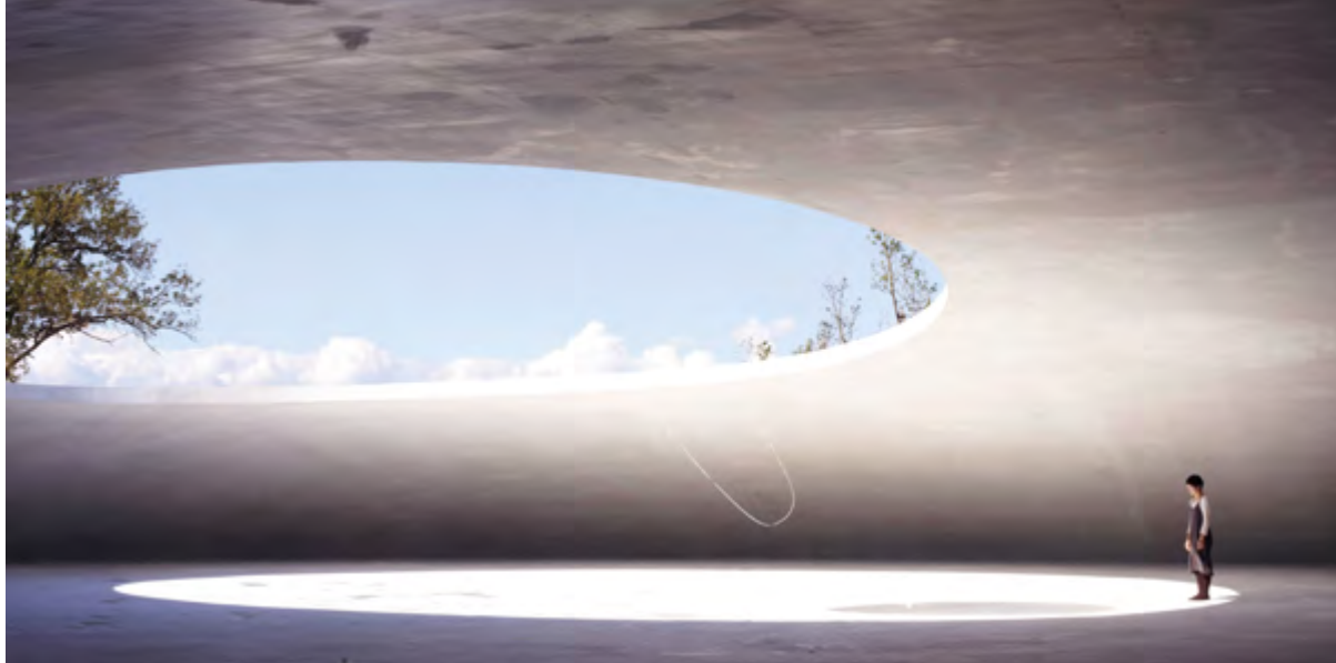
< Художественный музей Тэсима. Архитектор Рюэ Нисидзава. 2010

все большую популярность, являясь привлекательными как для местных жителей, так и для туристов. Однако необходимо отметить, что успеху современных японских музеев без коллекций в значительной степени сопутствует всемирно известное имя его архитектора.