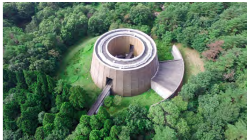
v Музей леса в префектуре Хёго. Архитектор Т. Андо. 1993–1994

Одной из характерных тенденций последних лет, проявляющих себя в Японии, стало создание музеев, которым коллекции произведений искусства вообще не нужны, зато функции архитектуры заметно расширяются. В результате появляются трудноопределимые по своему назначению постройки, получающие название «музей», но не предлагающие посетителям ничего с точки зрения музейной экспозиции. Эта функция часто не просто отходит на второй план, но в ряде случаев и вовсе