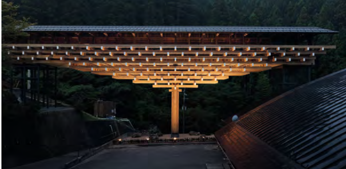
> v Мост-музей в Юсухара. Архитектор К. Кума. 2010–2011

Музей, благодаря своей архитектуре, стал самостоятельным объектом, воплощающим философию уважения к природе и ее жизненной силе. Посетители стремятся в этот музей из-за желания быть вовлеченными в пространство, которое захватывает и завораживает, влияет на мысли и чувства и никого не оставляет равнодушным.