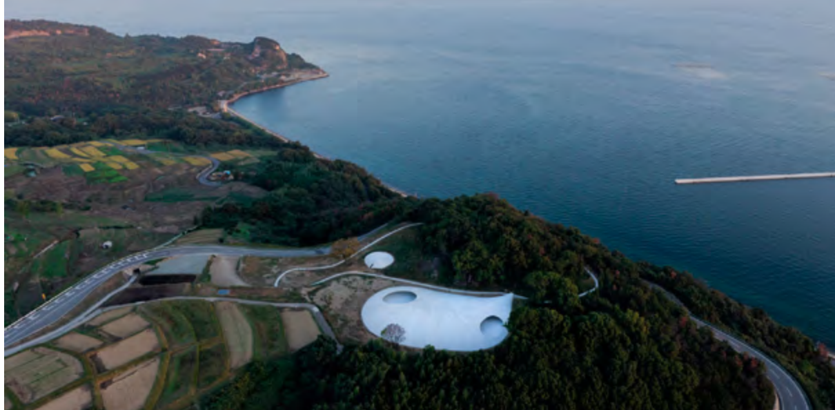
> v Художественный музей Тэсима. Архитектор Рюэ Нисидзава. 2010

Вокруг музея искусственно образован сложный рельеф, характеризующийся серьезными перепадами высоты. Он также стал символом диалога – диалога, по сути, неподвижной архитектуры с постоянно меняющимся городом. К-Музей состоит из разных частей (материалов и геометрических форм), которые вместе составляют единое целое, являясь образом города, в котором сосуществуют разные архитектурные стили, разные социально-ориентированные пространства и т. д. И только все вместе они образуют живой организм под названием «город». К-Музей в знаковой форме отразил динамизм развития города и одну из его главных характеристик – разнообразие, при котором комбинация простых составляющих рождает сложное целое. Однако взаимодействие многих различных элементов не должно нарушать фундаментальный принцип города: баланс – залог его устойчивого развития.