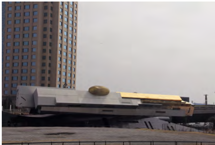
v ^ K-Музей в Токио. Архитектор Макото Сэй Ватанабэ. 1996

Результат получился настолько яркий, что при осмотре постройки складывается такое ощущение, что автором запечатлен короткий миг покоя в процессе перехода от одного режима (или состояния) к другому. Перехода постоянного и неизбежного. Сам архитектор назвал этот момент «рывком» [8, с. 21]. Именно он стал ключевым в восприятии всего произведения: ведь, экстраполируя эту ситуацию на город, именно это движение оживляет современный мегаполис, наполняет его жизнью.