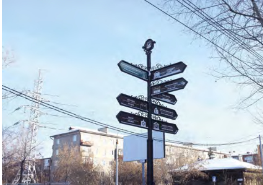
^ Рис. 2. Указатели исторических зон Иркутска

в небрежении к своей неискаженной памяти! Это постыдная страница не одного лишь Иркутска, а большинства провинциальных городов, больших и малых, но Иркутск это общее упрямство ничуть не оправдывает» [3].