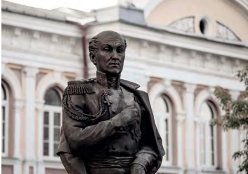
^ Рис. 5. Памятник графу Сперанскому вблизи площади его имени