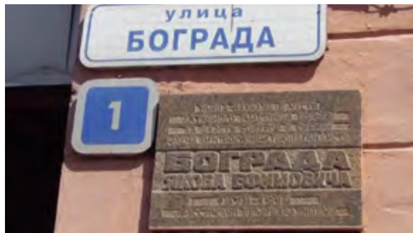
< Рис. 3. Адресный аншлаг улицы Чудотворской