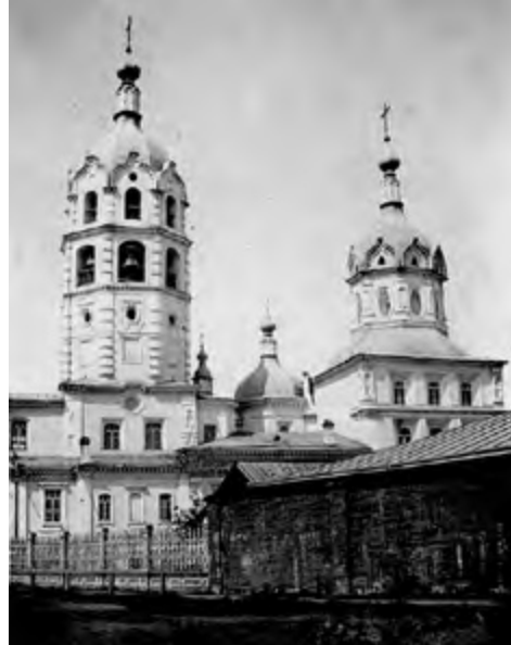
^ Рис. 6. Иркутск, церковь Прокопия и Иоанна, Устюжских Чудотворцев, располагавшаяся на Чудотворской и снесенная большевиками

что, будучи крупным революционером-подпольщиком, служил до революции коммерческим директором и членом правления губернского Союза потребительских обществ. После революции был комиссаром по транспорту военревкома, а ушел на пенсию с должности заместителя директора Института тонкой химической технологии в Москве. Его миновала доля и жертвы, и палача в 1930-е годы, и в 1962 году он был похоронен на Новодевичьем кладбище.