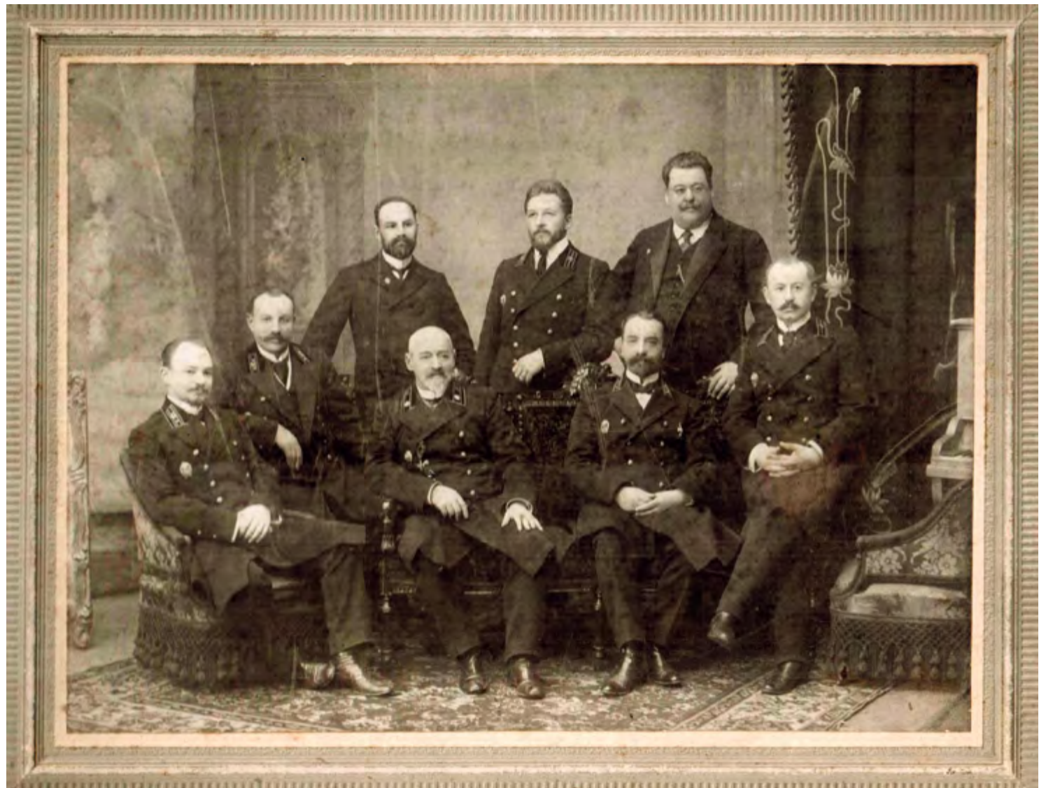
^ Рис. 17. Фотография начала XX века