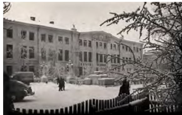
< Рис. 13. Здание Центрального телеграфа на площади Труда (реконструкция). Фото Э. Я. Берлова. Февр.1960 ( https://nature.baikal.ru/mats.shtml?mt=ph&list=cituy&rg=irkutsk )

Многогранность таланта Николая Иосифовича отражается не только в его архитектурных произведениях, но и в преподавательской и научной деятельности. За многочисленные достижения он неоднократно отмечался вышестоящим руководством и получал заслуженные поощрения и награды. В 1934 году за значительное