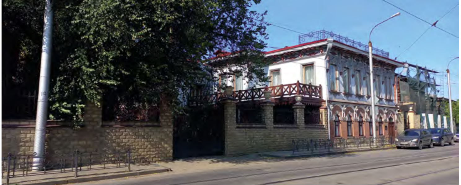
^ Рис. 5. Деревянная галерея особняка В. К. Бревнова. Фото И. Е. Дружининой. 2023

кой: «была удостоена звания учительницы начальных училищ» [2]. В семье воспитывались трое сыновей и дочь [3].