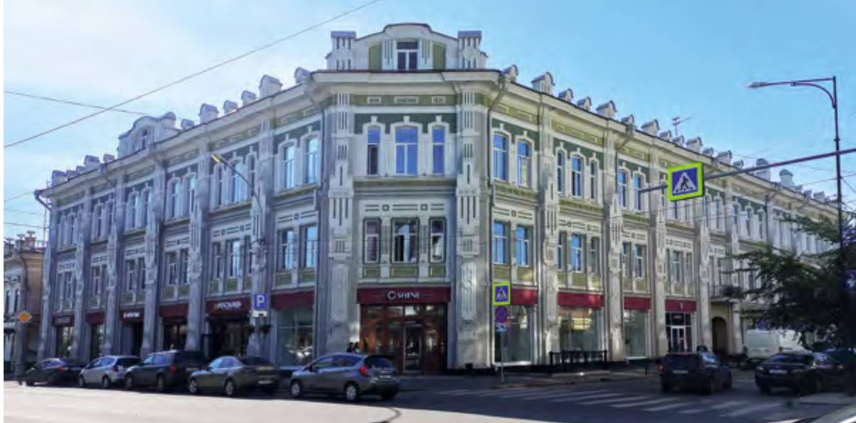
< Рис. 8. Доходный дом Ф. В. фон Люде по ул. Сухэ-Батора, 18. 2023

В 1921–1925 годах занимается реконструкцией и расширением здания Иркутской центральной электростанции (рис. 10) на углу улиц Гершевича и Набережной (утрачено в 2021), строит жилой дом для работников ЦЭС.