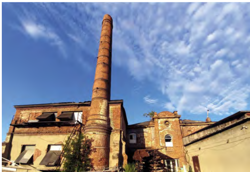
^ Рис. 9. Здание котельной Кожзавода «Сибиромонгол», Сурнова, 22. 2023