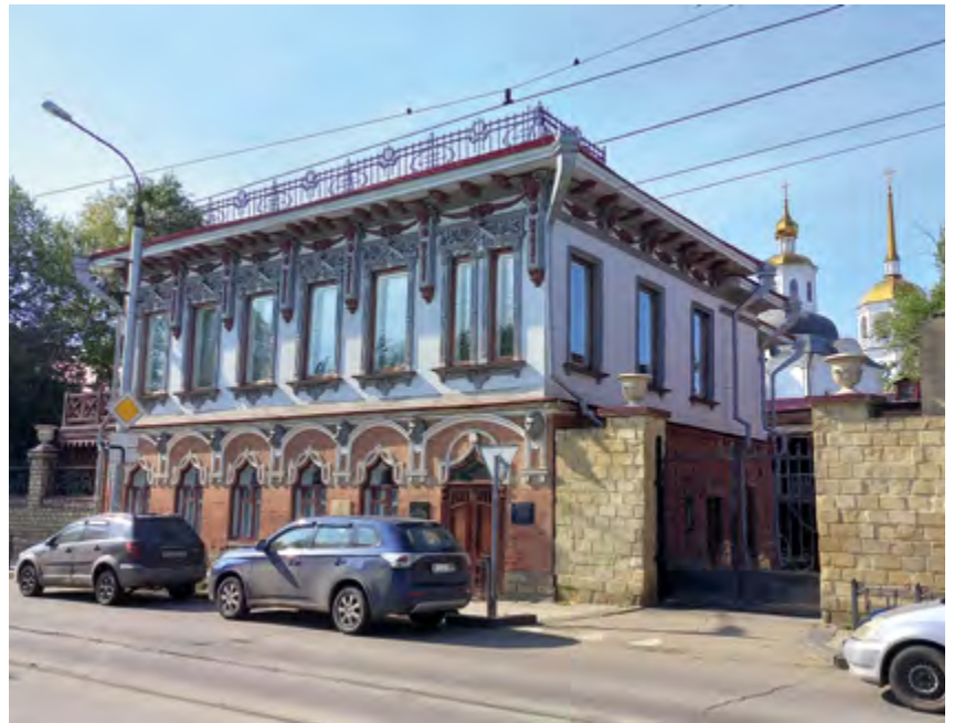
v Рис. 6. Особняк В. К. Бревнова. Фрагмент фасада. 2023