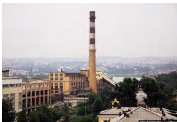
< Рис. 10. Вид на ЦЭС ( http://www.cn.ru/terka/post/4285389/ )