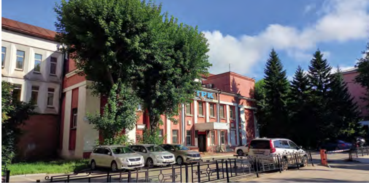
< Рис. 14. Старое двухэтажное здание радиостанции в Иркутске. 2023

на исторической фотографии, сохранившейся в его архиве с 1930-х годов прошлого века (рис. 17, сидит первый справа).