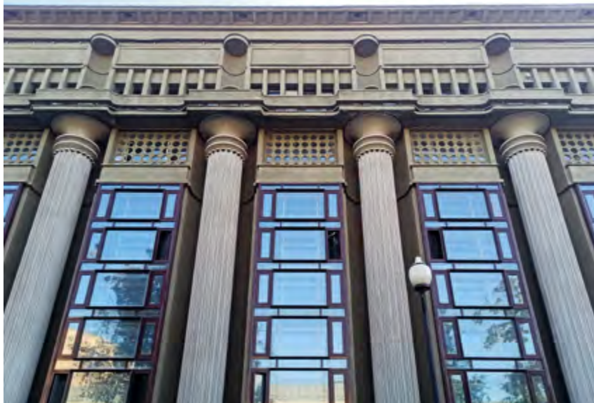
^ Рис. 3. Здание электростанции Московского метрополитена. Архитектор Д. Ф. Фридман. 1935.