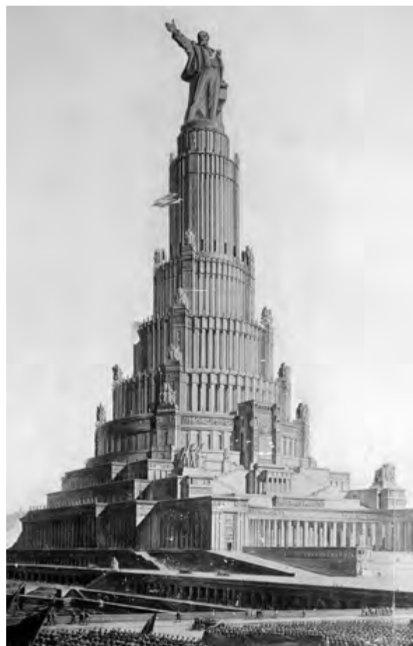
^ Рис. 1. Проект Дворца Советов. Архитектор Б. М. Иофан. 1934 ( https://archi.ru/russia )

6. В работах, выполненных до и после 1932 года, можно заметить, как правило, больше различий, чем общих черт. Таковы, например, работы И. Голосова или Г. Бархина. Это было радикальное, оформленное в текстах статей изменение творческого почерка [4].