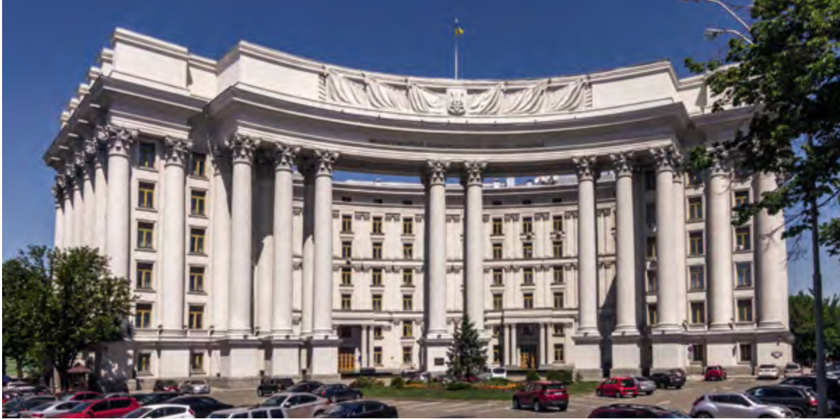
^ Рис. 7. Здание ЦК Коммунистической партии Украины в Киеве. Архитектор И. Г. Лангбард, 1935–1939 ( https://it.wikipedia.org )

и Ленинградского проспектов, осуществленная в конце 1930-х – 1940-е годы, была уже реализована исключительно в неоклассическом стиле.