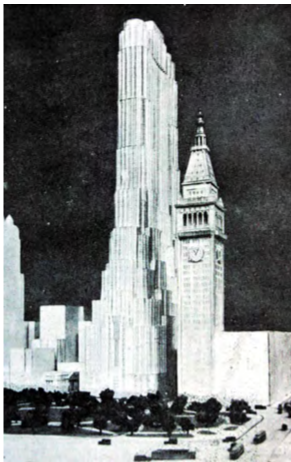
^ Рис. 2. Проект Метрополитен-иншуренс-билдинг. Архитектор Х. В. Корбетт. 1928 (Архитектура СССР. № 7. С. 5)