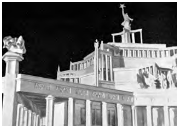
> Рис. 10. Проект Театра Красной Армии. Архитекторы К. С. Алабян и В. Н. Симбирцев. 1934 [17, с. 8]