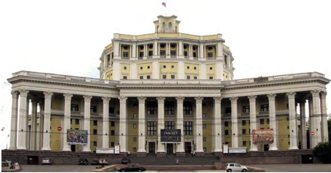
< Рис. 12. Театр Красной Армии. Архитекторы К. С. Алабян и В. Н. Симбирцев. 1940.