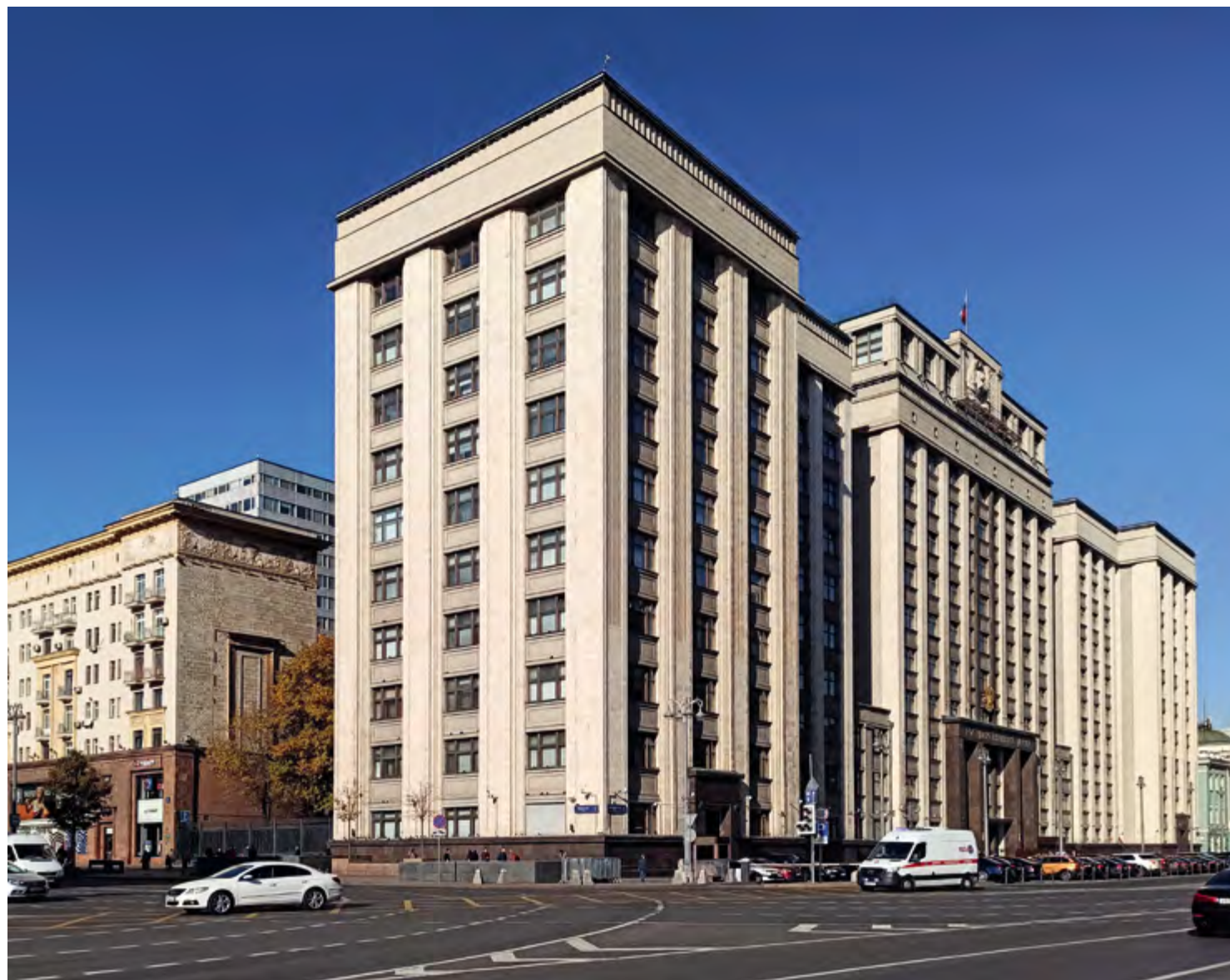
v Рис. 5. Дом Совнаркома СССР. Архитектор А. Я. Лангман. 1934. Фото автора

10. Лозунг «Догоним и перегоним», призывающий сократить экономическое отставание от капиталистических стран, появился еще в речах В. И. Ленина (1917) и И. В. Сталина (1927, 1931). Так мыслили лидеры страны, так говорило искусство. В 1929 году был выпущен выразительный плакат «Кто кого? Догнать и перегнать», В. В. Маяковский упоминает этот лозунг в своем стихотворении «Американцы удивляются» (1929).