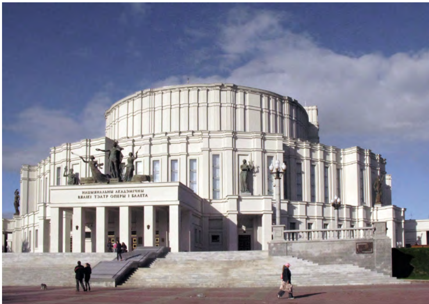
^ Рис. 6. Здание Театра оперы и балета в Минске. Архитектор И. Г. Лангбард, 1934.

Иллюстрирует эту трансформацию середины 1930-х годов усиление консервативных, анонимных, неоклассических черт в архитектуре – проектирование и строительство здания Центрального театра Красной Армии в Москве (К. С. Алабян, В. Н. Симбирцев). Один из первоначальных вариантов проекта был выполнен в макете и опубликован в 1934 году, он был решен в формах ар-деко. Однако при реализации все детали театра были уже трактованы академично (вызывая в памяти русты дворца Фарнезе в Капрароле и барабан церкви Санта-Мария-делле-Грацие в Милане) 14 . Застройка ответственных московских магистралей – Ленинского, Кутузовского