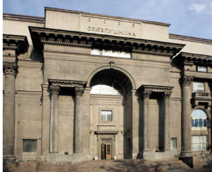
^ Рис. 4. Дом Союзпушнины в Ленинграде. Архитектор Д. Ф. Фридман. 1937.

7. Вместо циркульных арок мастера стали использовать прямоугольные порталы и рамы, сложные наличники заменять простыми кессонами, а вместо классических деталей рисовать неоегипетские карнизы и выкружки, неархаические уступы и аттики и оставлять колонны без баз и капителей.